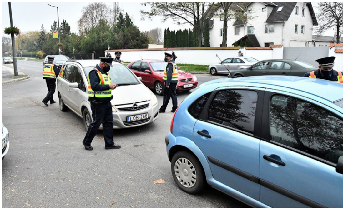
Ilyenkor több a rendőr az utakon. Leselkedő veszélyek