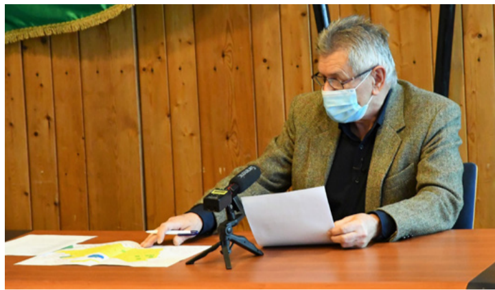
A polgármester a kötelező maszkviselés határait jelző térképpel. Ha valakinek nincs maszkja, igényelhet

Az Ajkai Család- és Gyermekeket szolgáló Központban a csoportos rendezvények szünetelnek, a karácsonyi rendezvények elmaradnak. A házi segítségnyújtás, valamint az adományok kiszállítása, a rászoruló emberek