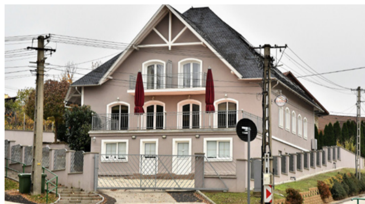
A „Mangó” már tavasszal feladta a küzdelmet

hetnek be, ahol a helyiségben egyszerre csak egy vásárló tartózkodhat. Az éttermek azzal próbálkoznak, hogy étlapjukat a közösségi oldalakon népszerűsítik. Délben a menüt a betérők már nem helyben fogyasztják el, hanem magukkal viszik haza. Ennek ellenére a vendégek száma nem csökkent érezhetően. A pincérek a vendégek kiszolgálása helyett