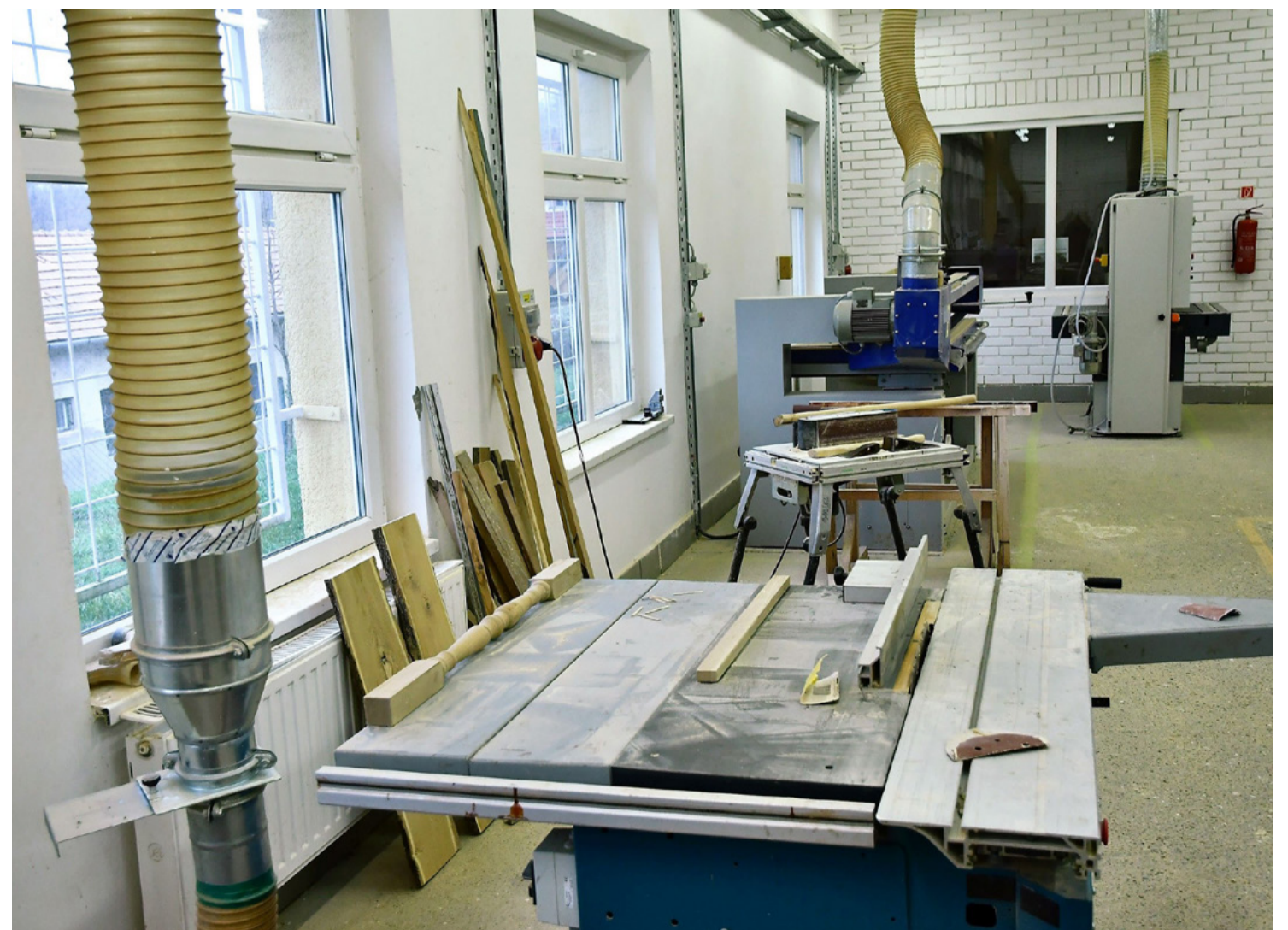
Az üres tanműhelyek tanulókra várnak. Tájékp csata közben