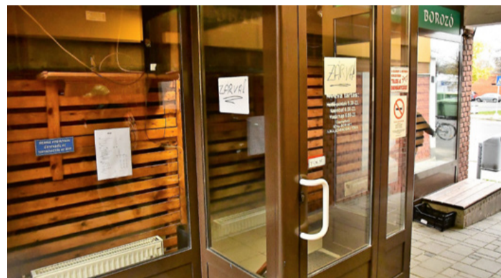
A Pintes Borozó „pihenőben”