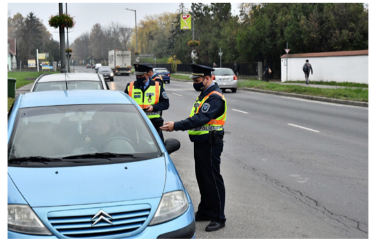
„Jó reggelt, valamint személyit, jogosítványt és forgalmi engedélyt...!”