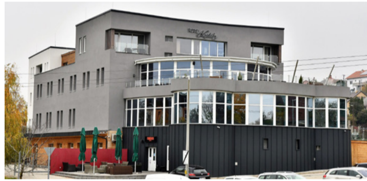
Az üzleti úton lévők egyik utolsó bástyája, a Kristály Hotel

■ Elvitelre ugyan lehet cukrászsüteményt vásárolni, de a cukrászdák így is megérik a korlátozást. Sokan egy finom sütemény vagy kávé elfogyasztását ismerőseikkel való találkozással, egy jó beszélgetéssel, munka utáni lazítással kötötték össze. Most ez legalább december 11-ig nem lehetséges. Addig tart ugyanis a kormány által november elején kihirdetett 30 napos tilalom, amelyet a vírus terjedésének mérséklése miatt hozott a kormányzat. Indokolt esetben a határidőt meg is hosszabbíthatják. Az éttermek is csak kiszállítást vállalhatnak, vagy elvitelre szolgálhatják ki a betérőt. A legtöbb helyen ki tudják elégíteni a szállítási igényeket is.