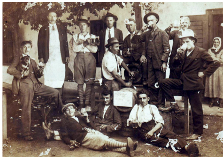
Bódéi zsánerfotó a harmincas évekből