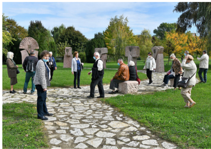
Nyugdíjasok pihenőben a Jubileumi Park emlékműnél