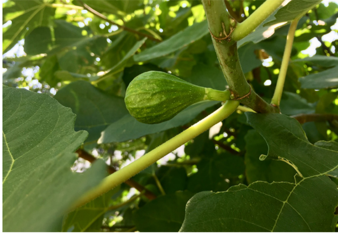
Egzotikus gyümölcs. Bor és pálinka is készülhet belőle