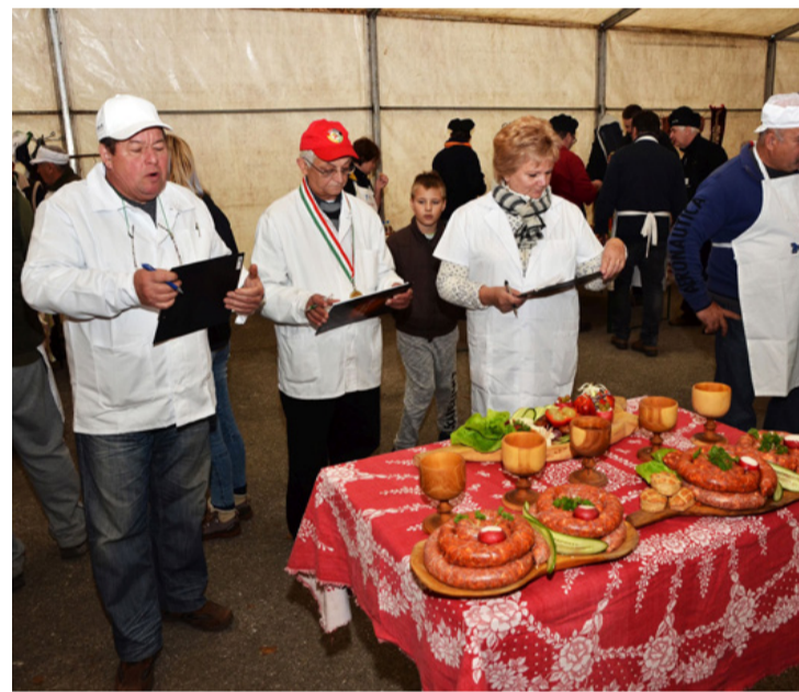
Most csak a régi fotók idézik a jó hangulatot a Tóberkóbiról. Ínycsiklandó zsűrizés