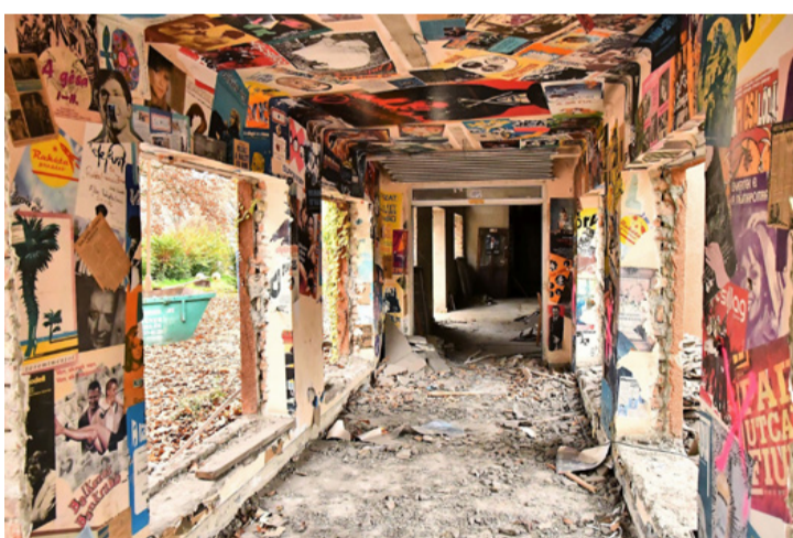
Bontás közben a kultúra különböző rétegei bukkantak elő. Több generáció újra otthonra és egymásra találhat itt

■ Szeptember közepén kezdődött meg a Kaszinó épületében az Okosház kialakítása, mely az Ajkai Kapocs Helyi Akciócsoport közösségi tervezéssel készült legjelentősebb projektje, a TOP-7.1.1-16-H-070-12 számú felhívás keretében. Ha a tervek megvalósulnak, több generáció is otthonra találhat és új lehetőségekhez juthat az egykori Kaszinó épületében.