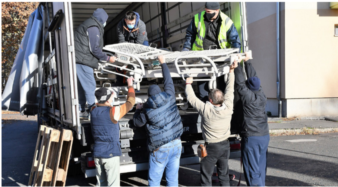
Tizenkét ágy érkezett Németországból. Segítő kezek