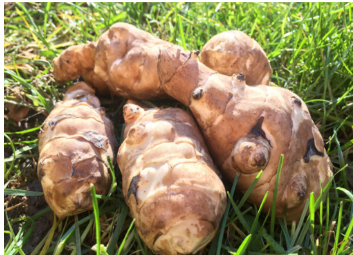
Valóban nem valami szép, de egészséges és finom. Ahol sikerül megtelepíteni, onnan szinte kiírthatatlan

■ Csókapyók, földialma, tótrépa, jeruzsálemi aricsóka, indiángyökér, indiánkrumpli, napgyökér, földi napraforgó, földi szarvasgomba... szinte megszámlálhatatlanok a csicsóka népnyelvi elnevezései. Kevés olyan élelmiszernövény akad amely annyi félreértés, félrehallás következtében oly sok névre tett volna szert, mint ez az Észak- és Közép-Amerikában őshonos nálunk méltánytalanul mellőzött növény. Bár az utóbbi időben kezdik újra felfedezni, még mindig nem eléggé népszerű, bár változatosan elkészíthető konyhai alapanyag.