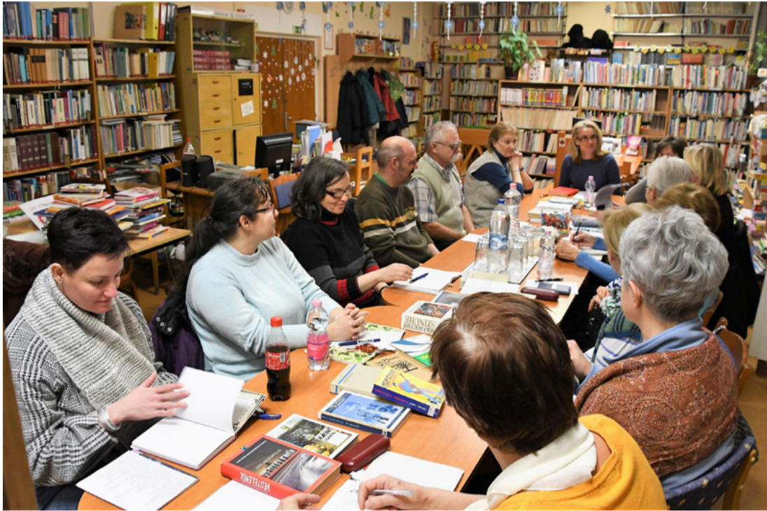
Az írás egyik titka, hogy olvasni is kell, méghozzá sokat és sokfélélt