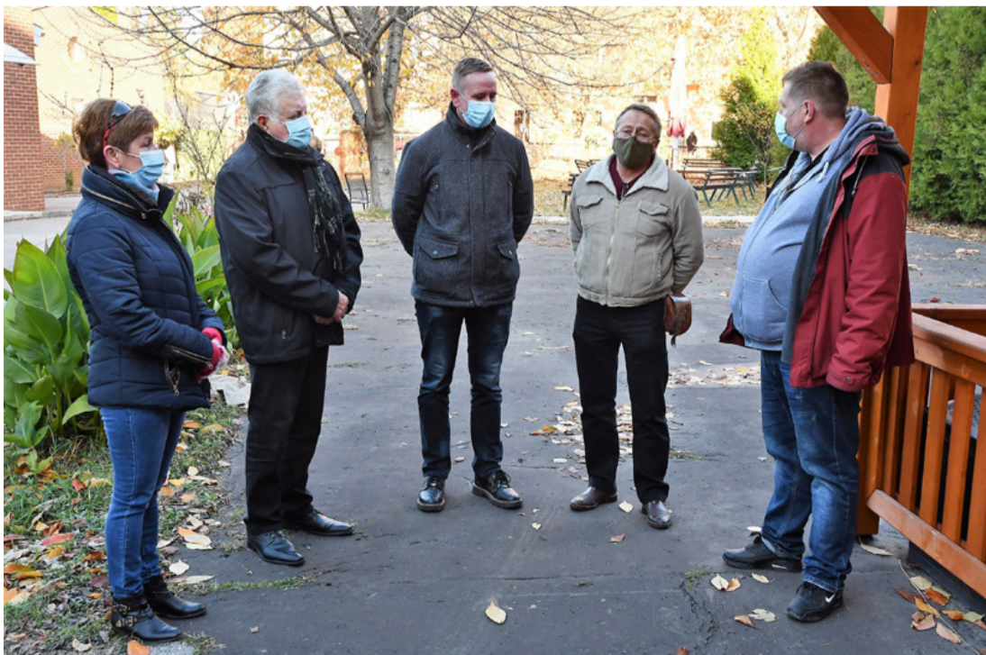
Adományozók és elfogadók. Székely, magyar sok jó barát