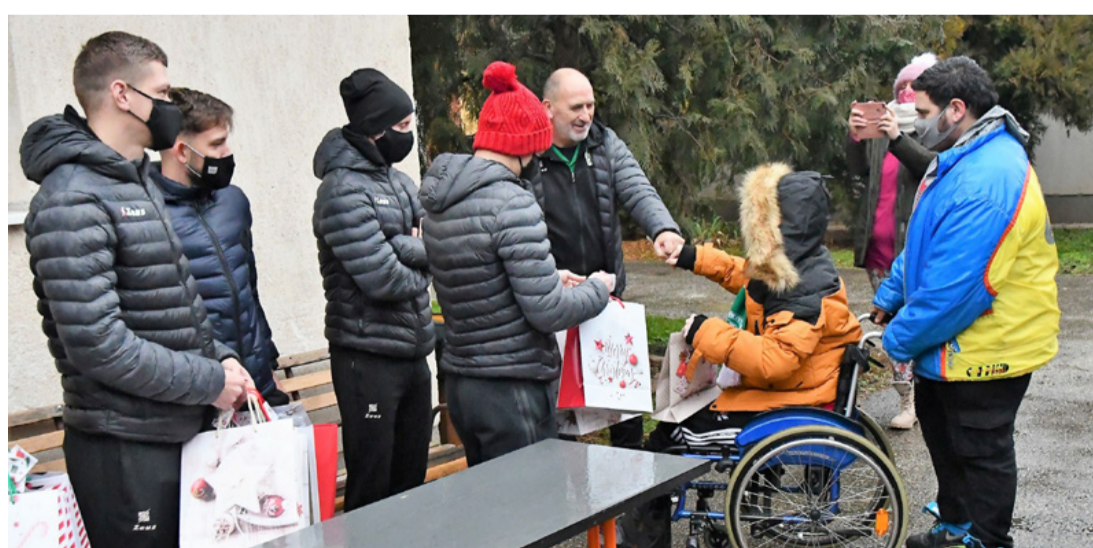
A barátság és a szeretet jegyében. Öröm csillan a szemekben.