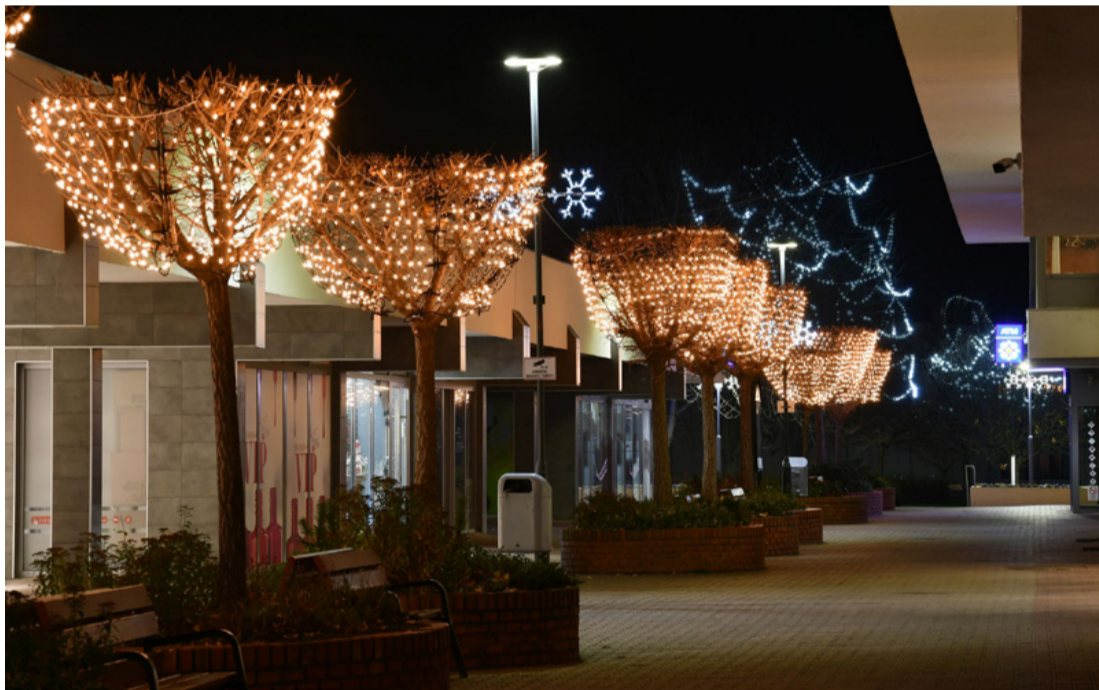
Talán még soha nem volt ilyen szép a belváros

Módosulnak a maszkviselés területi szabályai