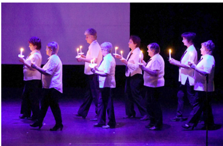
Egy szívmengető kép tavalyról az archívumból. Vigyáznak kor- és osztálytársaikra