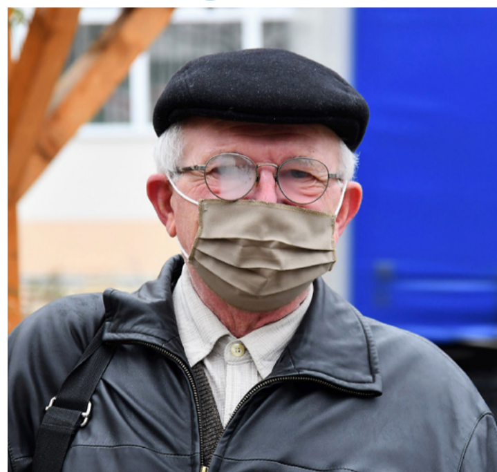
Az idősebbek kivétel nélkül komolyan veszik a maszkviselés fontosságát. Távozz tőlem vírus!

A megkérdezettek közül az időskorúak azt válaszolták, hogy 11 óra után mennek vásárolni. Többségük a közeli gyógyszertárba igyekezett, de az élelmiszerboltokba is láttunk betérőket. Ők azt vallották, hogy a vásárlási időkorlát teljesen felesleges, ha igaz, hogy a maszk megvéd a fertőzésektől (nem igaz – a szerk.), és betartják a védőtávolságot. Néhányan viszont