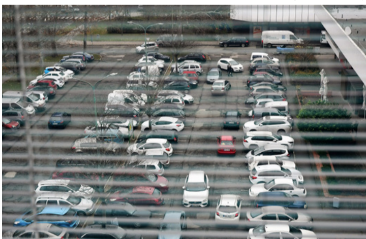
Mindenhol csak ront a helyzeten a kormány által elrendelt ingyenes parkolás. Az önkormányzatnak bevételkiesés, az autósoknak bosszúság

A Városi Óvodák közül novemberben 6 óvodában rendeltek el rendkívüli szünetet.