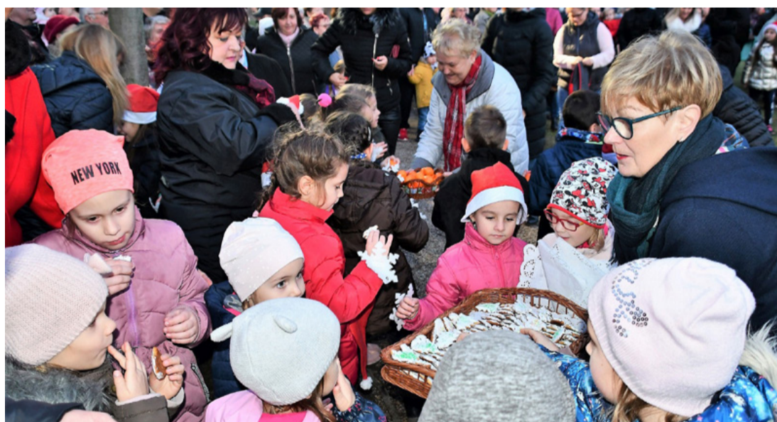
Tavaly még nagy volt itt a nyüzsgés. Ami késik, nem múlik