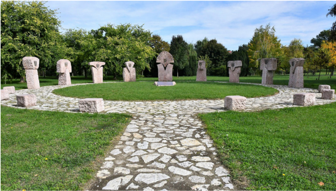
A Kötődéskör Ajka város 50. születésnapjára készült