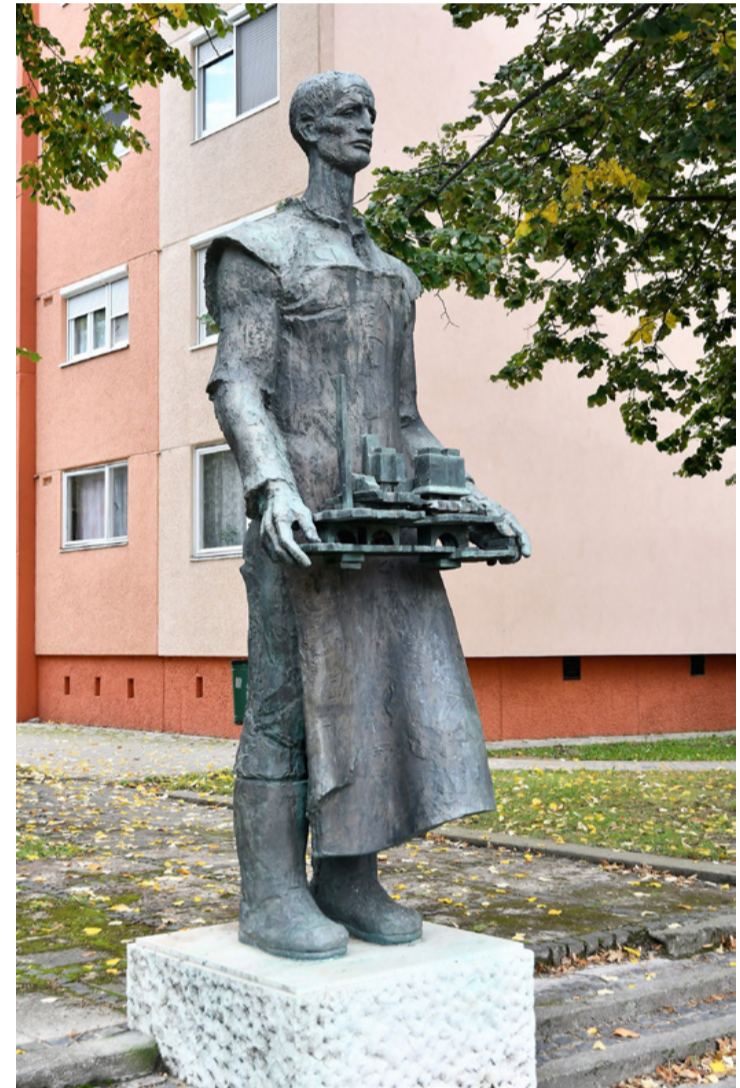
A Városépítő vérbeli szocreál szobor