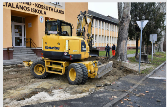
Nem kis felfordulással jár a járdaépítés. A vírus csökkentette a forgalmat