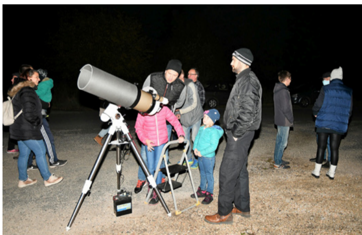
Egy sikeres közönségtalálkozó Csingerben. Csillagokat láttak

Babucska közösségi házban két tagjuk a szünetben vezette két héten át. A számítástechnika, a programozás, a legépités iránt érdeklődő diákok ezalatt sokat tanulhattak.