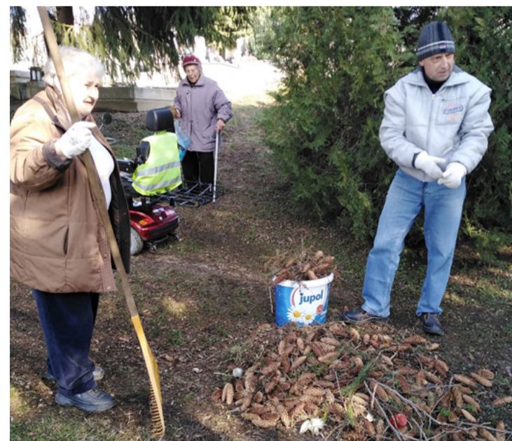
A klubtagok korukat meghazudtolva, néhány óra alatt rendet tettek a temetőben