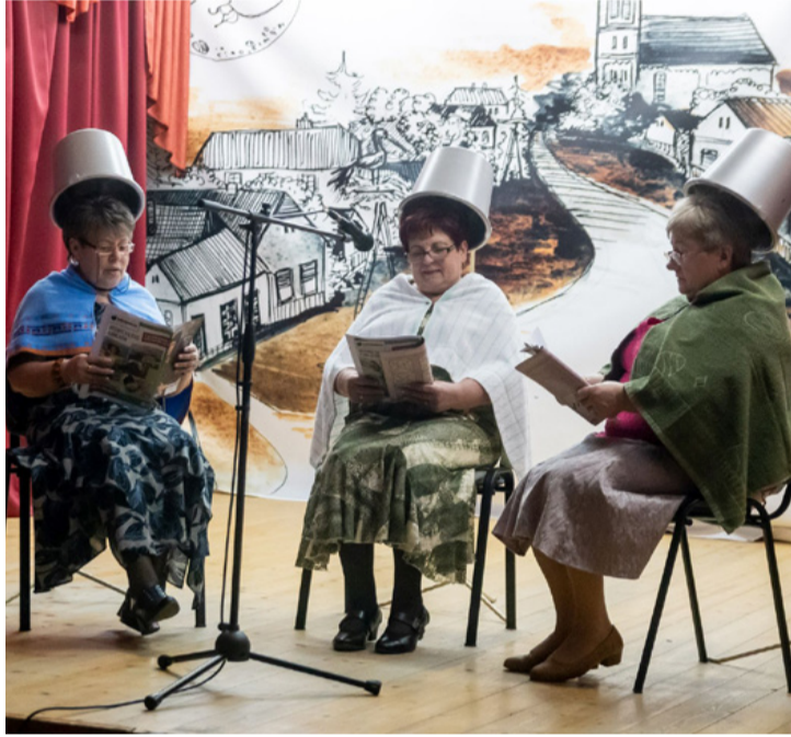
Nagy sikert arattak a színpadi jelenetek