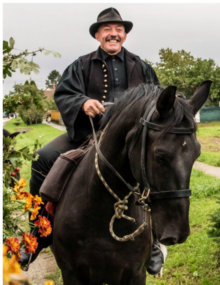
Cimbi, az utolsó falusi reneszánsz ember