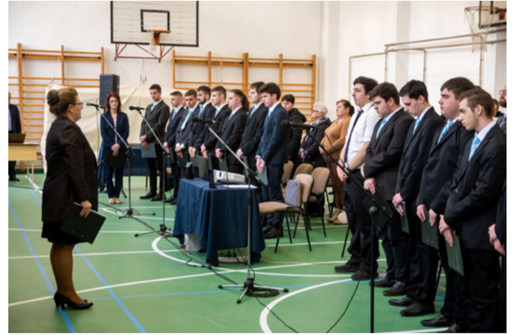
Életük jelentős mérföldkövéhez érkeztek a bercsényis diákok

– Mutassátok meg azt, hogy nincs lehetetlen, tudtok kellemes meglepetést okozni, van bennetek elég akarat és kitartás a hátralevő középiskolási időre majd egy egész életre – fogalmazta meg beszédében