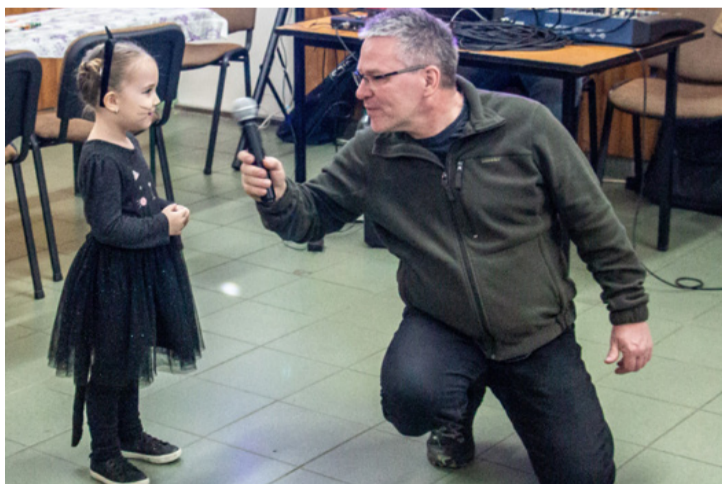
A jelmezverseny győztesét faggatja az alkalmi riporter

■ Az Ajkarendekért Egyesület nagyszerű télűző farsangi mulatságra várta február 18-án a helyieket és az érdeklődőket a falu művelődési házába. Az este hat órakor kezdődő programra érdemes volt jelmezben érkezni, hiszen az est folyamán a legjobb jelmezt viselők ajándékban részesültek. A farsangi időszakhoz hagyományosan táncos mulatságok és téltemető népszokások is tartoznak, melyeket az Ajkarendekért Egyesület idén is felelevenített.