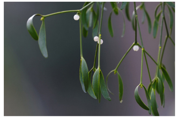
Fagyöngy ág közelről. Dekoratív, élősködő növény, amit a népi gyógyászatban használnak, de célszerű védekezni elszaporodása ellen

Mivel a fagyöngy terjedését a madarak segítik azzal, hogy miután megették a bogyókat,