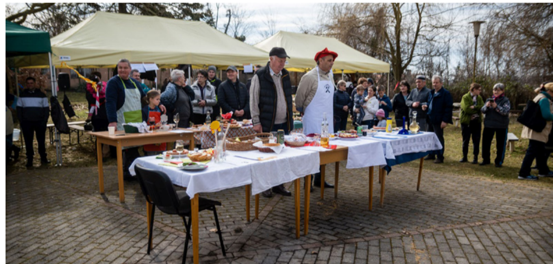
Az eredményhirdetés egyik feszült pillanata

A hagyományteremtő Padragkútért Egyesület által szervezett közösségépítő