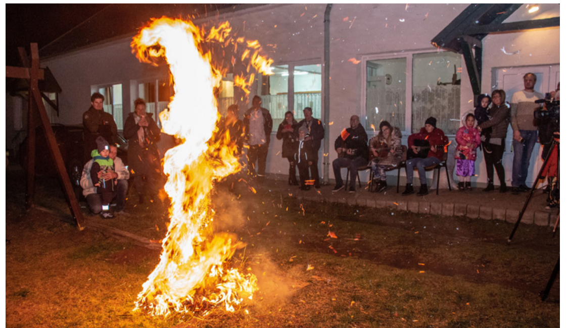
A hatalmas tűz a művelődési ház udvarán, kegyelemelőadás a télnek