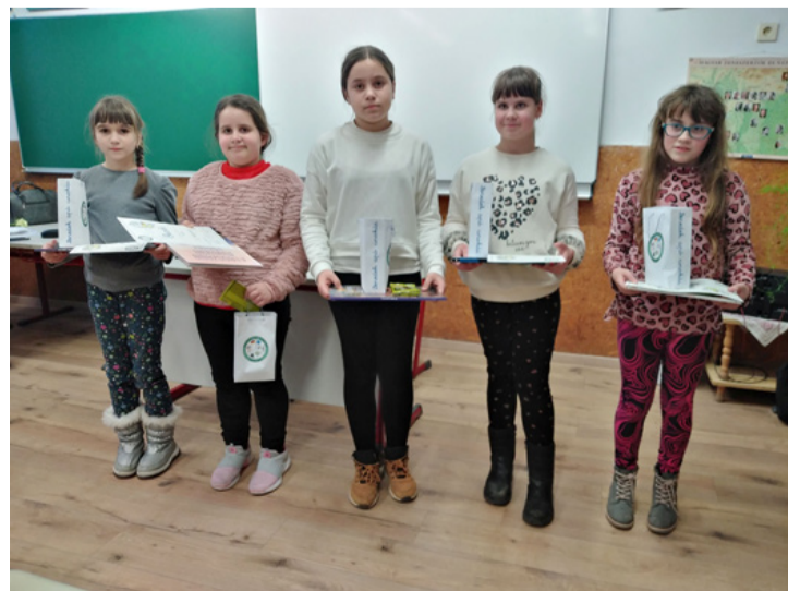
A győztesek az ajándékkal

abba, hogy milyen napjuk volt. A bánatukat ugyanúgy fogalmazzák meg, mint az örömeiket. Amikor látogatóba megy hozzájuk, mindig megmutatják mit írtak. A zsűri elnöke kérte a versenyzőket, hogy olvassanak sok mesét, mert azon kívül, hogy hasznosan töltik az idejüket, bővíti a szókincsük. Minden versenyző emléklapot és édességet kapott, a helyezettek