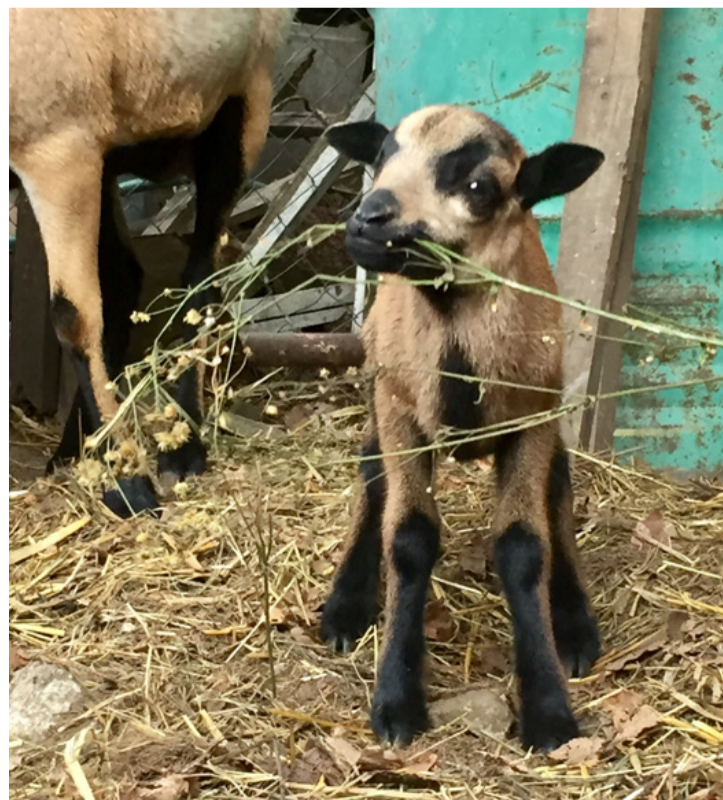
Enivaló kis jószág

Az állatok általában jól alkalmazkodnak a száraz és forró klímához, de a hideget is jól tűrik, így ellenállóbbak a különböző betegségekkel szemben. A juhok gazdája szerint az állataira egyáltalán nem ér-