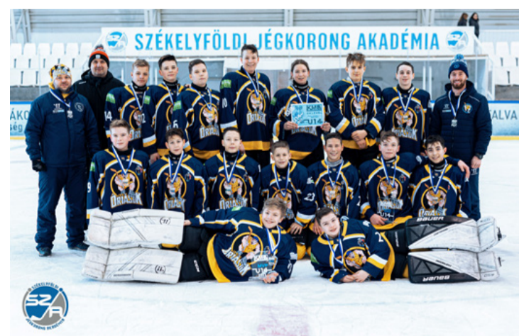
Jól megélnék a jégen is az Óriások