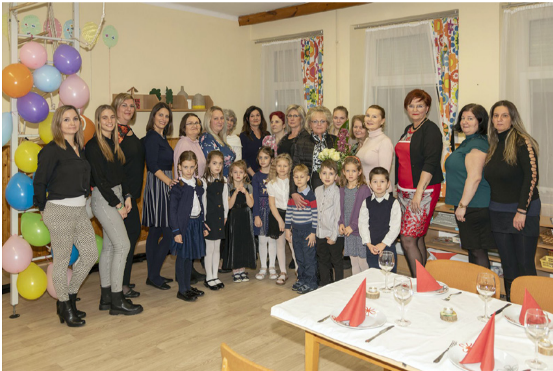
Egy „családi fotó” a búcsúestről