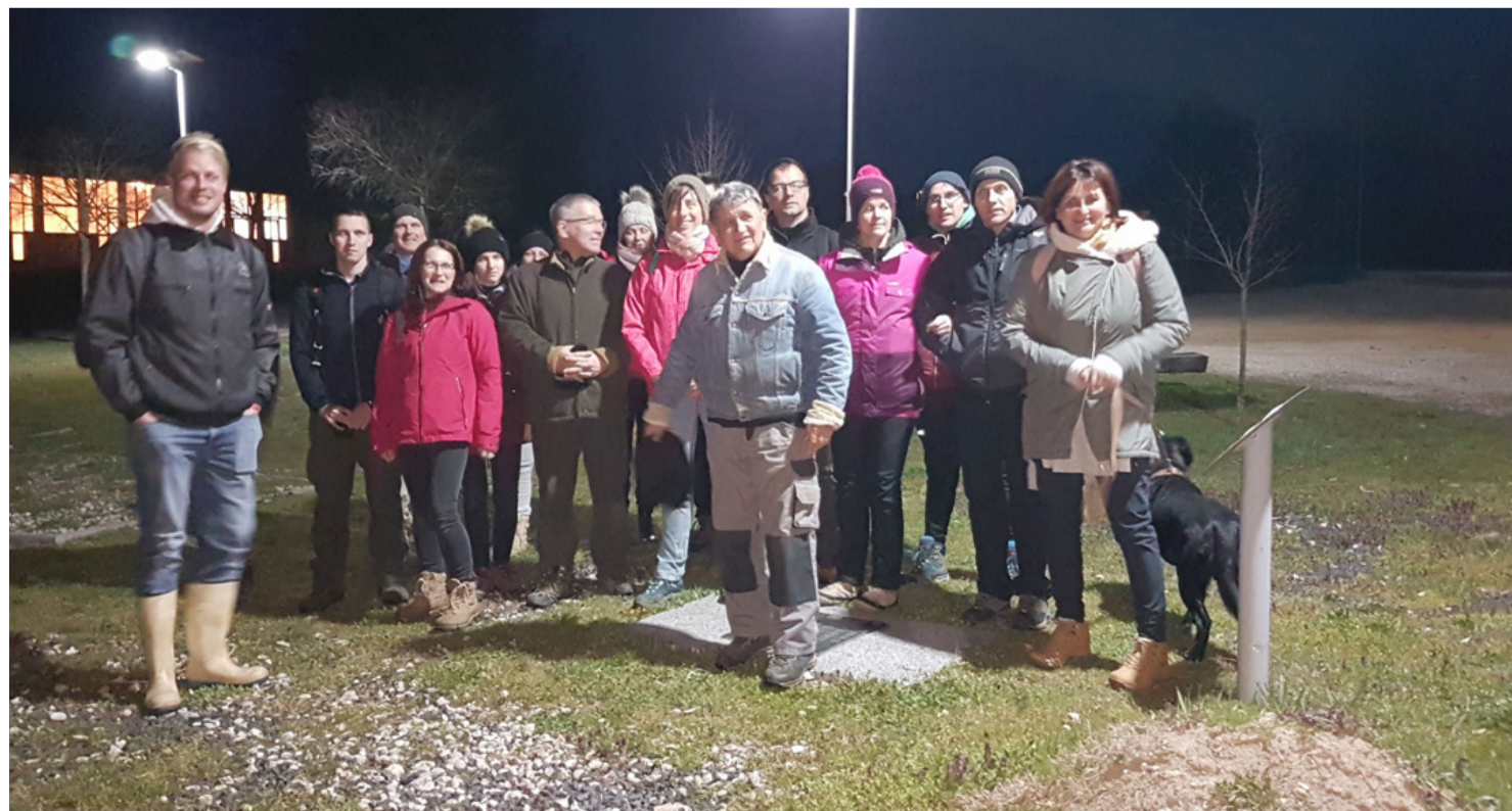
A rendeki zarándokok indulás előtt