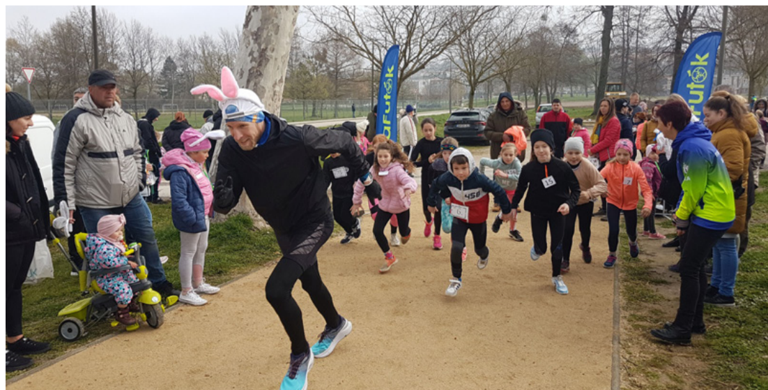
A picik örömmel eredtek a „nyúl” nyomába

A szervezők bíznak abban, hogy az ilyen és az ehhez hasonló kezdeményezések felkeltik a fiatalok érdeklődését a futás és más sportok iránt, és ezzel a sportos és egészséges életmód is nagyobb szerepet kap életükben.