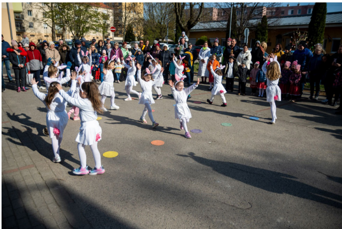
Öröm volt nézni őket

A rendezvény költségeit a Dorner öntöde vállalta magára.