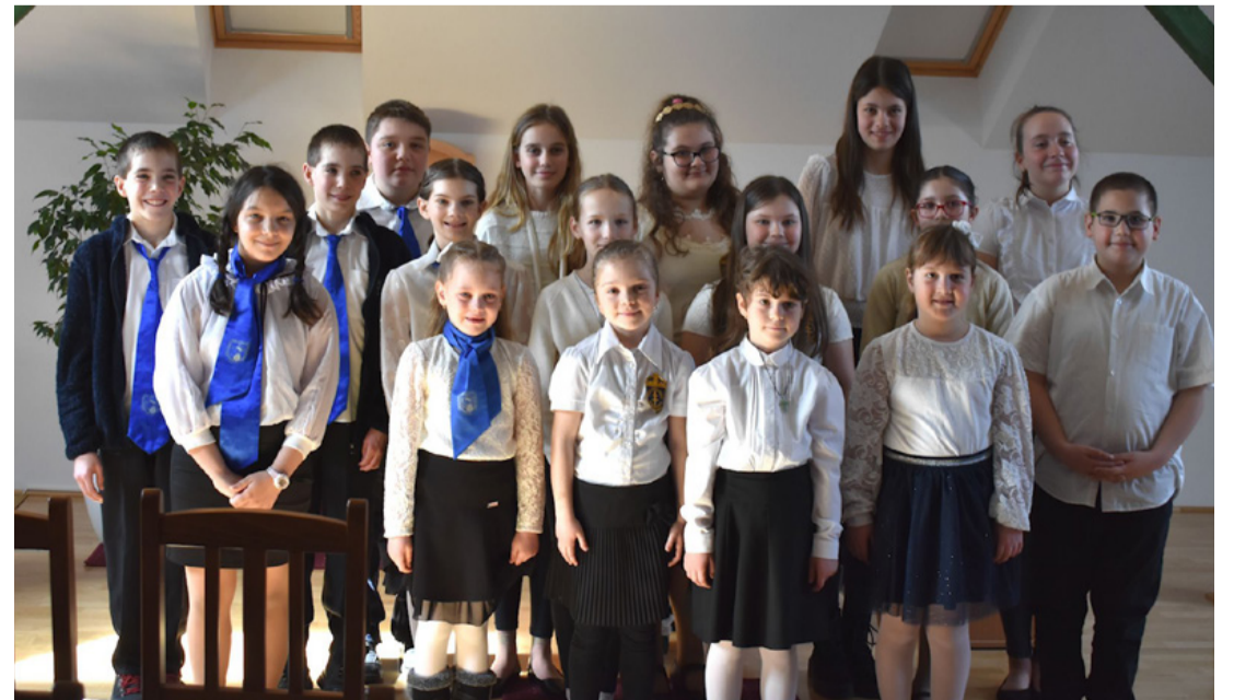
A SZIK Énekverseny résztvevői