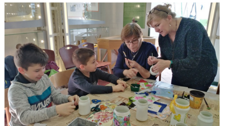
(ta) ■ Minden korosztály alkothatott

A kiállítás megnyitóján a szervezők a kézműves műhely padragkúti telephelyén természetesen mentából készült szörppel is megvendégelték az érdeklődőket. A programon az alapítvány dolgozói által készített termékeket is megvásárolhatták. A befolyó összeggel a megváltozott munkaképességűek foglalkoztatását támogatják.