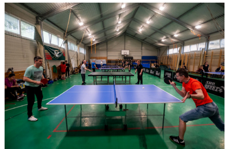
Késhegyre menő küzdelmeket láthatott a gyér számú közönség

Bock Hungária Kft - 22 pont Kókai Kft - 18 pont Sportváros Kft - 16 pont Leonardo Dekor Kft és Ajka Járásbírószág 12-12 pont Arida KKT - 10 pont Magyar Posta Ajka és Poppe és Potthoff 8-8 pont Tesco Ajka és Bau-Fal Kft 6-6 pont Napszillag Kft és Hydro Vidra Kft 4-4 pont Rendőrkapitánység és Velux Kft 2-2 pont.