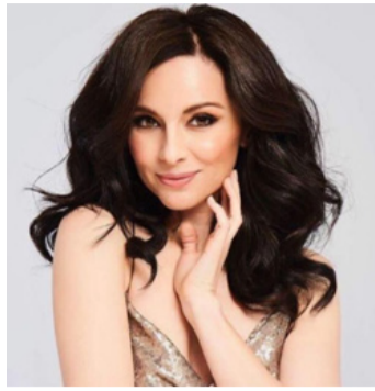
lemez birtokosa. A pop dalok mellett hallhattunk már tőle

Fonogram- és EMeRTon-díjas magyar énekesnő a Cotton Club Singerstől való elszakadása után hihetetlenül sikeres szóló karriert futott be. Több tucat toplistas sláger, négy platina és ugyanannyi arany-