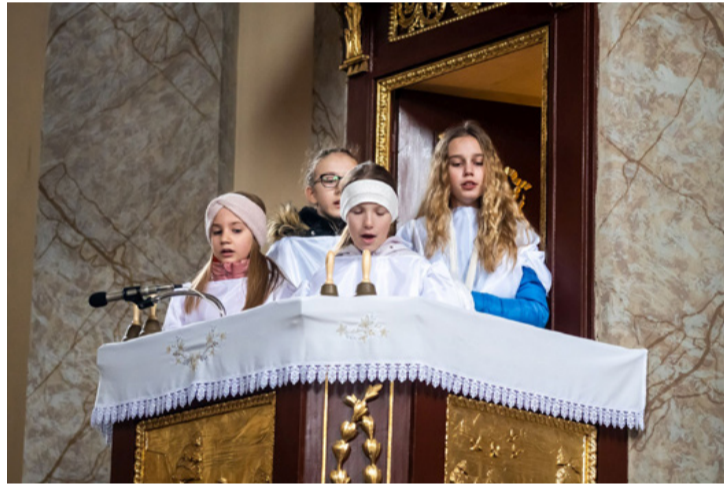
Az angyalokat megszemélyesítő gyermekek a szöszékről énekeltek