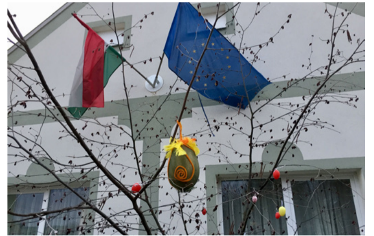
A rendeki tojásfa az egyesület tojásával

A látogatók szabadon alkothattak az asztalokon kihelyezett alapanyagokból, semmi sem volt kötelező. Az egyesület tagjai csak ötleteket adtak arra vonatkozóan, hogy milyen díszeket lehet készíteni. A résztvevők egymást segítve, alkotottak szebbnél szebb húsvéti ab-