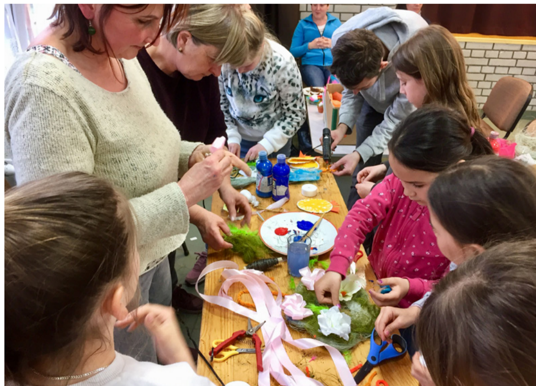
Kisik és nagyok együtt alkottak