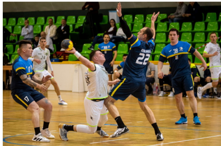
Ha valaki letérdel, még nem biztos, hogy alárendelt szerepet játszik...

■ A kézilabda NB I/B-ben szereplő KK Ajka az azonos pontszámmal szereplő Százhalombattai KE együttesét fogadta az ajkai sportszarnokban kétszáz néző előtt a kézilabda bajnokság 24. fordulójában.