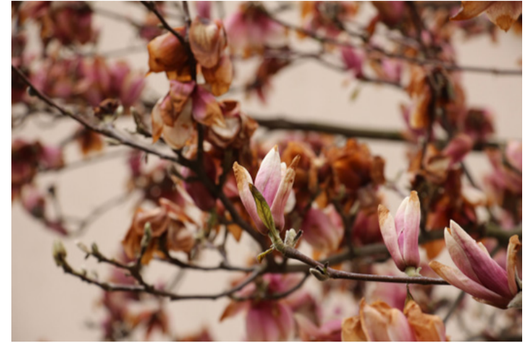
A magnóliát sem kímélte a fagy

A tavaszi kertekben ilyenkor nem csak a gyümölcsfák, hanem a díszfák, cserjék és díszbokrok is virágba borulnak. Sajnos nagy részük szintén nem viselte jól a mínuszokat. Évek óta látványszámba megy a szomszédomban lévő hatalmas liliumfa vagy más néven magnólia. Sokan megcsodálják az utcánkban, a hatalmas lila virágai miatt. Kétségkívül feltűnő jelenség. Csak úgy vonzza a tekinteteket. A négy méteres fát még csemete korában ültették a kert közepére. Mindig ilyenkor, húsvét táján virágzik és a hatalmas virágai ámulatba ejtő látványt nyújtanak a kopár hónapok után. Különlegessége, hogy igen korán virágzik, még lombfakadás előtt. Így a levelek nem