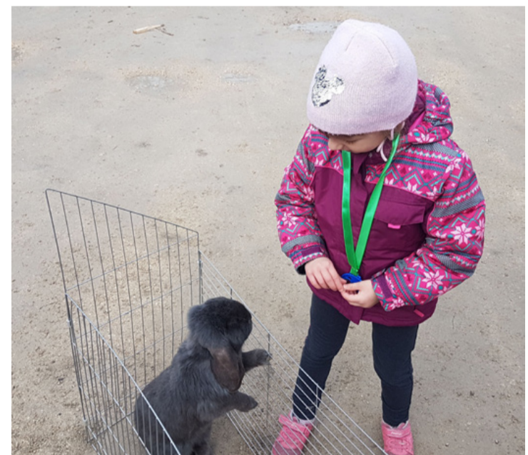
Én a nyuszi vagyok. Hát te ki vagy...?

Az indulókat öt korcsoportra osztották, az életkorhoz igazítva a távokat is. A legfiatalabbak, akik 2017 után születtek, a nyuszi vezetésével 500 métert futottak, míg a 2016-2017 közöttiek már 600, és a 2014-2015-ös korosztály 800 méter. A 2012-2013 és a 2010-2011 korosztály külön indult, de mindenkinek 900-900 mé-