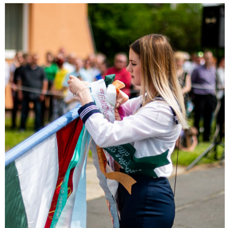
A Bánkiban is felkötötték a szalagot az iskolázászlóra