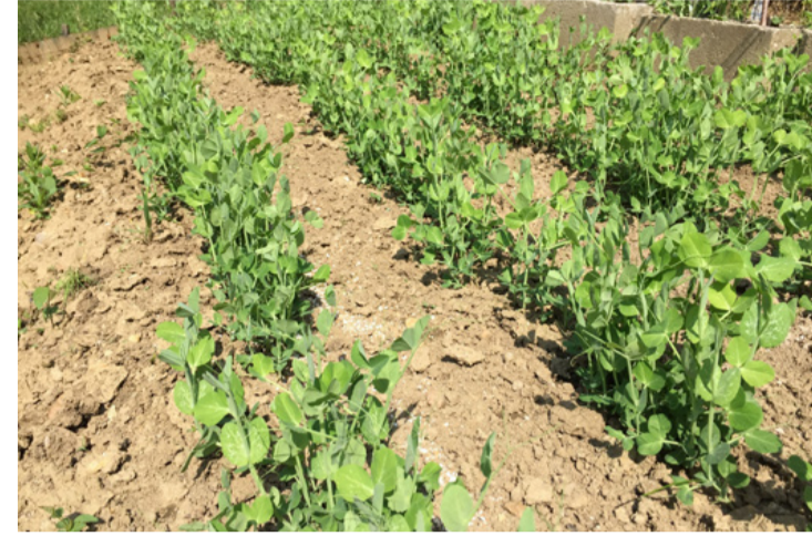
Nemsokára itt a „borsószezon”

A veteményeskert mellett nézzük át a virágoskertet is. A tavaszi hagymás növények közül különösen fontos odafigyelni a tulipánra és a