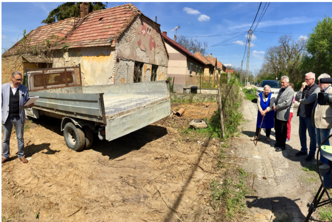
Miután megpecsételődött a 21. sz. ház sorsa, megnyílik az út a vízelvezetést szolgáló fejlesztések előtt

■ Ajka-Padragkút városrész cséki részénél már évek óta gondot jelentett a szőlőhegy felől érkező nagyobb intenzitású csapadék elvezetése. A helyzet megoldása érdekében az önkormányzat kisajátította a Padragi út 21-es számú ingatlant, aminek lebontása után lehetőség lesz új vízbefogadó kialakítására. A csapadékvíz kiépítését 2023 év nyarán tervezi megvalósítani az önkormányzat.