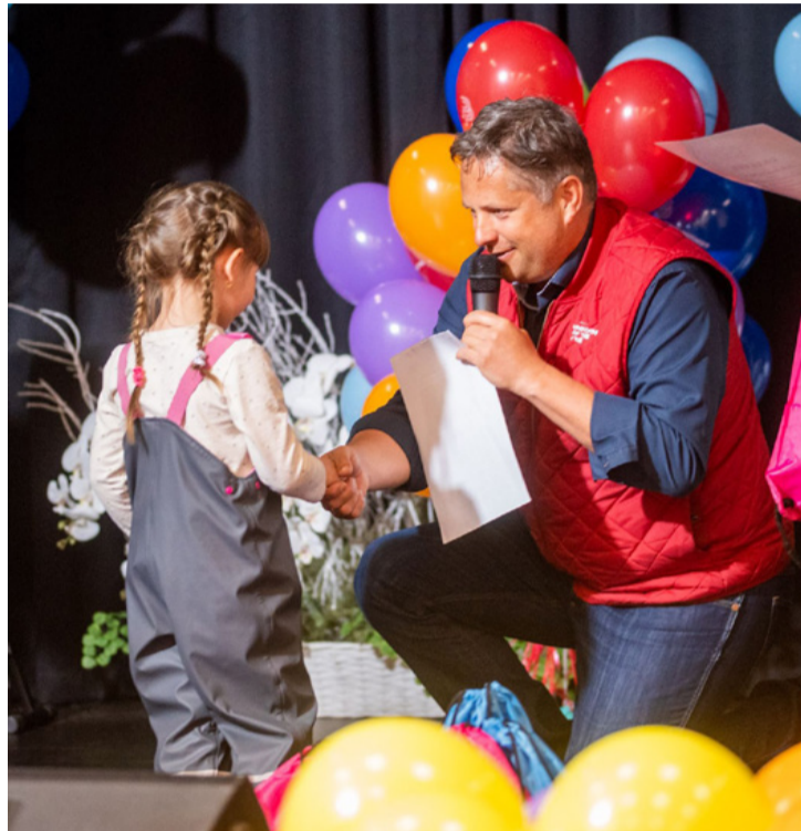
Egy ilyen programon mindenki csak nyerhet

■ Élményekben gazdag kirándulást, hasznos ajándéktárgyakat, vásárlási utalványt kaptak a Poppe és Potthoff Hungária Kft. által ötödik alkalommal meghirdetett Mentsd meg a madarakat! Óvd a természetet! elnevezésű alkotó pályázat díjazottjai. A díjátadót május harmadikán tartották az Ajka Kampuszon. A résztvevők többsége óvodás és kisiskolás volt, de felnőttek is pályáztak.