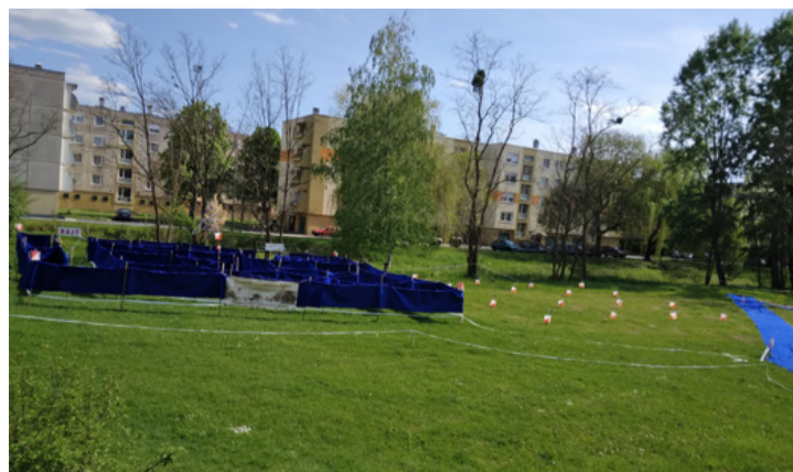
A malomkerti pálya várja a résztvevőket

Óvodás- és általános iskolás csoportoktól előzetes beje-