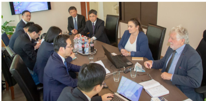
A ningboi küldöttség a polgármesteri irodában