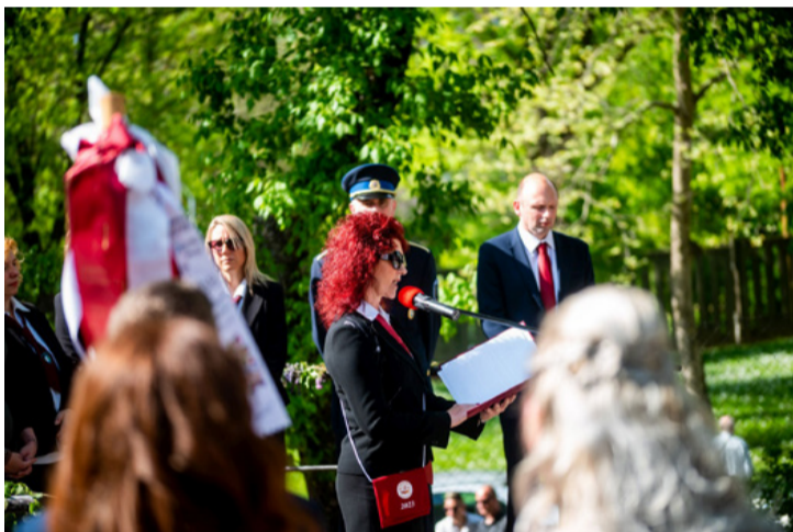
Pillanatkép a Szent-Györgyi ballagásáról

■ „Álmodtam egy világot magamnak, itt állok a kapui előtt...” – hangzott fel a Veszprémi Szakképzési Centrum Szent-Györgyi Albert Technikum és Kollégium épületében és udvarán. A 2022-2023-as tanévben ismét a Szent-Györgyi kezdte a ballagások sorát pénteken kora délután. Az egyforma ruhában ballagó osztályokat büszke szülők, nagyszülők, hozzátartozók várták az udvaron.