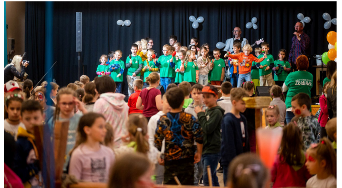
A díjkiosztó kavalkádjá