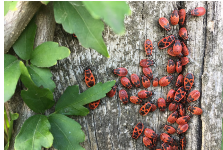
A bodobácsok kolóniái nem jelentenek veszélyt a kert növényeire

A verőköltő bodobács tápláléka többnyire növényi eredetű. A levelek és a növényi szövetek