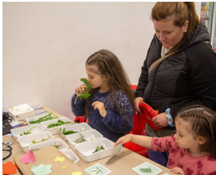
A gyógynövények ismerete hasznos és fontos tudás lehet