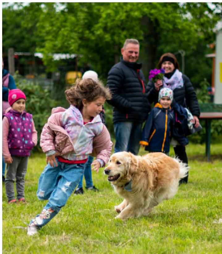
A Buxsi sulis ezúttal is izgalmas programokat kínált