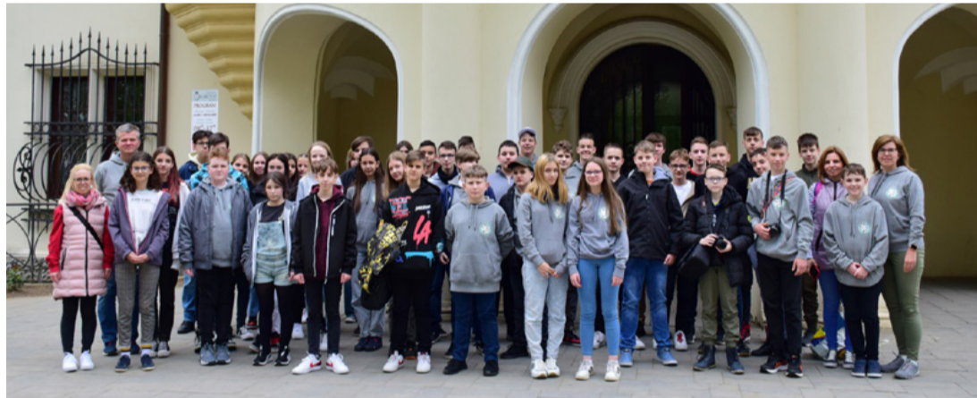
A tanulmányúton lévő csapat Nagykároly főterén