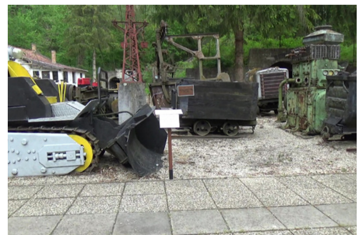
Felújított és felújításra váró bányagépek sorakoznak a szabadtéri skanzenben