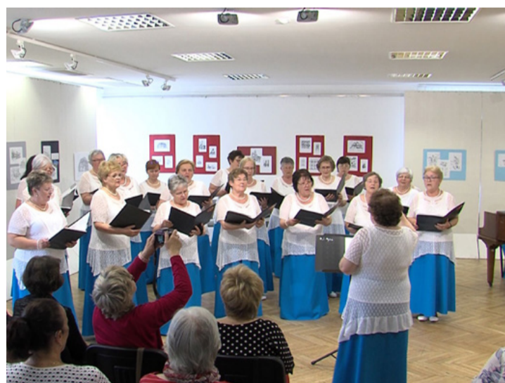
A Jubilate fellépése a VMK kiállítótermében