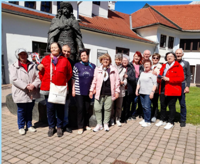
A kirándulók a fejedelem szőlőházánál, Borsiban

■ FELVIDÉK Május 3-án, a jó szervezésnek köszönhetően a kora délutáni órákban érkezünk Sátoraljaújhelyre. A Rákóczi hotelből autóbustot küldtek értünk. A szálloda egy hegy tetején van, szerpentin úton vitt fel a busz odáig. Az elhelyezkedés után buszos városnézésre mentünk. Sátoraljaújhely az egykori Zemplén vármegye székhelye szebb napokat is látott. Erre utalnak a belváros eklektikus stílusú polgárházai. Az egyik impozáns háromemeletes épület a börtön, kívülről szépen fel van újítva. A közelben van a Városháza, melynek erkélyéről Kossuth Lajos első nyilvános beszédét elmondta. Megnéztük még a Pálosok régi templomát, és a művelődési házat, melyben a Latabár Kálmán színház működik. A híres komikus színész a város szülője volt.