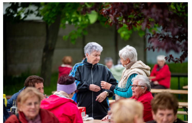
A majális egy pillanata

A kvíz kérdések megválaszolásához ismerni kellett a város múltját, gazdaságát és kulturális életét. A foglalkozás kereső szójátékban az öt foglalkozásnév kezdőbetűje adta ki a hatodikot, és sok