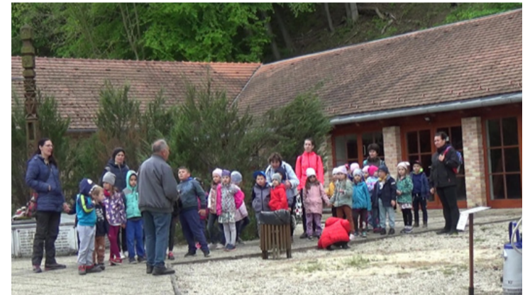
A bányamúzeum legjobb hívővői az óvodások, akik otthon mindent kifecsegnék

Hazánk első szabadtéri műszaki emlék múzeuma az ajkai szénbányászat műszaki és történelmi emlékeit mutatja be, de őriz emlékeket a magyarországi bányászat egyéb területeiről is. A gépek, berendezések, szerszámok közül nem egyet hazánk más-más bányáiban (szén, bauxit-, urán-, kő- és mangánbányában is) használtak.