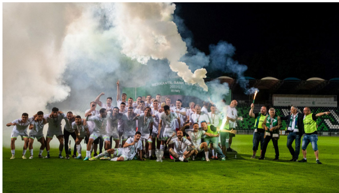
A csapat fennállása 100. évfordulóján méltóképpen ajándékozta meg a közönséget