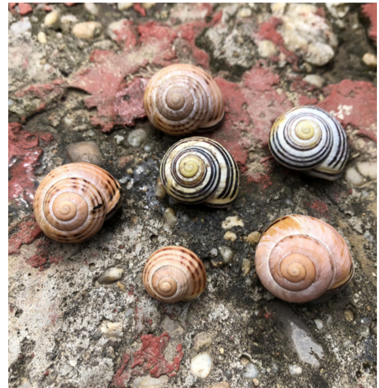
Különböző ligeti csiga fajták. A fajt sötétszajú ligetcsiga néven is említik

Nagyon gyorsan szaporodik, mivel a csigapeték 15-20 nap után kelnek ki. A fiatal csigák egy évesen érik el az ivarérettséget. Élettartamuk 7-8 év is lehet, de természetes ellenségeik miatt, a kikelt kis csigáknak csak a fele éli meg az ivarérett kort. Ház-