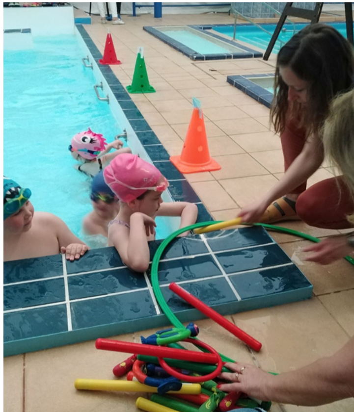
Gyűlnek a kincsek a medence aljáról

A május 15-én tartott elődöntőben öt intézményegység csapatai vettek részt, és a há-