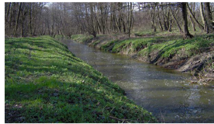
A Csigere patak a Torna egyetlen jelentősebb mellékveze

(Ajka a „körforgásos gazdasági rendszerek és fenntarthatóság” fejlesztéseinek előkészítéséhez kapcsolódóan nyert el támogatást, annak érdekében, hogy a