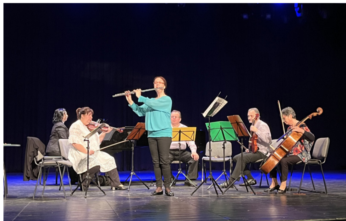
A Monarchia Szimfonikus Zenekar művészei a VMK színpadán