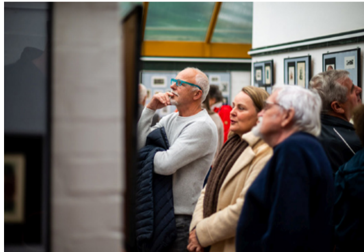
A szűk kiállítói tében mindenki talál érdekes látni- és értelmezni valót

A kiállításon külön tabló mutatja be a templomokat, a kolostorokat, a várakat, a magyar kisvárosokat, épületbelsőket, néhány munkahelyet, borospincéket, a népi építészetet, irodalommal kapcsolatos helyszíneket, Ürmös Péter grafikusművész alkotásain pedig külföldi városok jelennek meg.