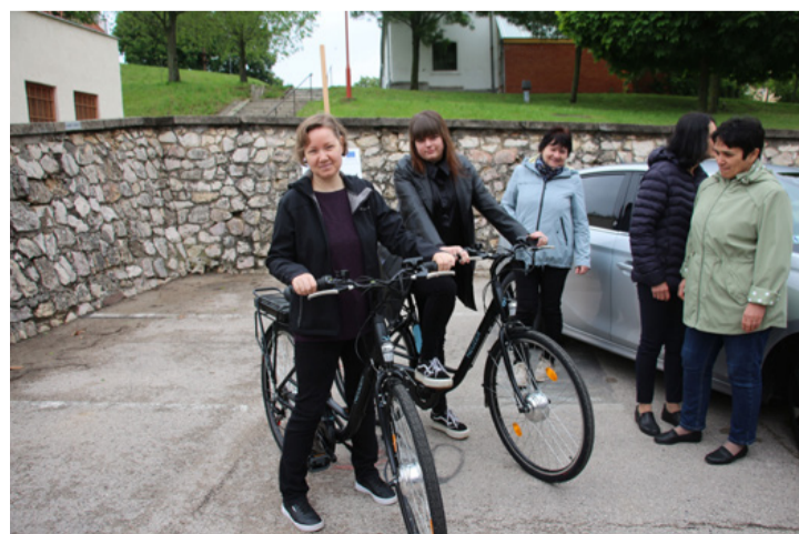
Akik felhőtlenül örülhetnek a fejlesztéseknek

terveztek között pártpolitikai alapon nincs megkülönböztetés. Ezt mutatja az ellenzéki vezetésű Ajka számos nyertes projektje, illetve az is, hogy Budapest, Miskolc és Pécs a kormány közreműködésével vehet részt a klímabarát önkormányzatok európai pályázatán – tette hozzá a miniszter. Majd így folytatta: