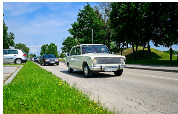
Feldübörögtek a szépkorú Ladák és Mercedesek motorjai