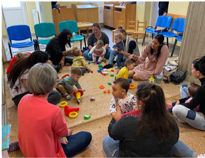
A védőnői szolgálat anyák napi foglalkozása