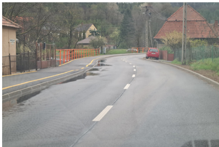
Csinger felé kanyarog a kerékpárút

■ Az ajkai levegő minőségét az Országos Légszennyezettségi Mérőhálózat folyamatosan monitorozza és elemzi. A város levegőminősége az elmúlt években általában jó volt, azonban az egyes időszakokban koncentráció emelkedések is lehetnek.