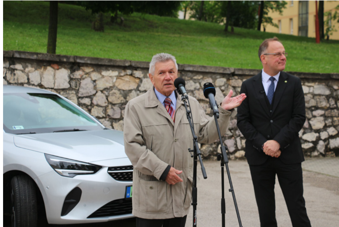
Az önkormányzat kiváló pályázatiírói nyertek az államtól az államnak fejlesztési forrásokat. Kétségtelenül a végső nyertesek az ellátottak lesznek. Schwartz Béla és Navracsics Tibor az átadó ünnepségen. Háttérben az új elektromos autó

A Terület- és Településfejlesztési Operatív Program Plusz pályázatán a városunk 200 millió vissza nem térítendő támogatást nyert, amelyből az önkormányzat egyrészt a Semmelweis utca 1. szám alatt lévő védőnői szolgálatnak helyt adó alapellátási intézmény korszerűsítését tervezi, más részét eszközbeszerzésre fordíthatják. Az önkormányzat tervei szerint az alapellátási intézmény, teljeskörű korszerűsítésen fog átesni.