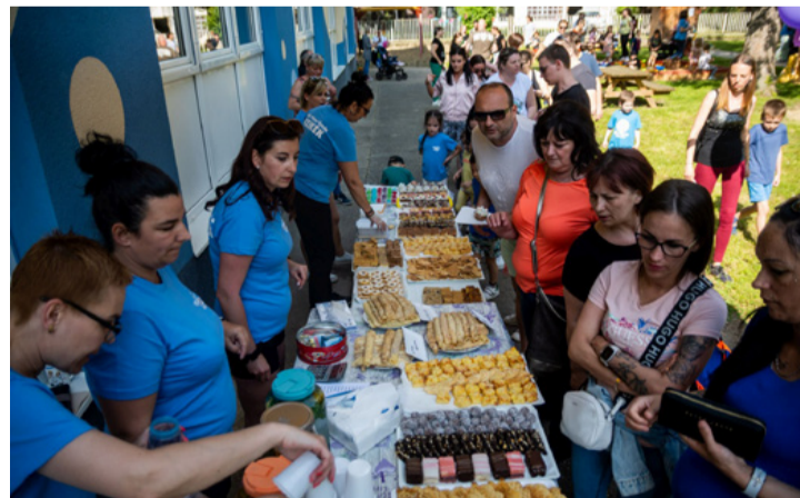
Finomságok a vendéglátó asztalon

Az Egészséges Életmódról Alapítvány óvodai fejlesztő játékok vásárlására és élményszerző kirándulásokra, tevékenysé-