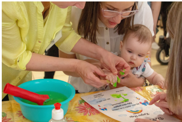
Az önkormányzat diplomával erősíti meg az újszülöttek ajkai kötődését

te, aki örömet fejezte ki, hogy ennyi gyermek született Ajkán. Viccesen megjegyezte, hogy a gyerekek első diplomájáért most még a szülők dolgoztak meg, de a későbbi diplomákért már a gyerekek fognak. Elmondta még, hogy ebben az évben 100 ezer forintot ad támogatásként az önkormányzat, amit hatvan napon belül fognak utalni mindenkinél. (Azon gyermekek jogosultak a 100 ezer forintos támogatásra, akik Ajkán, állandó lakcímmel rendelkeznek,