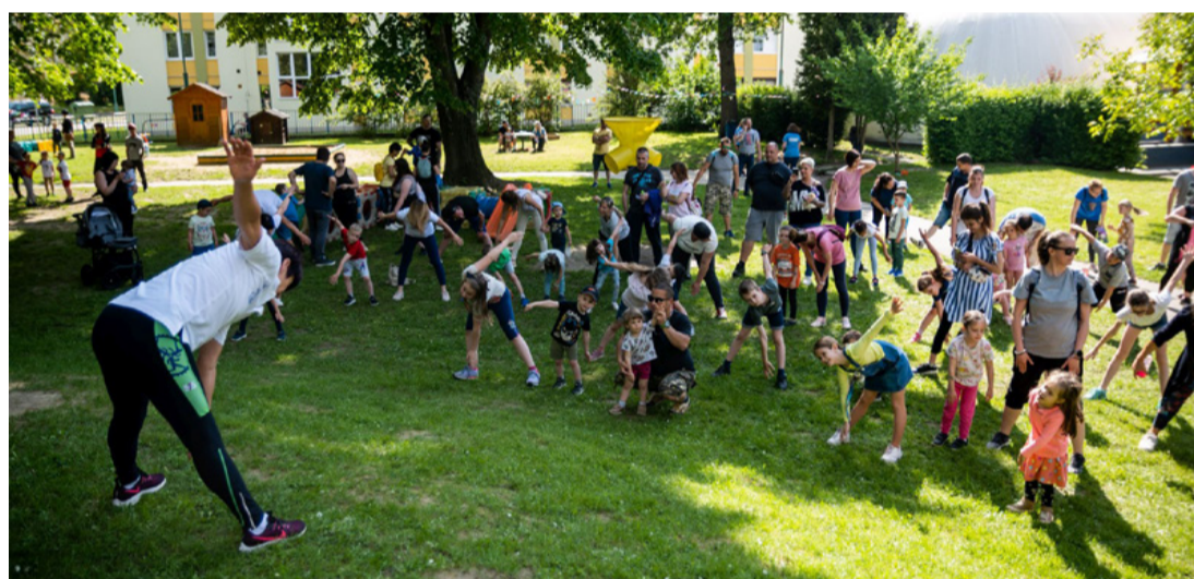
Bemelegítés az ovikörhöz