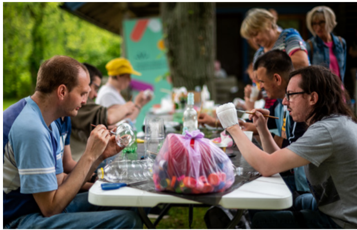
Készülnek a kreatív csodák a szelektív hulladékból