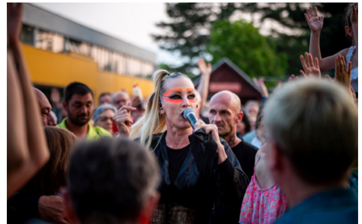
A sztárvendég vasárnap az Anna and the Barbies volt

■ Estébe nyúló kulturális programokkal, finom tócsival, lángossal és somlói borokkal várta az érdeklődőket Pünkösöd mindkét napján a XVIII. Borvarázs somlói bor-és tócsi fesztivál az Agórán és környékén.