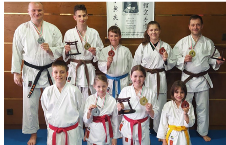
Az „érmes” egyesület

tökéletesítik tudásukat. Közülük 12 fő az, aki rendszeresen jár versenyekre, ami nagyobb fizikai és szellemi terhelést, megnövekedett edzésszámot jelent számukra. A versenyezés alaptól heti öt edzéssel jár, így eléggé elhivatottnak kell lennie ezeknek a gyerekeknek és szüleiknek egyaránt. Akik vállalják a versenyeken való megmérettetést, ők a sportot életformának tekintik. Céljaik vegyesek. Élvezik a küzdelmet és persze szeretnének nyerni. A tavaszi szezonban 9 versenyen indultak és hoztak el kiváló helyezéseket, de megjelennek más rendezvényeken, bemutatókon, sportnapokon is. Eredményeik közül a különböző világversenyeken, Európa bajnokságokon az eddig elért 37 aranyéremre a legbüszkébbek. A tavalyi év inkább a minőségi versenyekről szólt, 14 arany, 16 ezüst, 20 bronzéremmel büszkélkedhet a csapat. Akik nem járnak versenyekre, azoknak elsődleges célja az övvizsgák sikeres teljesítése. Mindenki szeretne fekete öves lenni, de ehhez rengeteg edzés, gyakorlás kell. A sikeres tavaszi szezon után a karatékákra nyáron különböző edzőtáborok, alap