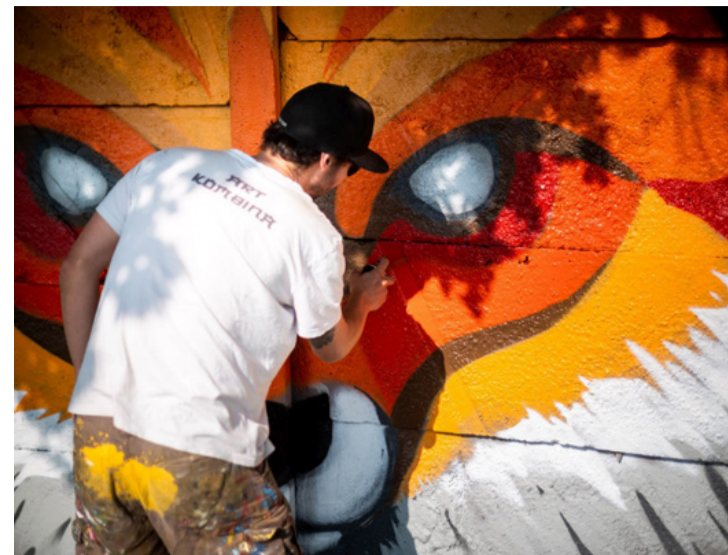
Smog az Ajkanesia harmincipsziloni darazsat festette meg

- Azonnal elkezdtem katonni az agyam, elkezdtem keresgélni a világhálón a megadott témákat - mesélte az alkotó. - Akkor döntöttem el, hogy a darazsat festem, amikor megtudtam, egy ajkai kötődésű zenekar, a 30Y a faj „névadója”. A darazsak amúgy is a kedvenceim, a ka-