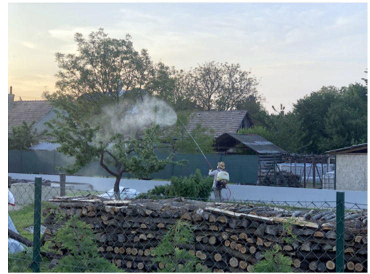
A motoros háti permetezőből kikerülő vegyszerek messzire szállhatnak a szél hátán

A növényvédőszer alkalmazása során felmerülő környezeti és egészségügyi kockázatok nem tekinthetők elhanyagolható problémáknak. Amikor a permetezés zajlik, előfordulhat, hogy a vegyszerek a kijelölt területen kívülre is eljutnak, különösen nagyobb légmozgás esetén.