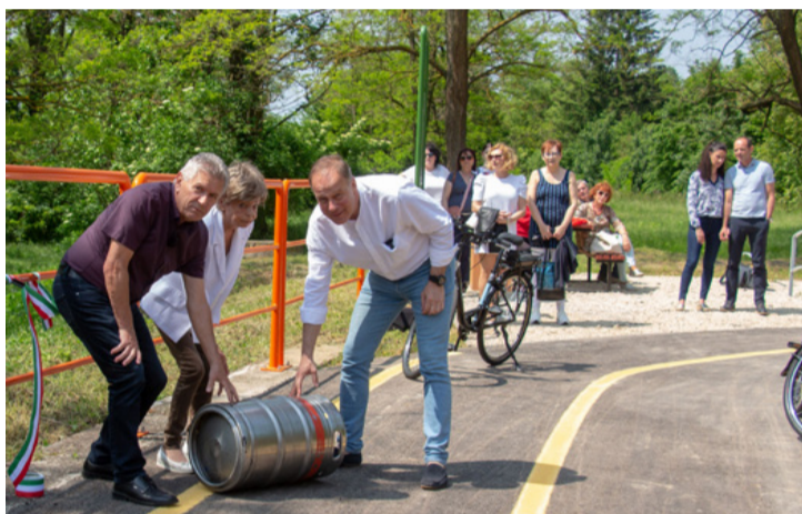
Újra gurult a hordó