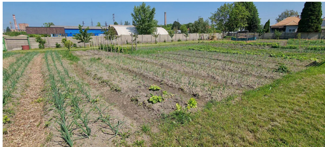
Bódén is tombol a tavasz