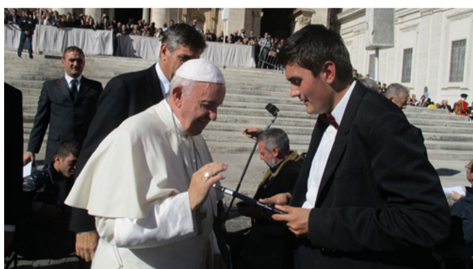
Vollein Ferenc átadja a Tündérország című kiadványát a Szentatyának 2016. október 12-én

A tárlat megtekinthető 2023. június 30-ig munkanapokon 9.00-17.00 óráig.