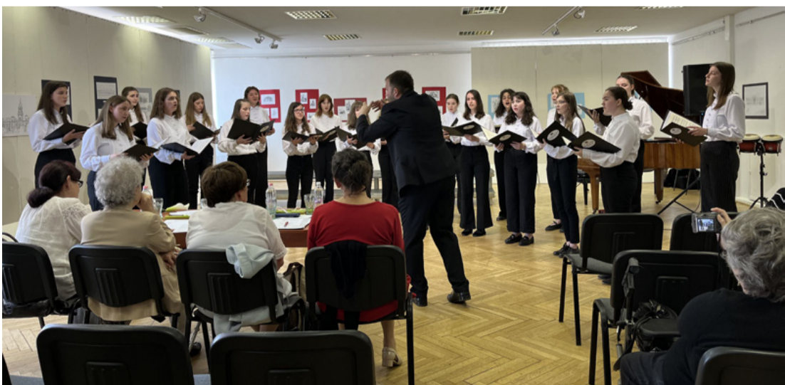
A pápai Parlando Leánykara a zsűri előtt