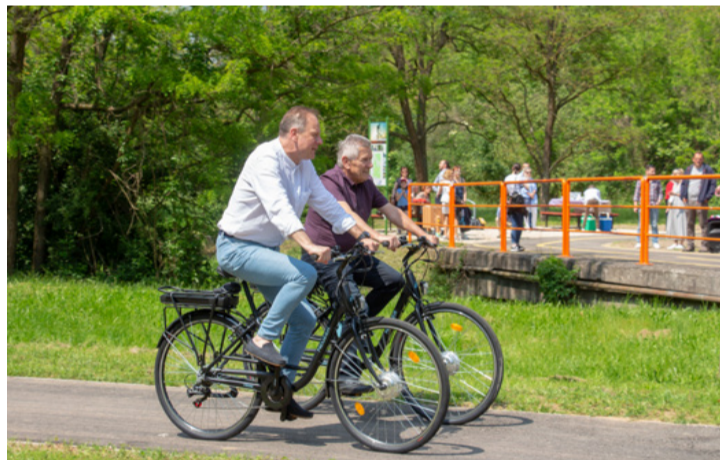
Fej-fej mellett: az első hivatalos száguldozók a frissen átadott bringaúton