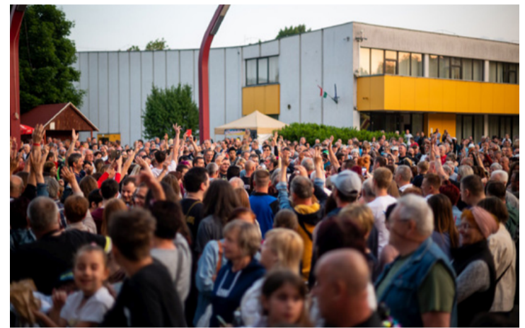
Megtelt az Agóra a fesztiválózó tömeggel

Mindkét napon a Bazalt és Plasztik elnevezésű, az Európa Kulturális Fővárosa program részeként meghirdetett kreatív foglalkozáson alkohtak az érdeklődők. Az Ajkai Képzőművészeti Egyesület szakmai közreműködésével