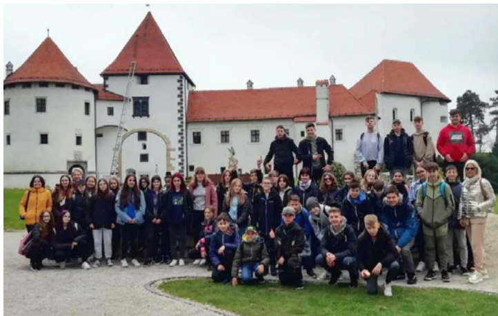
A hetedik osztályosok Varasdon

■ A közelmúltban a Fekete István-Vörösmarty Mihály Általános Iskola és Gimnázium 45 hetedik osztályos tanulója vehetett részt a Határtalanul program keretében magyar emlékek nyomába eredve egy öt napos utazáson Horvátországban.