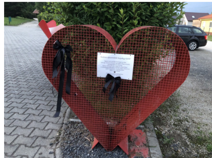
A „gyászoló” kupakgyűjtő szív

Júliustól a 100 százalékos Mol-tulajdonban lévő MOHU Mol Hulladékgazdálkodási Zrt. lesz a felelős a települések szilárdhulladék begyűjtéséért és kezeléséért, az általa megszerzett koncesszió alapján, 35 évig. Ez azt jelenti, hogy jövő hónaptól, már egy műanyag feldolgozó cég sem fogja átvenni az összegyűjtött PET-kupakokat. Ezzel az intézkedéssel évi több száz ezer forinttal esnek el azok az alapítványok és egyesületek, amelyek eddig kupakgyűjtésből egészítették ki a jótékonyági