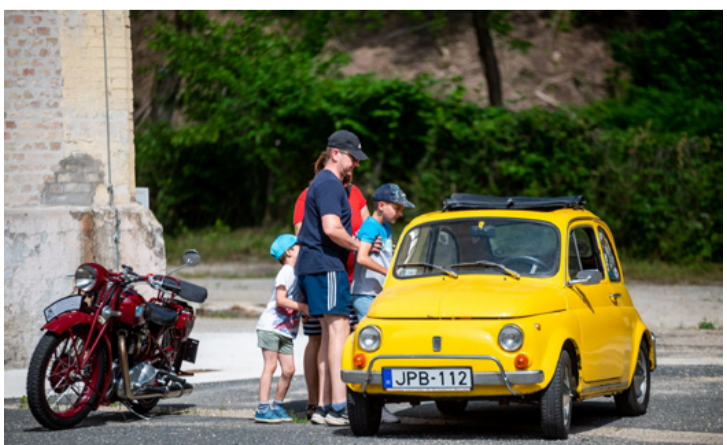
A régi járművek ma már Ajkán a közösségi rendezvények szinte állandó szereplői