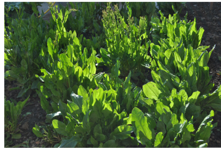
Sóskabokor a kert zugában

Minden sóska hosszú, vékony levelekkel rendelkezik, amelyek a közepén vágott levelhez hasonlóan két részre oszlanak. Ha nem vagyunk biztosak benne, hogy tényleg sóskát találtunk-e,