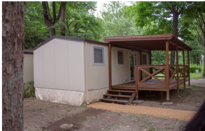
Egy új mobilház – kényelmes fészek a nyaralóknak