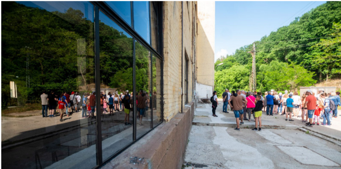
Sokan voltak kíváncsiak az új életre kelt Kriptongyár épületére