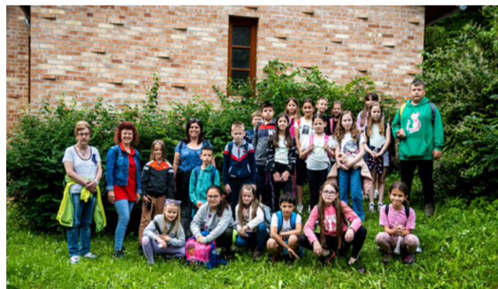
A kiránduló csoport a Bányászati Múzeum előtt

■ AJKACSINGER Érdeklődve hallgatták a bányászatról, a dinoszauruszokról, a kőzetekről szóló előadásokat az Ajkai Eötvös Loránd-Kossuth Lajos Általános Iskola 3/A osztályos diákjai, akik a Csingervölgyért Egyesület által minden évben Szent Borbála nap alkalmából kiírt, Bányászatról gyermekszemmel című alkotói pályázatra a legtöbb rajzot küldték be.