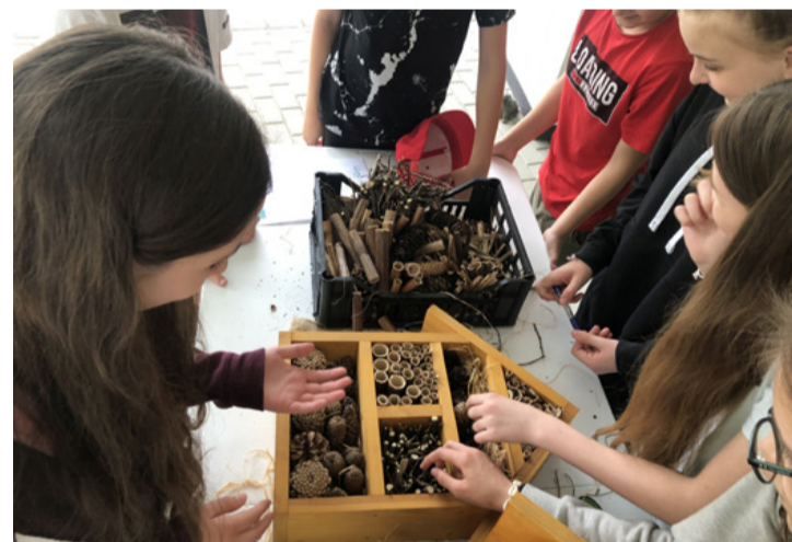
A diákok a fenntarthatóság titkait kutatták a kiállított anyagok segítségével

hallgatni lehetett az előadást, hanem gondolkodva, aktívan részt is vehettek benne. Játékos feladatok közben megtanulták sorrendbe rakni a hulladékgazdálkodás fázisait, megismerték, hogyan lehet