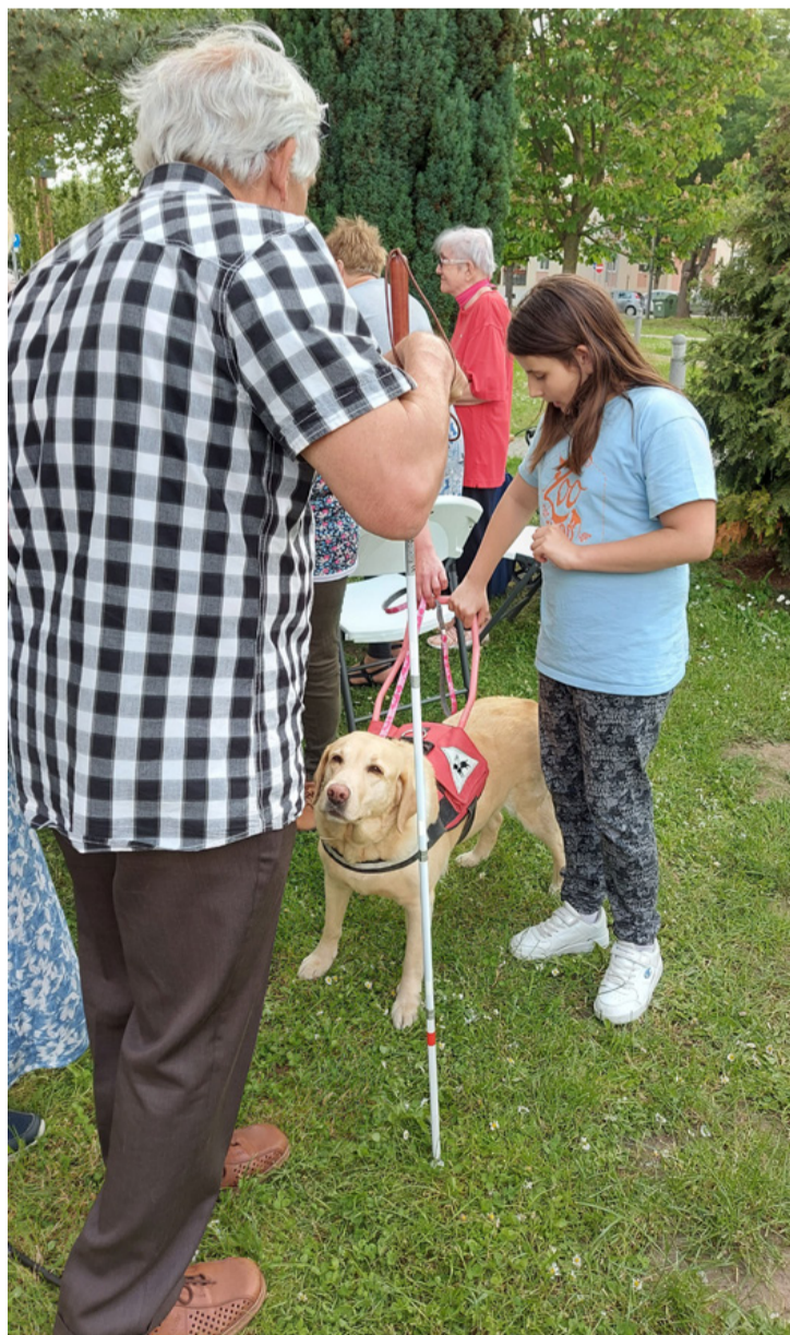
Ismerkedés a vakvezető kutyával

A foglalkozáson részt vevők személyesen megtapasztalhatták, hogy a látássérülteknek a hétköznapi életben milyen sok nehézséggel kell megküzdeniük.