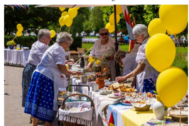
A hosszú asztalokon bőven jutott hely a hagyományos ételnek is

A Hosszúasztal Piknik a VEB2023 Európa Kulturális Fővárosa idei programsorozatán belül is, a kiemelt Felező (a VEB 2023 félidejéhez érkezett!) részeként rendezték meg június 18-án, vasárnap délután Veszprémben, a Séd patak partján, a Betekints-völgyben.