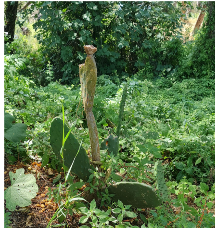
Ez a példány láthatóan jól érzi magát a szabadban