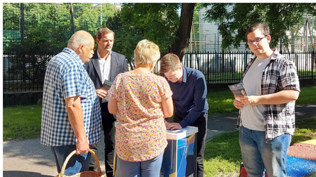
A Jobbik-Konzervatívok aláírásgyűjtői Ajkán