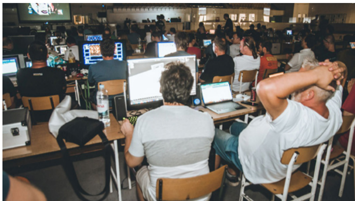
Egy kép a legutóbbi találkozóról