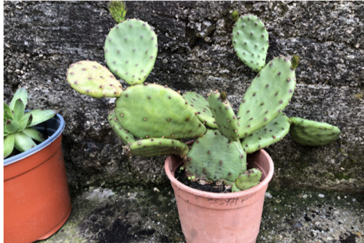
Nem kell rács mögött tartani, a cserép is megteszi

■ HÁZIKERT A kaktuszkok szépségük miatt sokakat vonzanak, könnyű tartásuk miatt sokan nevelik otthon cserépben őket. A száraz és sivár környezethez szokott növények, nem igényelnek állandó törődést. Azonban fontos tudni, hogy szabadba ültetve komoly problémákat okozhatnak a természetben. Könnyen inváziós fajokká válhatnak!