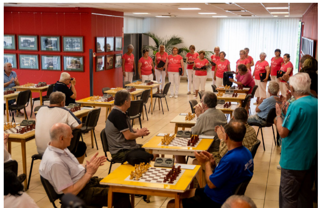
A verseny kezdete előtt a Jubilate Női Kar segítette a ráhangolódást