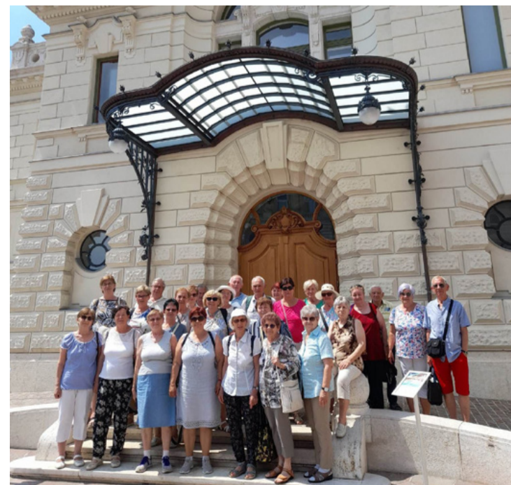
Az Egészségügyi Nyugdíjas Klub kiránduló tagjai a Várkert Bazárban