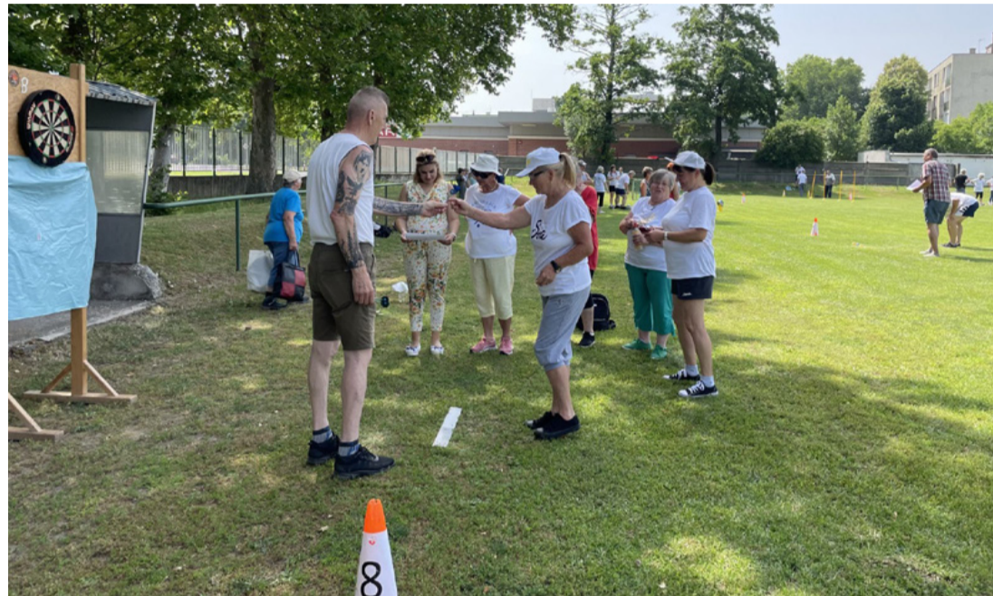
A darts nem kis kihívást jelentett a szépkorú hölgyeknek. És ez csak egy volt a tízből...

A rendezvényt jó hangulatú ebéd zárta a Sportváros Nonprofit Kft. jóvoltából.