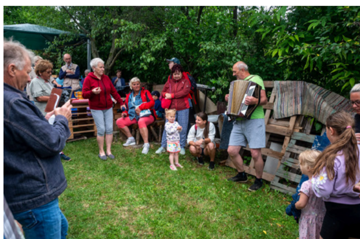
A hegybejárás sava-borsa a közös borozgatás, harmonikaszó mellett