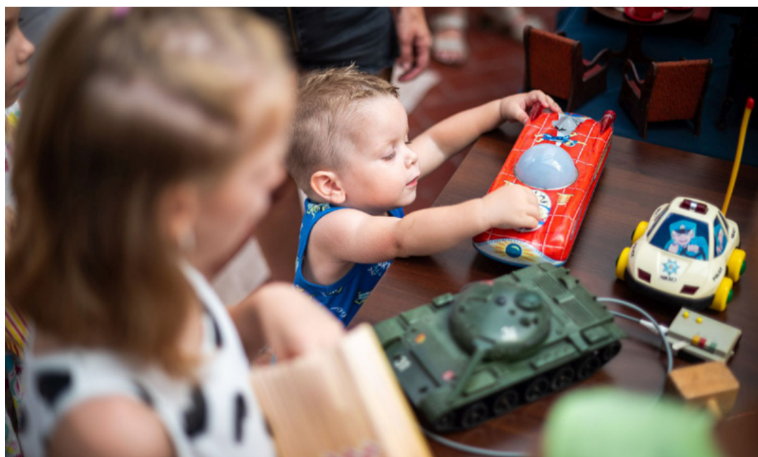
Ismerkedés a fémlemezekből sajtolt autókkal