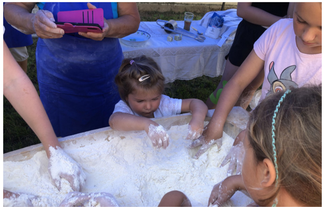
A legkisebbek is beszálltak a dagasztásba