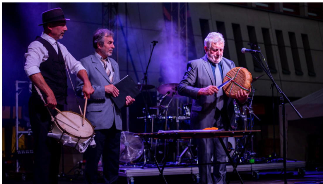
A kenyérszegés ünnepélyes pillanata