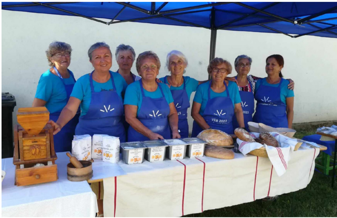
Hölgykoszorú a rendeki családi napon