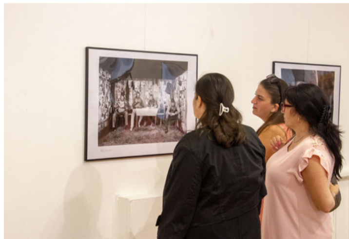
Érdeklődők egy Székelyföldön készült zsánerkép előtt