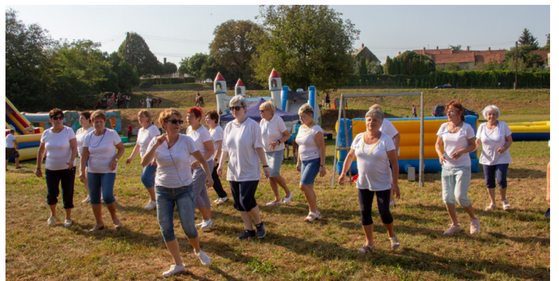
Nagy sikere volt a No(é) miccsoda Élménytánc Egyesület rendhagyó táncórájának