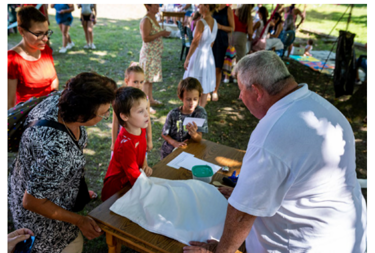
Egy a sok érdekes játék közül: na mi van a zsákban?