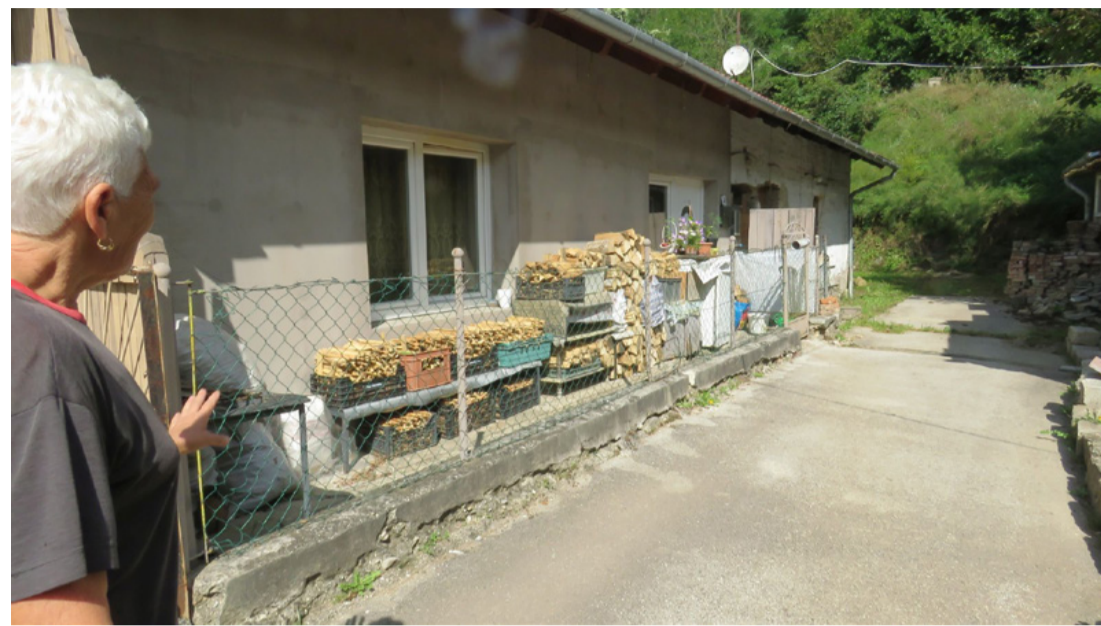
Készülni kell a zord télre. Lassan hegyekben áll a fa a házak mellett