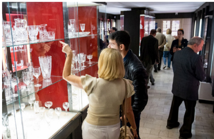
A megnyitó után a látogatók előzőlötték a múzeumot, ami egyelőre két teremben kínálja a csillogó látnivalókat