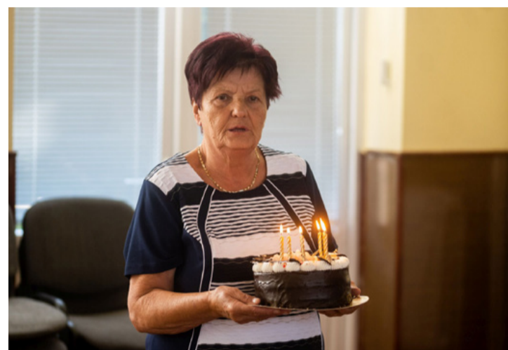
Minden szülinaposnak járt egy szál gyertya

- Én másként gondolom - mondta Dorner László . - Szükség van a nyugdíjasok tudására, élettapasztalatára, amelyet 70, 80, 85 év alatt sze-