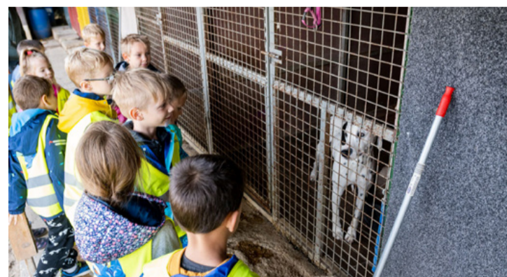
A rács két oldalán, de talán mégis egy oldalon