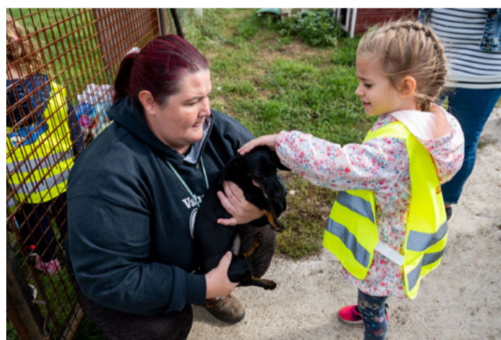
Ilyenkor átszakad egy gát, ami egy örök életre szóló barátság kezdete is lehet

Az állatoknak is szükségük van rendszeres, jó minőségű táplálékra, sétáltatásra, odafigyelésre, szeretetre, s ha megbetegszenek, orvosi ellátásra, gyógyszerre. Ezért fontos az, hogy mielőtt arról döntünk, hogy állatot viszünk otthonunkba, át kell gondolnunk, hogy tudjuk-e a megfelelő körülményeket biztosítani számára. A házi kedvenc hosszú távra szóló felelősséggel is jár.