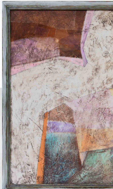
Szent Ottokár Freskótöredékek 2022

A tárlat megtekinthető november 10-ig munkanapokon 9.00-tól 17.00 óráig, szombaton 9.00-15.00 óráig.