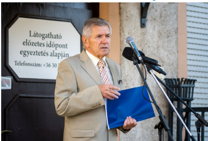
Kis lépés a polgármesternek, nagy lépés Ajkának