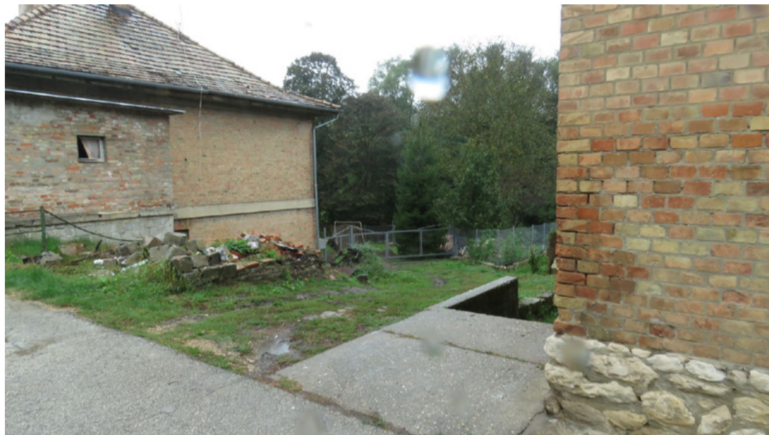
A két ház között állt egy harmadik is, csak pár éve leégett. Valakinek útban volt. A tulajdonosát csak néhány pofonnal lehetett megnyugtatni

zavarja, ha mások fagyoskodnak, miközben céljai felé tör – ahogy mondani szokás – „tökön paszulyon keresztül”. Szerinte a környékbeli hölgyek egész nap csak a padon üldögelnek és nem csinálnak semmit. Ahelyett, hogy belülről (?) szigetelnék az otthonukat. Különben ő tervezi a lakások helyreállítását, komfortosítását, de ki kell száradni a falaknak, ami időbe telik.