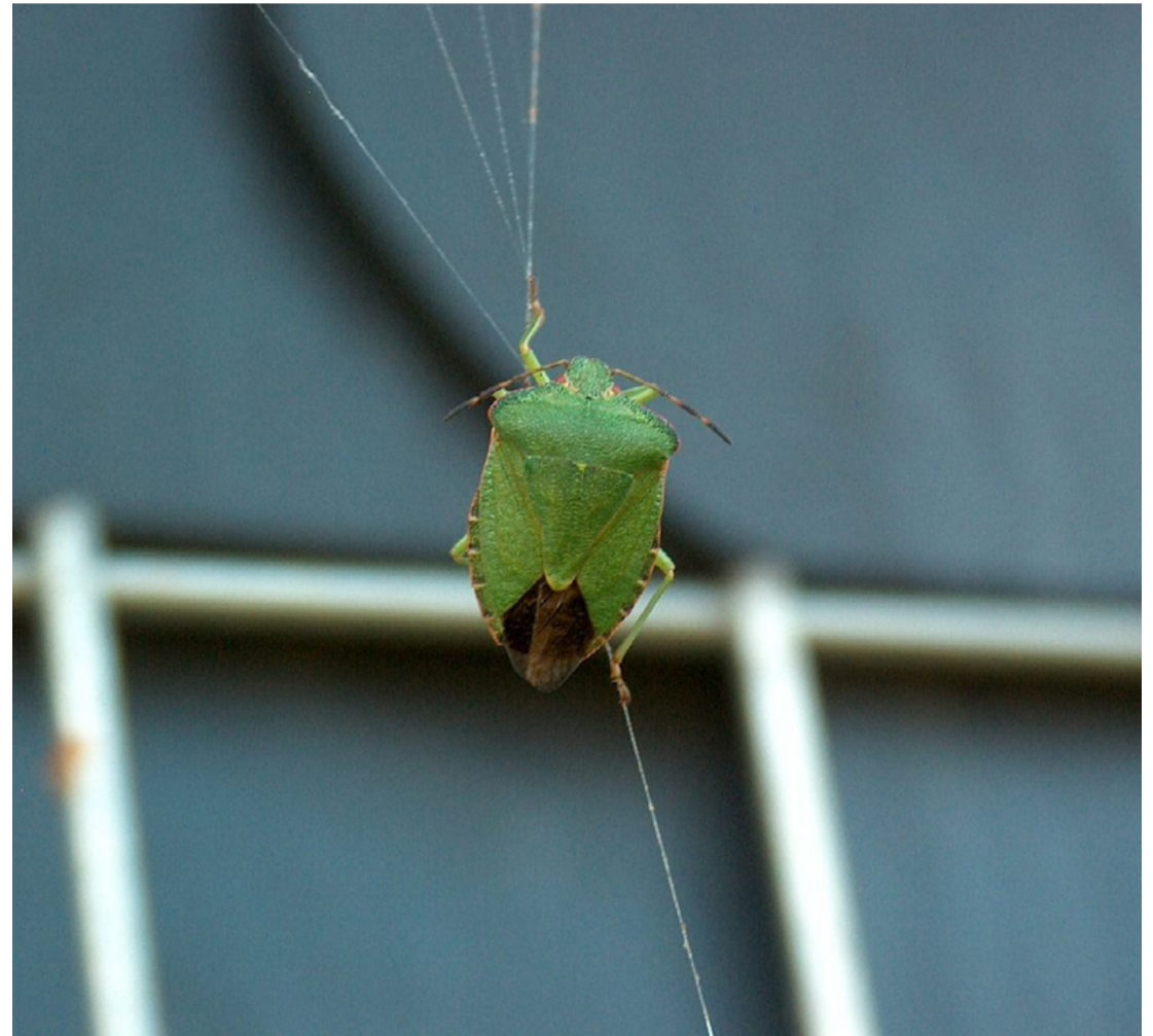
A képen egy zöld vándorpoloska látható. Ártalmatlan jószág, legjobb, ha kitessékeljük a lakásból