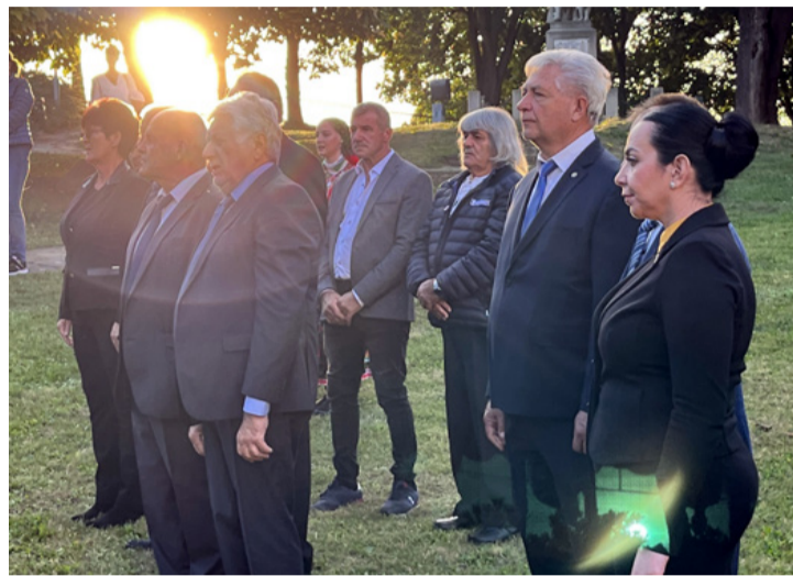
Megemlékezők a naplementében

A megemlékezésen az Ajka-Padragkút Táncegyüttes, a Zagyva banda és az Ajka Városi Bányász Fúvószkenekar működött közre. (ta) ■