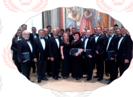
MÁV Férfikórus, Szolnok

- a Nemzeti Énekkar énekkari művésze, egykori kórustag