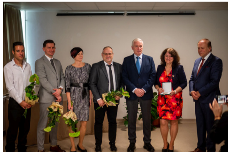
Ők is öregbítik a Magyar Imre Kórház hírnevét

doz magában. Az ápolók és az orvosok kiválóan teszik a dolgukat, amelyért elismerés illeti őket. A kórház egy óriássá nőtte ki magát, az egészségügy egyik oszlopa, amely