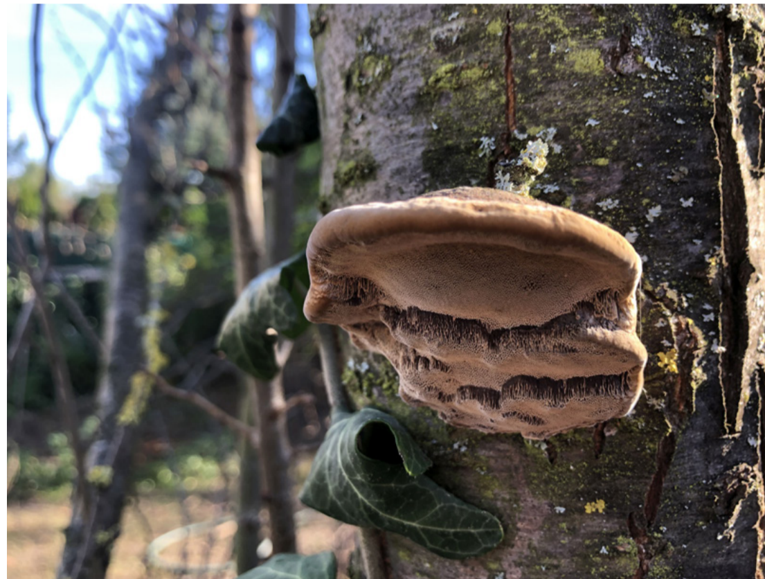
Jól kifejllett taplógomba egy rendeki szilvafán