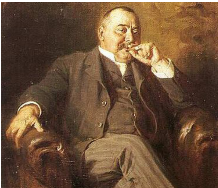
Képünkön a „nagy palóc” Benczúr Gyula festményén