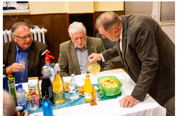
Megkóstolták a hegy levét is