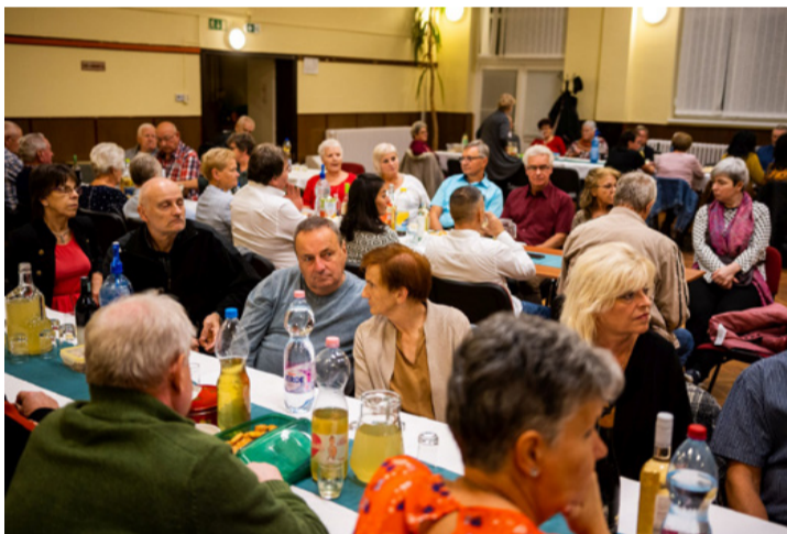
A csékútiak a hegyért, a hegy mindenkiért