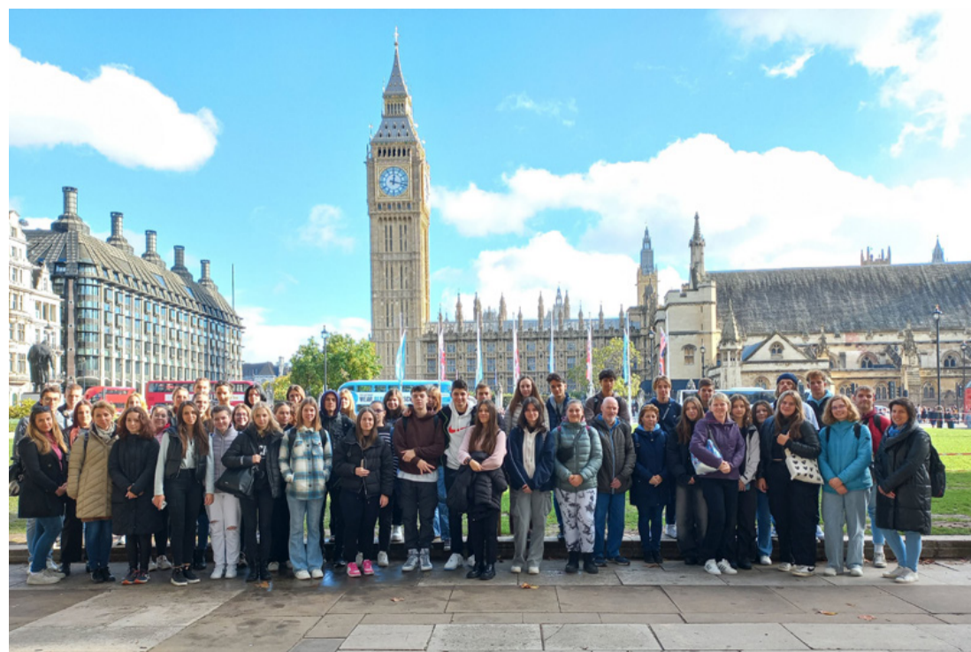
Ajkai diákok a londoni Parlament téren