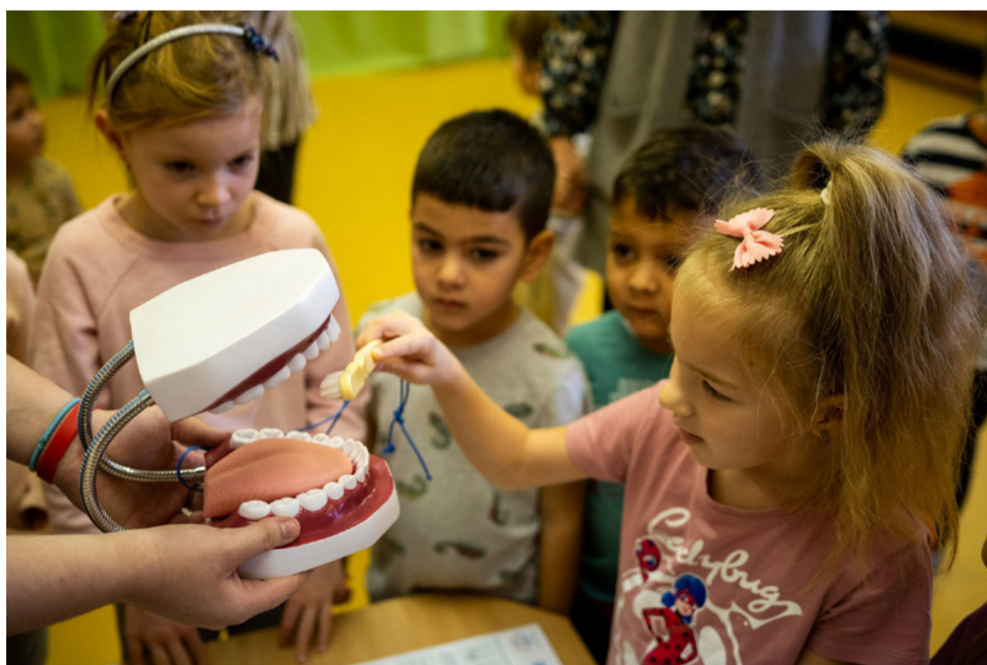
A helyes fogmosás gyakorlása egy óriásmaketten