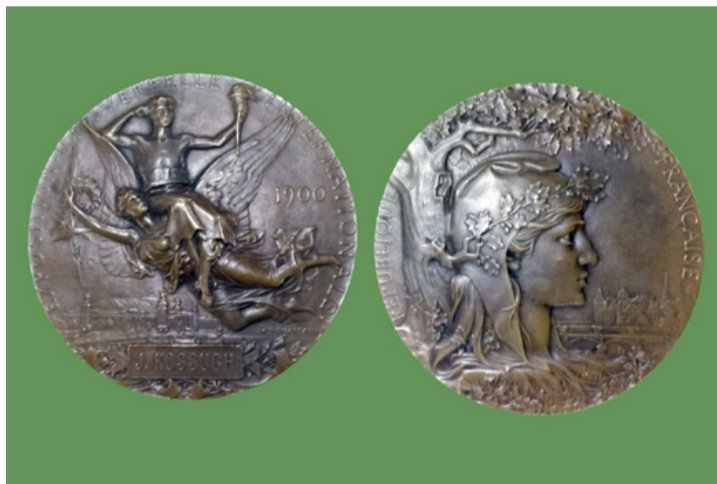
A világiállításon kapott érme két oldala