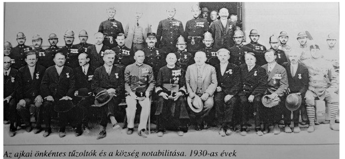
Az ajkai önkéntes tűzoltók és a község notabilitása. 1930-as évek

Egy kilencven éves archív fotó az elődökről