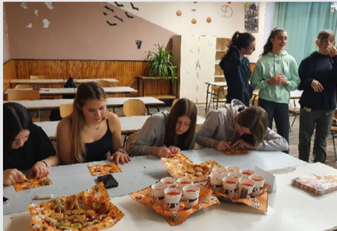
Készülnek a (nem is annyira) kísérteties sütemények

A 9. évfolyamos diákok egy csoportja angol nyelven finn eTwinning levelező partnerekkel, a németül tanuló diákok pedig német nyelven lengyel diákokkal váltanak leveleket. A nyelvtanulás ezen területe a rohanó technikai világba beleszületett új generáció számára különös jelentőséggel bír, hiszen számukra a papíralapú levélváltás már szinte ismeretlen fogalom. A tanulók így a külföldi kortársakkal foly-