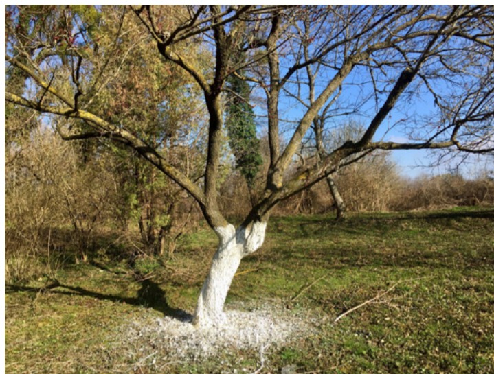
Mésszel kezelt fatörzs