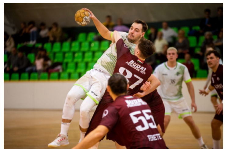
Éppen csak nem haraptak a Budai Farkasok

■ A kézilabda NB I/B 11. fordulójában a bakonyiak a Budai Farkasokat fogadták hazai pályán.