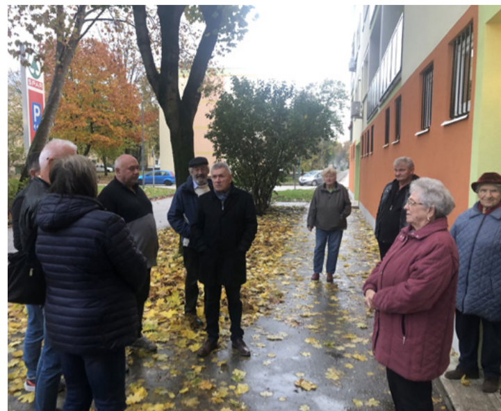
Komoly dolgokat vitattak meg a ház mellett

■ November második hetében adták át a panelprogram keretében felújított, Ifjúság utca 7. szám alatt található épülettömböt. Johanidesz Sándor körzetében már csak három panelház van, amely megújulásra vár. Schwartz Béla polgármester bejelentette, hogy aki lemaradt a panelprogramról, annak sem kell csüggednie, mert jövőre folytatódik, amire új pályázatot ír ki majd a városvezetés. Jó hír, hogy az önkormányzat által nyújtott támogatás összege 50 százalék marad.