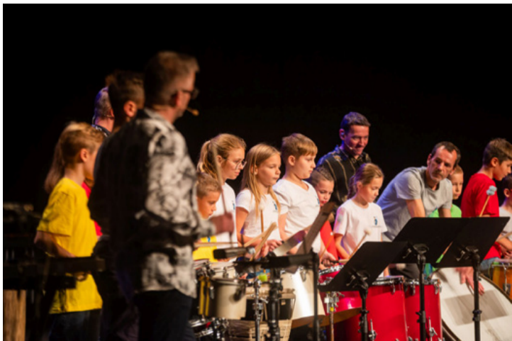
Együtt az ütős csapat