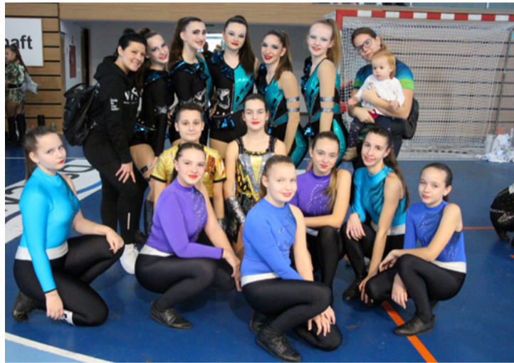
Dinamik Rock and Roll Klub