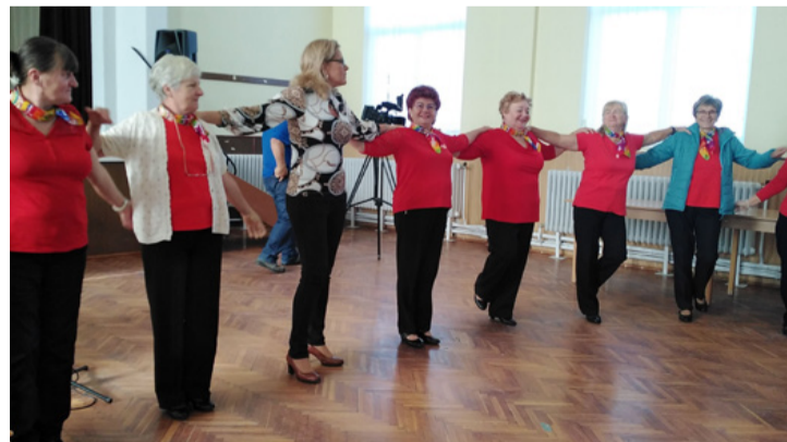
Együtt könnyebb – tornázni is

■ Gyaloglás, tánc és interaktív előadás az örömteli évekről. Sok nyugdíjas vett részt november 15-én a padragkúti művelődési házban, a Mozgással-Tudással az Aktív Időskorért Programban, amely az Aktív Magyarországiért Felelős Államtitkárság támogatásával valósult meg, a Nyugdíjas Klubok és Idősek „Életet az éveknek” Országos Szövetsége szervezésében. A rendezvény célja az aktív idősödéssel kapcsolatos szemlélet formálása, az életminőség javulása volt.