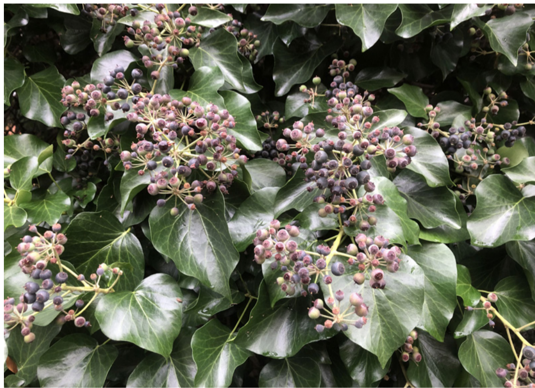
A borostyán látványa évszázadok óta gyönyörködteti az emberi szemeket