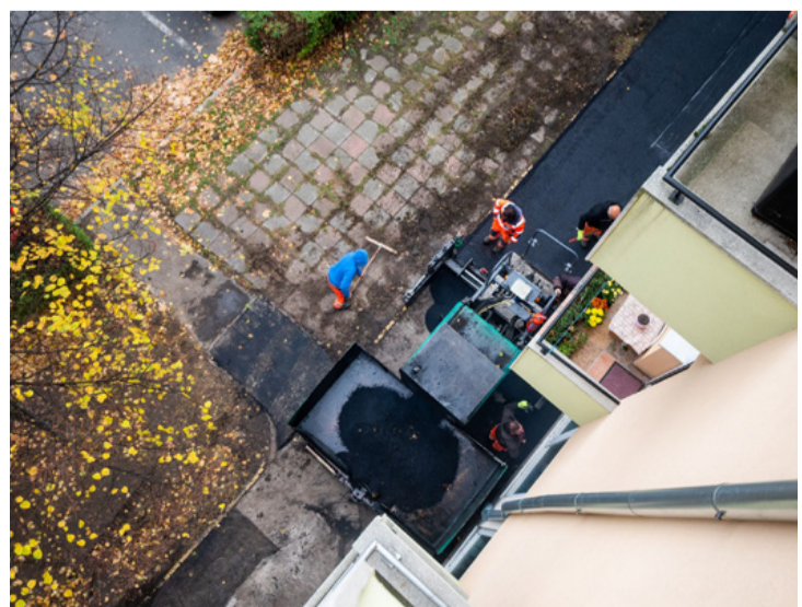
A munkálatok eredménye felülnézetből is jól látszik