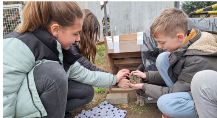
A kiscica gazdit és igazi otthonra keres, érdeklődni a Licit az ajkai cicák javára csoport közösségi oldalán lehet róla

Az idei tanévben állatbarát szakkör alakult, ahol egész éven át állatvédelmi projekteken vesznek részt a diákok. A program állandó résztvevője Éden a terápiás kutya, aki legutóbb macskákat népszerűsítő érzékenyítő foglalkozáson hangolta rá a gyerekeket a bársonyalpúakra. A „Láss bennem mást!”