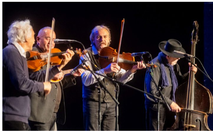
A mára már legendássá vált együttes

Az ifjúsági Filharmónia koncertek idei évadának első előadásán, a világszerte ismert Muzsikás együttes adott rendhagyó énekórának beillő koncertet városunk általános és középiskolás fiataljainak, a Nagy László Városi Művelődési Központ és Könyvtár színháztermében november 27-én.