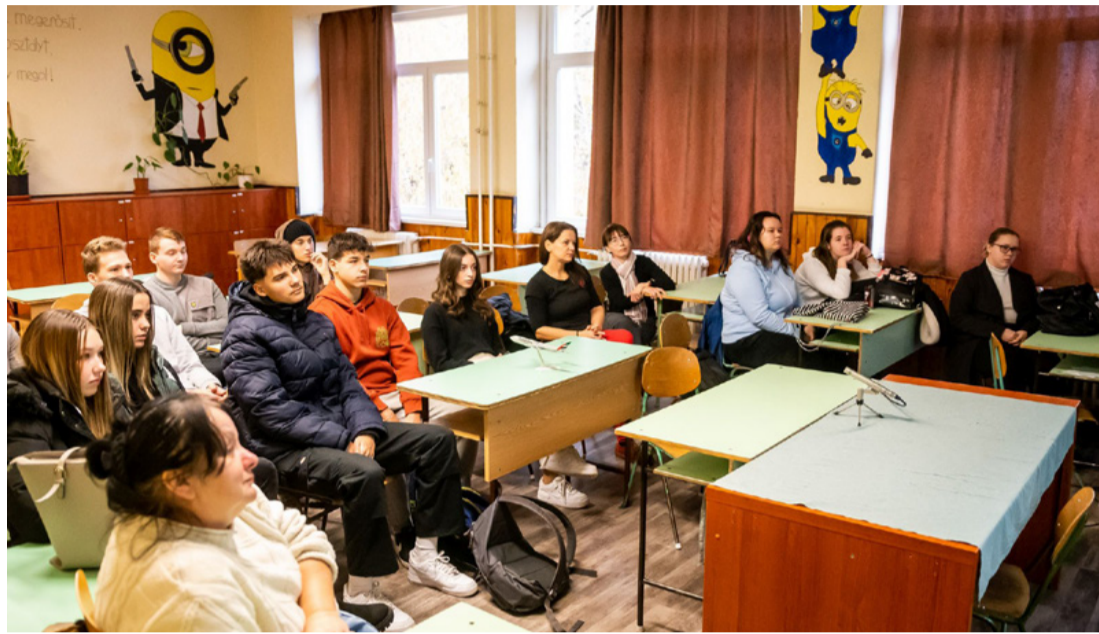
Diákok, életük nagy döntése előtt

■ Pályaorientációs nappal könnyíti meg a diákok pályaválasztását az Ajkai Gimnázium, Technikum, Szaképző Iskola, Sportiskola és Kollégium Bánki Donát Intézményegysége tantestülete. A mostani tanévben november 30-án két egyetem és 4 nagy foglalkoztató tájékoztatója mellett, igazi érdekesség is várta a nyelvi előkészítő osztályosokat.