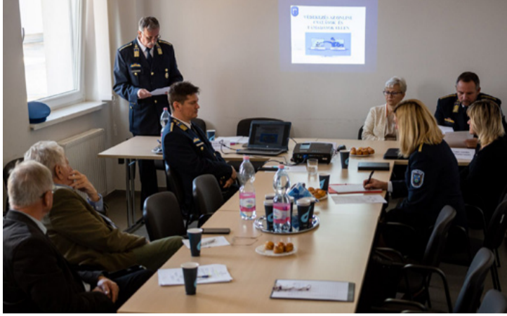
Az ajkai rendőrkapitány megnyugtató helyzetről számolt be