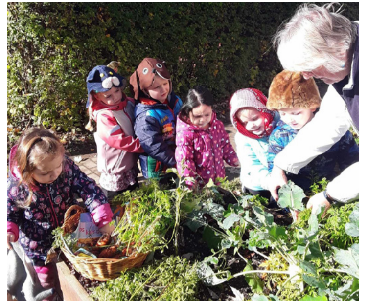
A kicsinyek megismerkedtek a kertben termesztendő zöldségekkel is

Vizuális tevékenységeinket segítette az új technika bemutatása, ami az ujjal való festés volt.