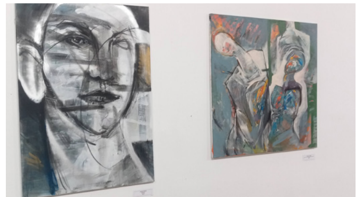
A kiállítás egy részlete