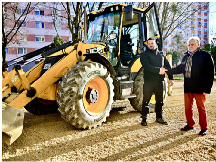
A munkálatok kezdetét kézfogással pecsételték meg