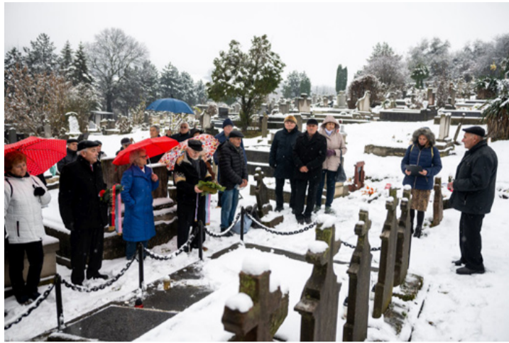
Egykori plébánosokra emlékeztek a bódéi bányász hagyományápolók az újtemetőben

A plébános, a hitben való megerősödésen túl, a dolgozók helyzetének javítására, a nép életkörülményeire is figyelmet fordított. Szót emelt azért, hogy a felsőtagozatos diákok tanulhassanak a közeli iskolában, ahová addig jár-