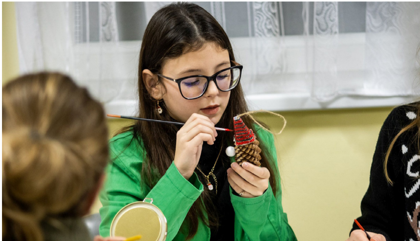
A karácsonyi díszek készítésének két fontos „kelléke” a szeretet és a kézügyesség