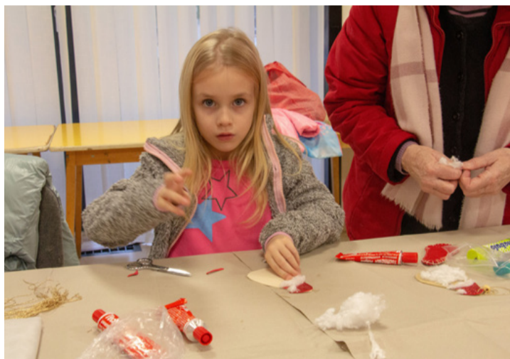
Mikulás legyen a szánján, aki ellent tud állni egy ilyen tisztta tekintetnek

Az élmények azonban nem merültek ki a Mikulással való találkozással, hiszen számos kísérőprogram is várta őket. A polgármesteri hivatal előtt, a Mikulás-vonat egy városnéző utazásra invitálta az érdeklődőket, míg a VMK-ban kézművesfoglalkozáson lehetett részt venni. Őt asztalnál szebbnél szebb karácsonyfadíszek és dekorációk készültek és még egy úgynevezett Ramazuri játéktér is várta a gyerekeket szórakoztató és oktató játékokkal.