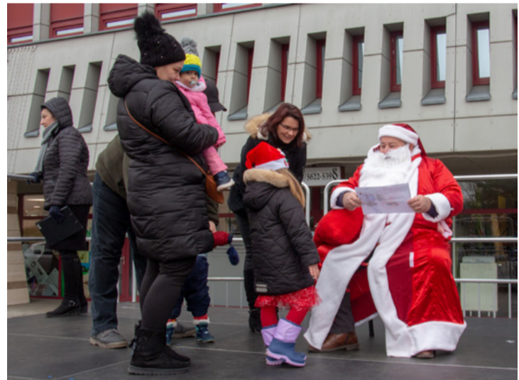
...és jó gyerek voltál az idén?