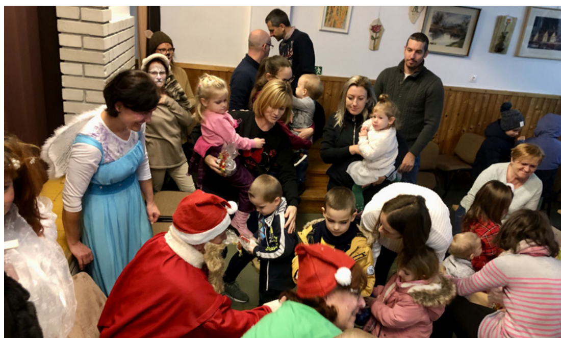
Kicsi és nagy együtt örült a Mikulásnak