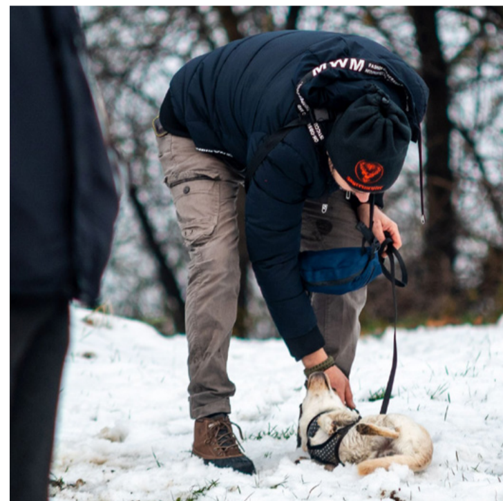
A szeretetnél sem a méret a lényeg

Nevükön szólította a kutyákat a látogatók többsége a Vahur kutyakarácsonyon, amelyet a Vahur Állatvédő Egyesület tagjai tartottak december 10-én kora délután.