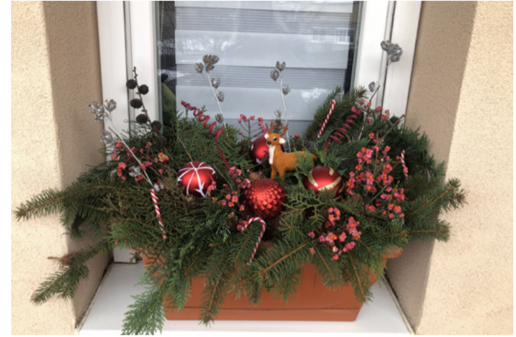
Egy téli ablakdísz Ajkarendekről

Ha van a családban kisgyerek akkor a díszkészítést vele együtt is megoldhatjuk. A rénszarvas és a hóember mindig kedvelt téli dísz a gyerekek körében. Ezeket filcből, textilből vagy tobozból is elkészíthetjük velük. Nem kell bonyolult mintát követni, a