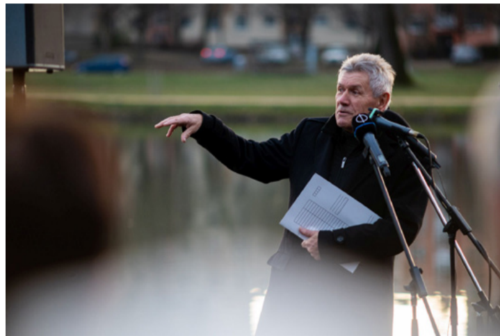
A polgármester a közeli jövő Ajkájának új vízióját vázolta fel az „Ajka élhető város” projekt meghirdetése alkalmával

Visszatekintve kissé: többek között az ajkai beruházásoknak is köszönhető, hogy a 2014-2020-as gazdasági ciklusban Magyarország a harmadik lett az uniós támogatások lehívásában.