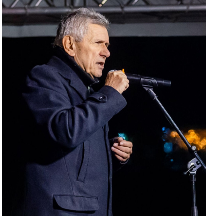
Boldog új évet Ajka!