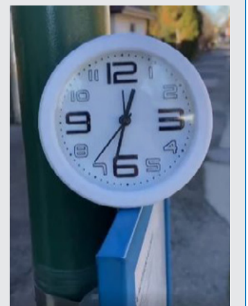
Az MKKP helytakarékos órája az ajkai buszpályaudvaron