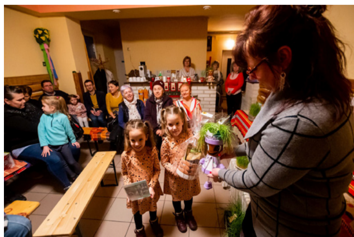
Az ovisokat is bevonták a szépségversenybe

Az eredeti ötlet, a természetgyógyászzal, az egészségtudatossággal régóta fog-