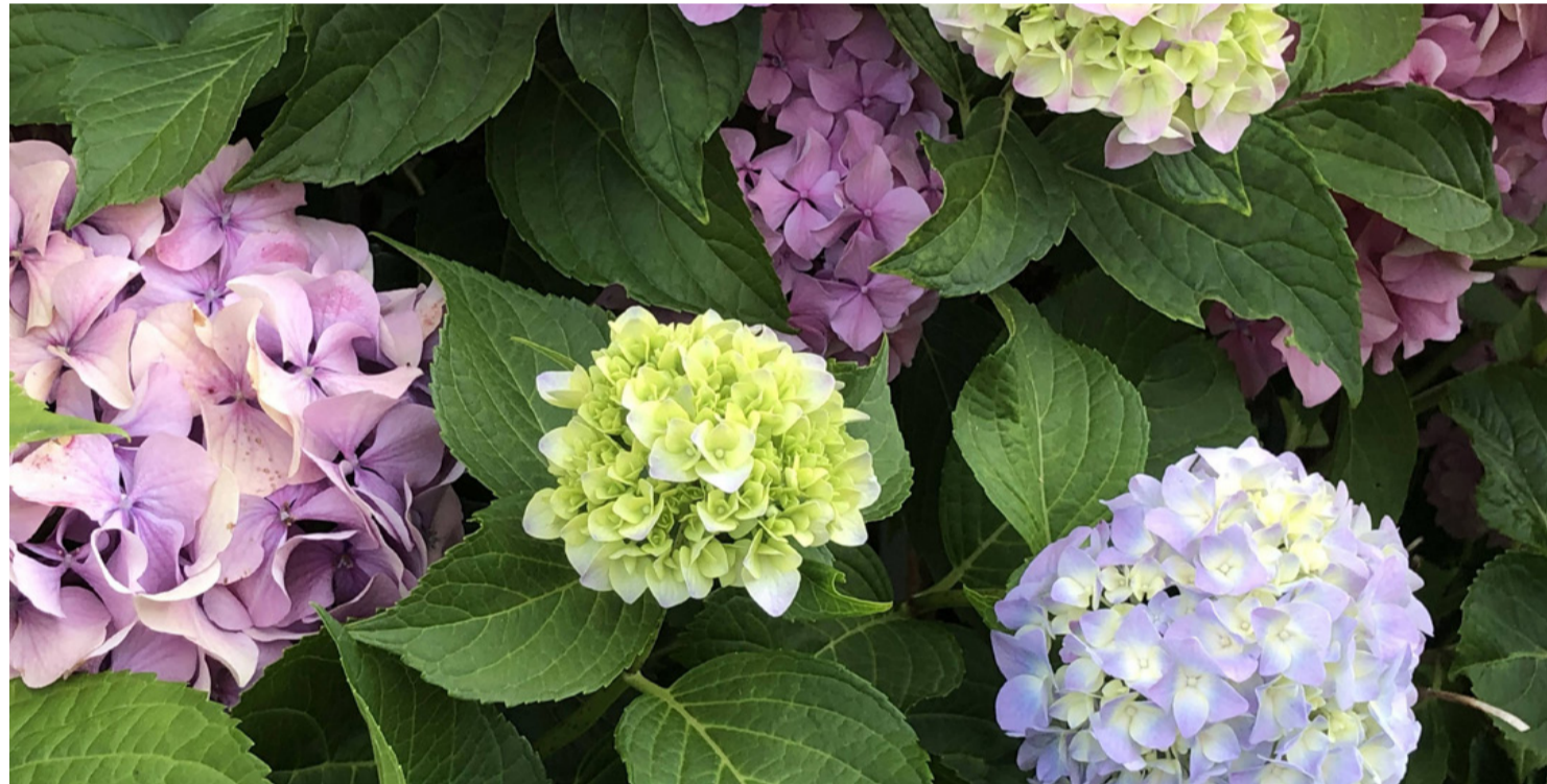
A színváltoztató növény kertünk egyik legszebb díszje lehet. Mondhatnánk, karácsonyfánk „lelke” is tovább élhet benne