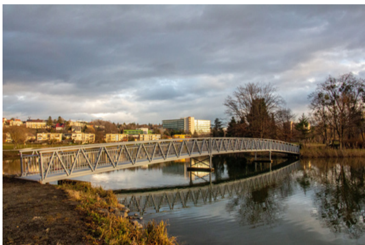
Nemzedékeket szolgál majd a szigetre vezető új acélhíd

■ Két év kitértő és intenzív munkájának eredményeként, január 4-én ünnepélyesen átadták a Csónakázó-tó felett átívelő hidat a Városligetben. A projekt megvalósításához jelentős támogatás érkezett a kormánytól, ami ismét rációfól a Fidesz azon kampány állítására, ami szerint csak akkor lehet sikeres egy önkormányzat, ha annak kormánypárti vezetése van. A három elemből álló masszív acélhíd építése összesen 56 millió forintba került, melynek kivitelezését a BNDL Kft. végezte. Az átadáson jelen volt Navracsics Tibor, közigazgatási és területfejlesztési miniszter, Schwartz Béla polgármester, valamint Lévai Ferenc, a tó rehabilitációját végző Aranypony Zrt. vezérigazgatója.