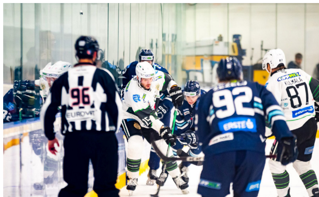
A mérkõzésen nem voltak ritkák a kemény összecsapások