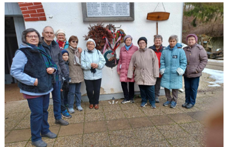
A csapat tagjai a Bányászati Múzeumban