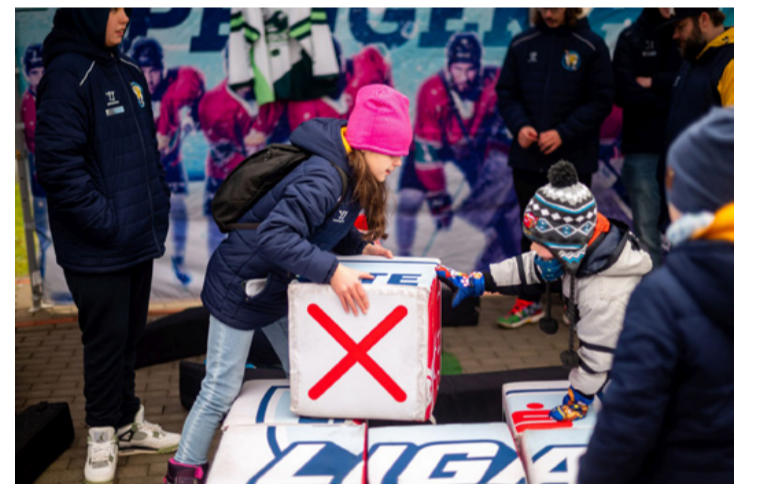
A jégcsarnok elõtt a kocka-játék is sok érdeklõdõt vonzott

A mérkõzés kezdõ dobását a 8 esztendõs ajkai kislány, Zombok László végezte, aki szereti a sportágot, de üveg-