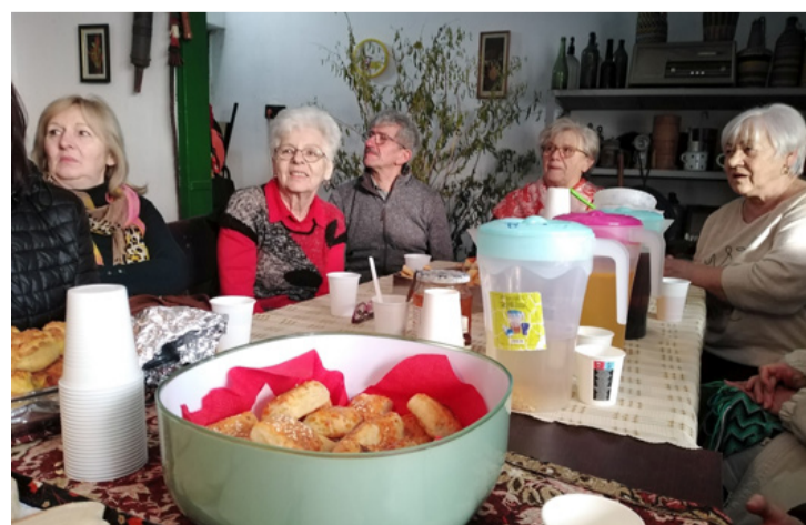
Az évzáró rendezvényen résztvevők egy csoportja