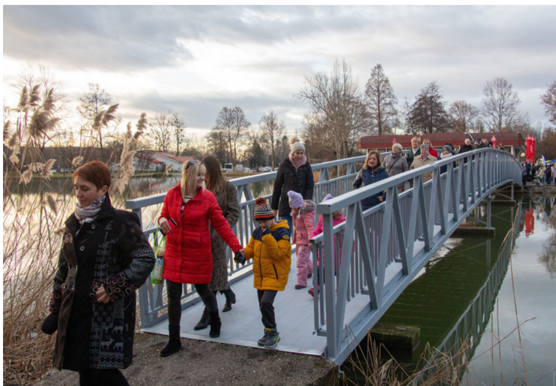
Az ünnepség után az ajkaiak szinte azonnal elözönlítették a hidat és a szigetet