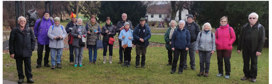
„Bejgliégetők” a Hild parkban, a túra indulása előtt