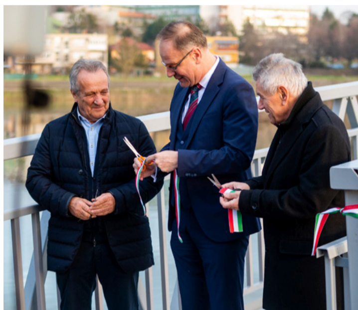
A szalagátvágást követő felszabadult egyeztetés: kinek a leghosszabb?

ahhoz is, hogy munkagépekkel be tudjanak menni rajta a szigetet karbantartani. Az ünnepélyes átadáson Navracsics Tibor immáron hagyományosan ismert el, hogy a városvezetés kiváló munkát végez, jó kezekben van a város kulcsa. Elmondta, hogy két évvel ezelőtt ígéretet tett az ajkai lakosoknak, hogy amennyiben ő lesz a térség országgyűlési képviselője, akkor ő mindent meg fog tenni