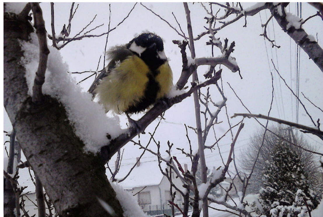
A szénincse szemlátomást a melegebb időt várja