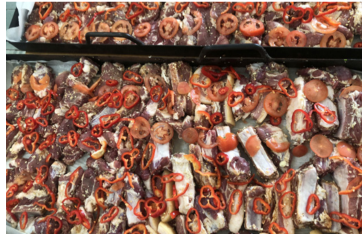
Az eredmény megéri a fáradságot