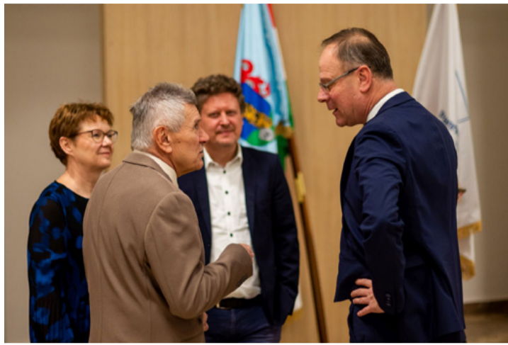
A polgármester és a miniszter külön megbeszélést is folytatott a jövőbeni tervekről

A városfejlesztés témakörében megemlítette a 4000 „rendes” és 1000 tárolóparkolót, melyet a jelenlegi városvezetés épített az elmúlt két évtizedben. Ezzel ugyan mérséklődött a parkolási infrastruktúrára nehezedő terhelés, de szem előtt kell tartani, hogy 15 ezer gépjármű van a városban, és ez csak egyre több lesz. Távlati városfejlesztési koncepcióként