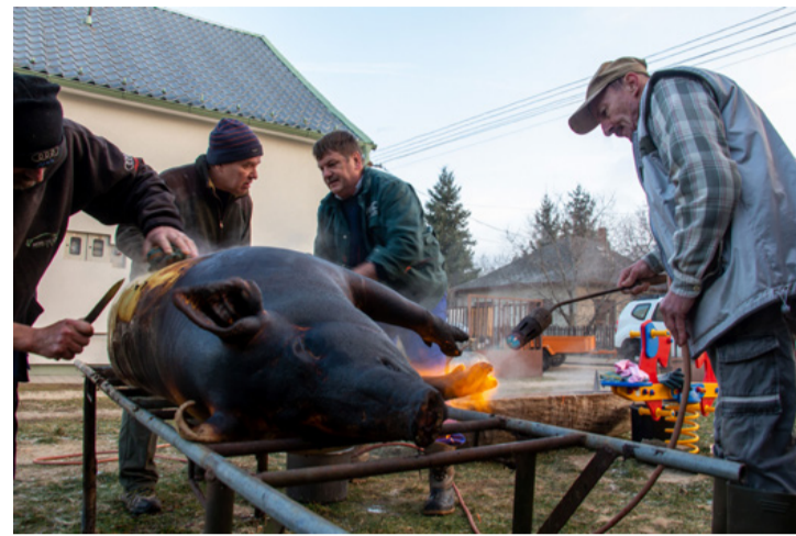
Készül a pálinkás pohár

Az egésznapos disznó vágáson nem csak az egyesület tagjai, hanem a helyiek is bekapcsolódhattak az egyes munkafolyamatokba. Mindenki vidáman dolgozott, bátorítva egymást, és az ügyetlenkedőket is segítették. Rai-