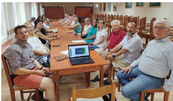
A kemény magban ismerős és új arcok is megjelentek

A MÚOSZ Sajtószabadság 2024 című pályázatához kapcsolódóan az Ajkai Szó is karikatúrapályázatot hirdet a lap (és online változata) olvasóinak.