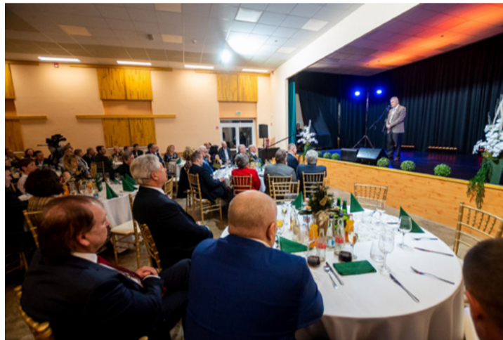
Schwartz Béla polgármester éwertékelőjét tartja az Ajka Kampuszon. Előtérben a Fidesz asztala

nagyobb cége továbbra is az EcoFamily üzletlánc mögött álló Napcsillag Kft., mely 128 százalékos teljesítményt nyújtott tavaly, az előző évekhez képest. Mellette kiemelendő a Bakonyi Erőmű termelékenysége, amely az energiaválság ideje alatt kimagasló nyereséget tudott termelni. Számos vállalat számottevő erőforrásokat fordít beruházásokra, fejlesztésekre, aktuális példa a Poppe & Potthoff, amely egy nagyberuházásnak köszönhetően hidrogéncellás gépjárművekhez fog alkatrészeket gyártani.