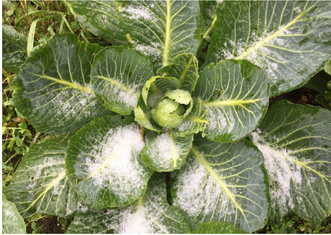
Telelő káposzta. A hótól nem kell félni a növényeket