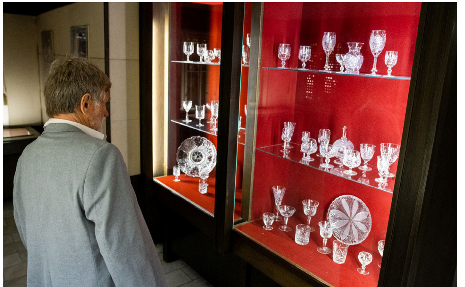
A Kristálmúzeum újra nyitása a város egyik új kulturális központjának alapját vetette meg