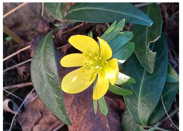
A Téltemető februári virágzása jelzi, hogy hamarosan megérkezik a tavasz! Ez a bakonyi tölgyesekben is telepeket alkotó, védett kis virág 8-15 cm magasra emeli ragyogó sárga fejcskéjét a zöld levelek fölé. (Sz.Cs.)