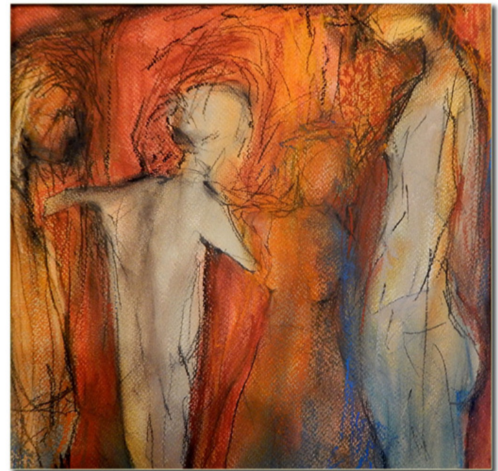
Bodnár Imre: Broken Angel