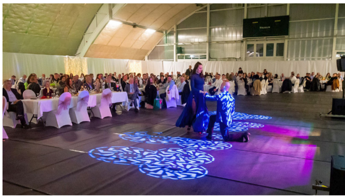
Báli hangulat a sportcsarnokban