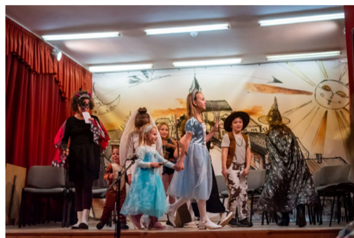
A jó hangulathoz a kicsik is hozzájárultak produkciójukkal

■ A generációk egymásra találása jegyében telt a hagyományos nyugdíjas farsang a bakonygyepesi közösségi házban, a farsang utolsó szombatján. A nagy színháztermet ismét megtöltötték a vidám szépkorúak, és a szereplést vállaló gyermekek.