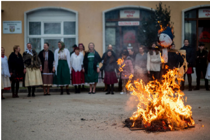
A kiszebáb égetés biztos jele a tél végének