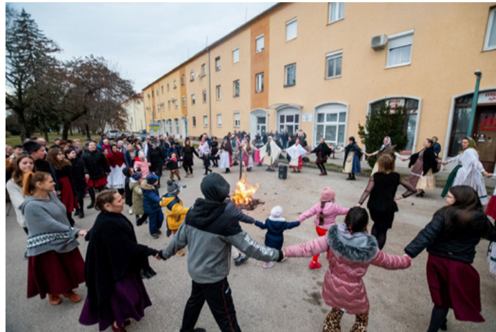
Hamisítatlan belvárosi népünnepély volt