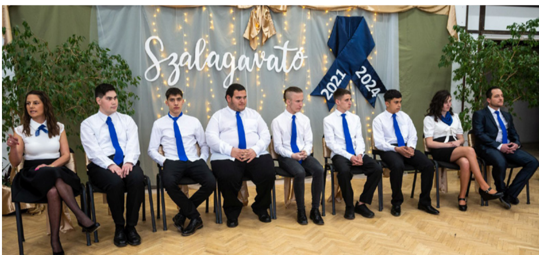
A végzősök kék nyakkendőben