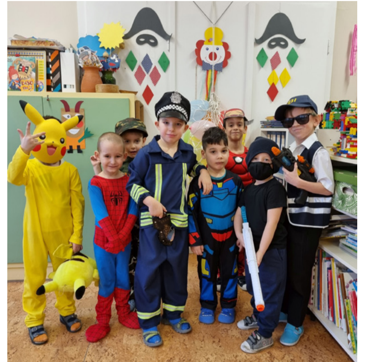
A farsangi multság alaposan megmozgatta a gyermekek és szüleik fantáziáját

Végre elérkezett a nagy nap , a multság napja. Mókázatok, táncoltak versengtek a gyermekek egyénileg és a kis barátaikkal közösen is kipróbálhatták magukat a vicces