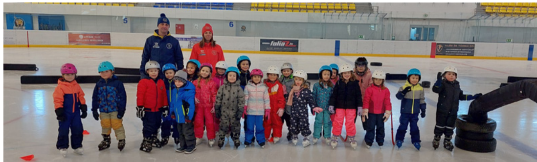
A Hétszínvirág a jégen