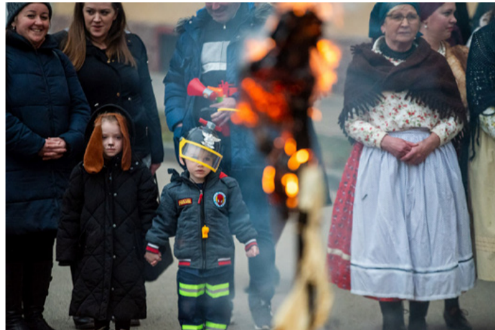
A hosszú készülődés meghozta gyümölcsét