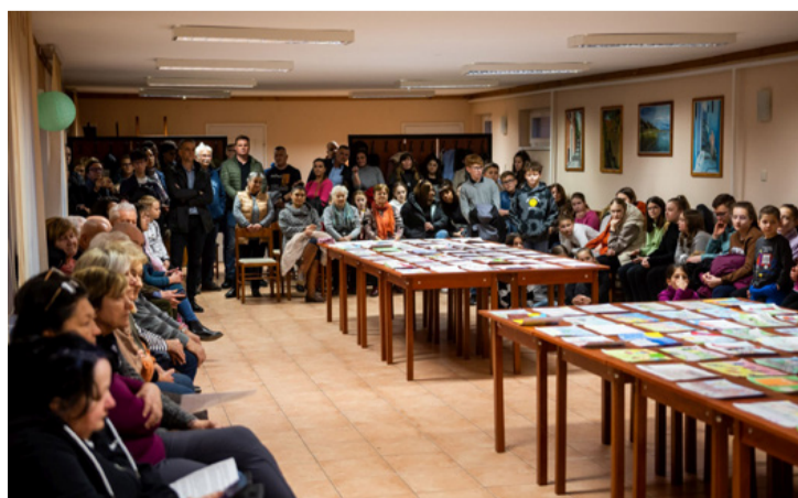
Pályaművek, pályázók és érdeklődők a közösségi házban Tóskberénden