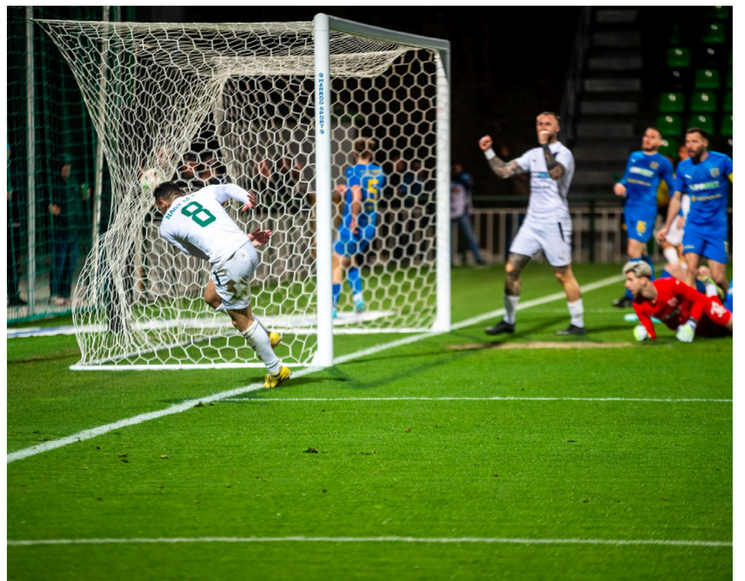
A mérkőzés egyetlen góljának az ajkaiak örülhettek