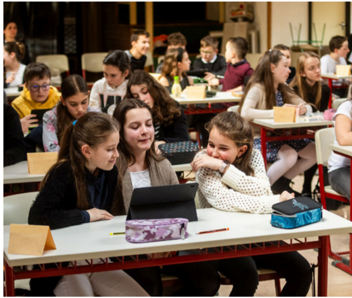
Nagyon jó hangulatú versengés folyt