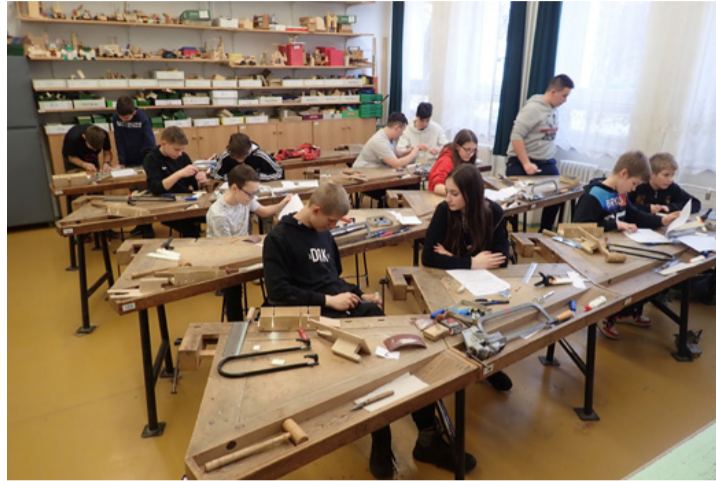
Munkában a csapatok