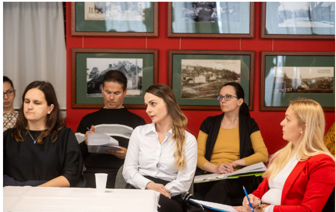
A jelzőrendszeri tagok komoly, felelősségteljes munkát végeznek