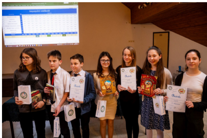
Mindenki nyert valamit...