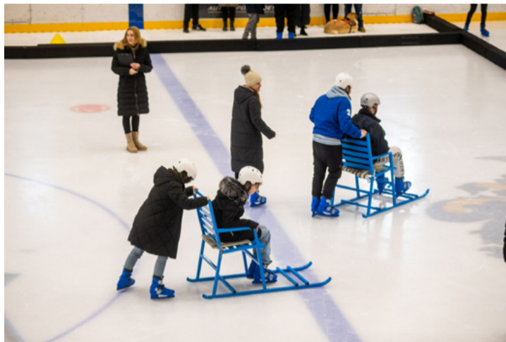
Nagy sikere volt a fakutyának