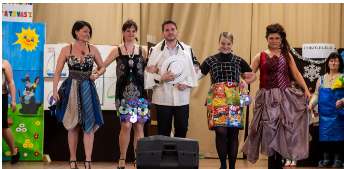
„Divatdiktátorok” a művelődési ház színpadán