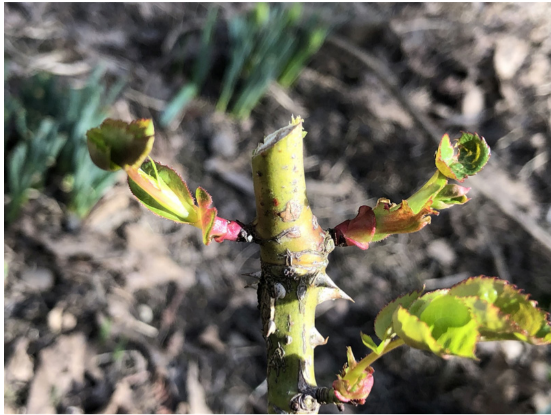
Helyesen metszett rózságaak