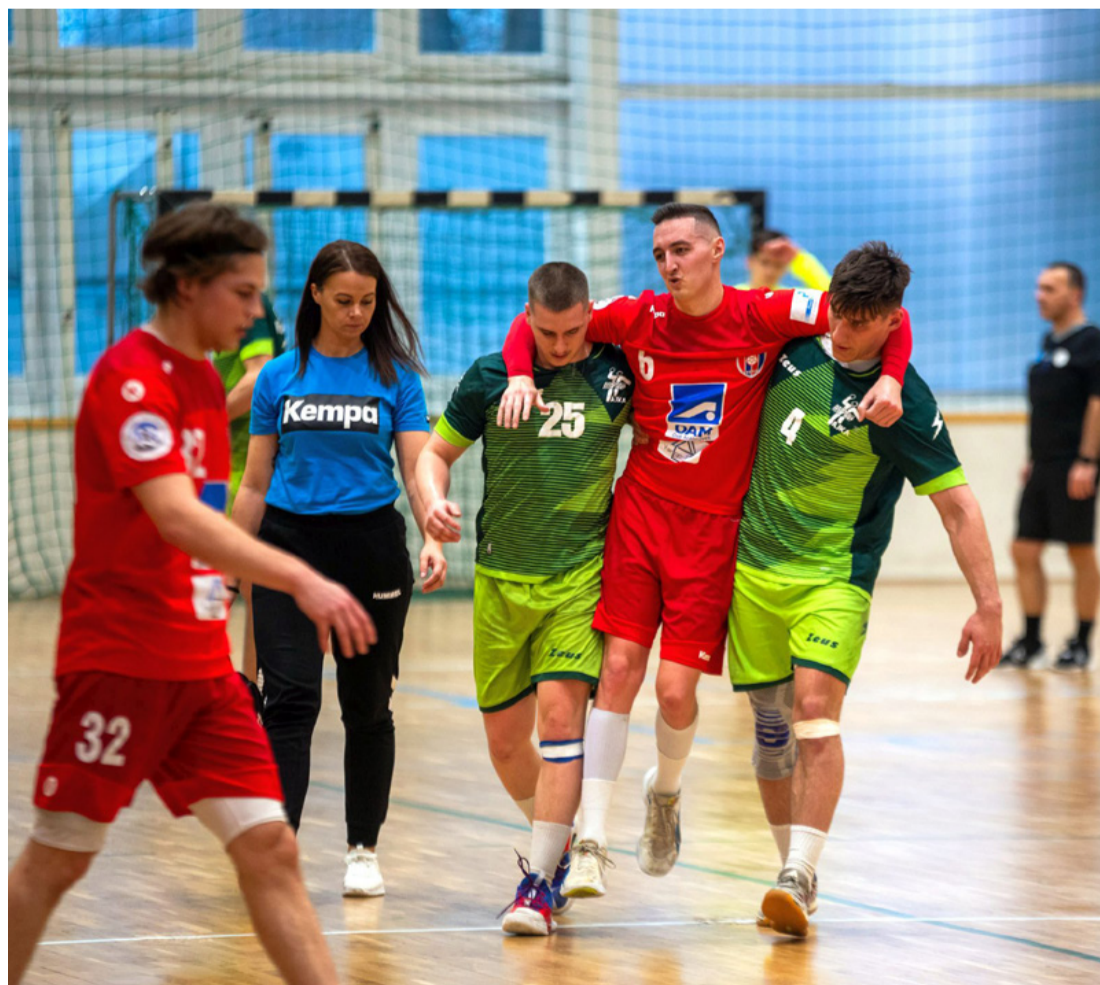
A mérkőzés egy fair play díjas mozzanata

Az ózdiak azonnal időt is kértek, de a közönsége által támogatott zöldek tíz perccel a vége előtt átvették a vezetést (30-29). A hajrára már négygólos is volt a hazai előny, amiből a vendégeknek sikerült kettőt lefaragni, de az ajkaiak a győzelmet már nem engedték ki a kezükből.