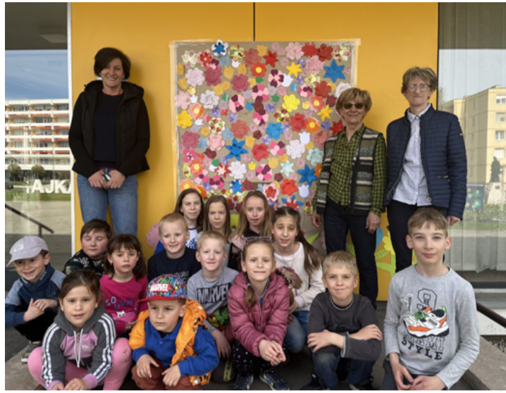
A feldíszített Tavasz fa és láthatóan elégedett alkotói

■ Április 3-án vidám játékdélelőttre várták a gyerekeket a Nagy László Városi Művelődési Központ és Könyvtár gyermek és ifjúsági programszervezői az Agórára és az épület aulájába, hogy a gyermekek tartalmasan tölthessék el a tavaszi szünetnek ezt a délelőttjét.