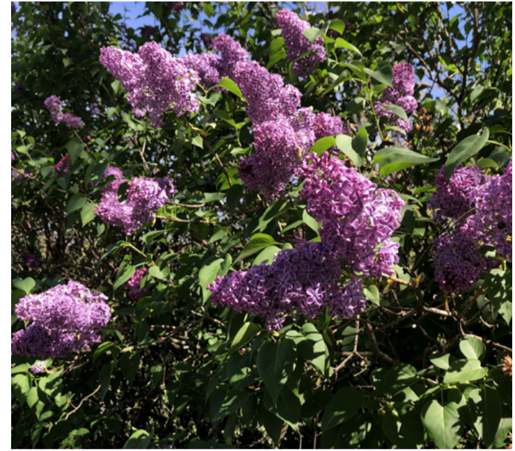
Már március végén örülhettünk az orgonanyílásnak. Kérdés, jó-e ez nekünk?

Paradicsom: Sokféle változatban elérhető, és könnyen nő az otthoni kertekben. Ér-