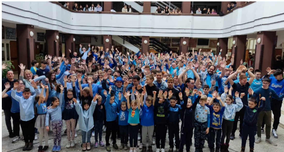
A HAPPY-hét lelkes résztvevői

A hét zárásaként március 22-én, a víz világnapján, arra kértük diákjainkat és dolgozóinkat, jöjjenek kémben, és ezt meg is örökítettük az aulában. Erre az eseményre meghívtuk a Csodavár Általános Iskola tanulóit is, akik örömmel csatlakoztak a bánkisokhoz. Diákjainktól azt a visszajelzést kaptuk, hogy szívesen vettek részt a programokon, így fontolóra vesszük, hogy máskor is csatlakozunk a HAPPY-héthez, és még több tantárgy tanítása során kerül majd elő a víz szerepe, legalább ezen a héten.