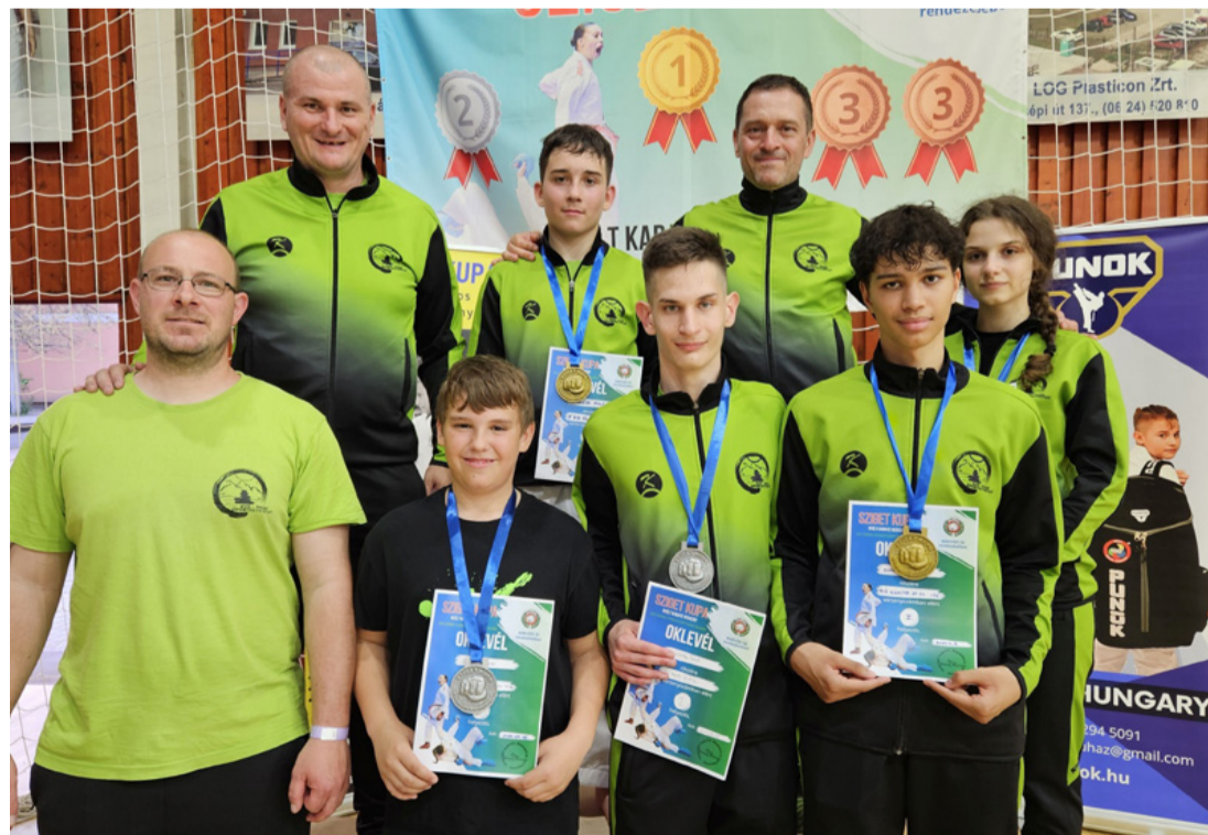
Cserélődnek az arcok, de az eredmények a régiék