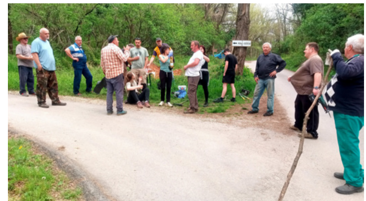
A közösségi munka résztvevői az egyesületi elnök munkavégzési tanácsait hallgatják

– A Csapás út elején van egy 20 km-es sebességkorlátozó tábla, ami azt jelenti, hogy az egész kanyargós úton ekkora sebességgel kellene közlekedni! Vannak, akik (nem a hegyi gazdák között!) rali pályának tekintik ezt az utat. Ez ellen nem tudunk mit tenni, de a biztonságos közlekedés érdekében jó szélesen kivágtuk az út szélén lévő cserjéket. A jobb beláthatóság eleve csökkenti a balesetveszélyt.