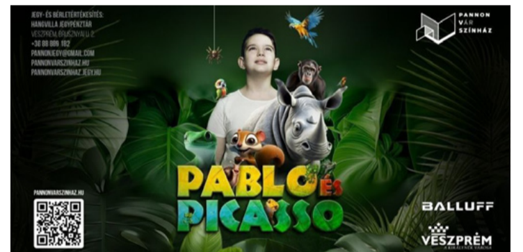
A Pablo és Picasso színházi plakátja