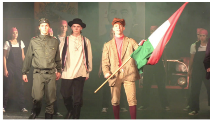
Egy jelenet az ötvenes évek „szűk levegőjét” idéző zenés darabból

A nyár egy izgalmas attrakciója lesz a Pablo és Picasso musical ősbemutatója Ajkán, amiben számos új tehetséget ismerhetünk meg és nem csak veszprémieket, de budapestieket is, akik mindenképpen benne szerettek volna lenni ebben a produkcióban. Az igazgató-rendező szemlátomást nem akar kifogni a dícséretekből.