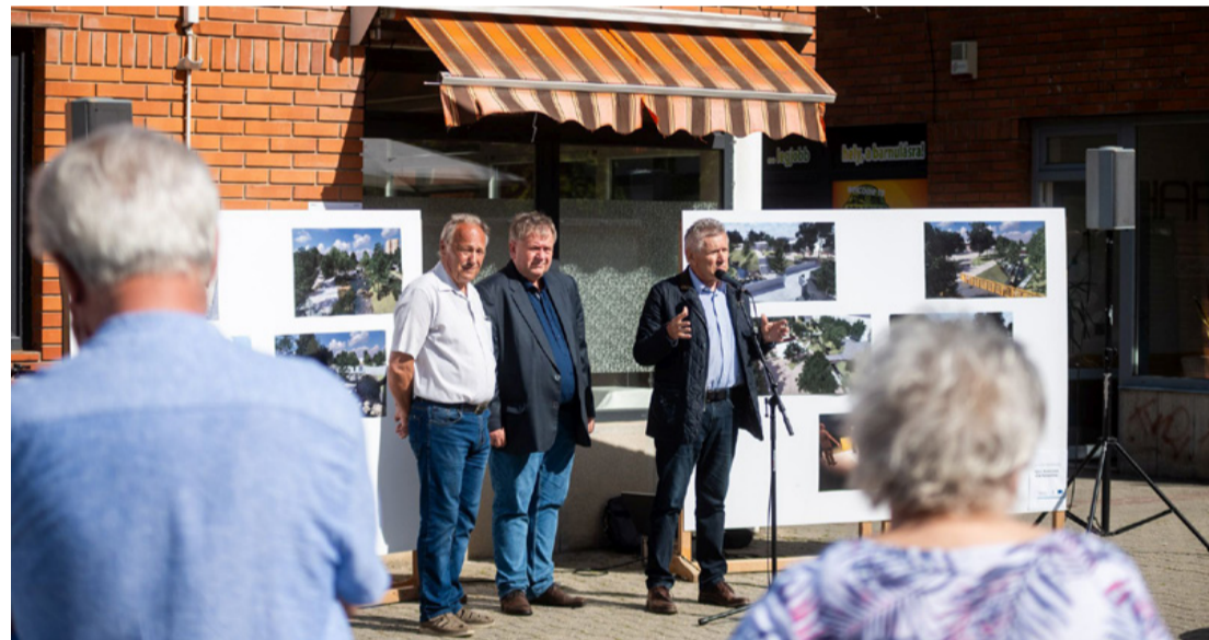
Most már valóban nagy dolgok vannak készülöben

A projekt a Széchenyi Terv Plusz program TOP_PLUSZ-1.2.3-21-VE1 Belterületi utak fejlesztése tárgyú felhívás keretében valósul meg. A támogatás forrását az Európai Regionális Fejlesztési Alap és Magyarország költségvetése társfinanszírozásban biztosítja.