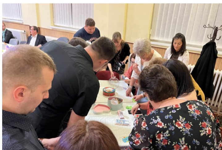
Felajánlásokból nem volt hiány, jól fogytak a tombolák is