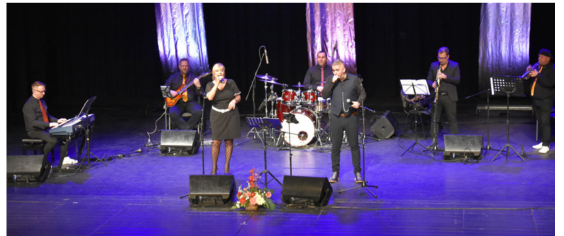
A zenés est előadói a művelődési központ színpadán