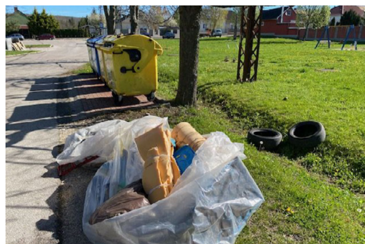
Csendélet a csertelepi buszfordulónál