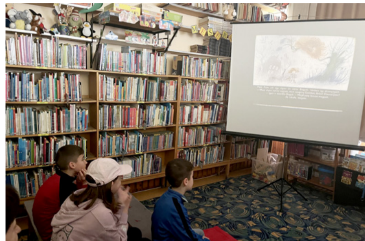
Jó ötletnek bizonyult a diavetítés program a Bogáncs gyermekkönyvtárban

■ Tavaszi játszóházba várták az érdeklődőket a Bogáncs Gyermekkönyvtárban április 4-én délelőtt, ahol diafilmvetítés, kézműves foglalkozás és sok-sok játéklehetőség közül választhattak a gyerekek.