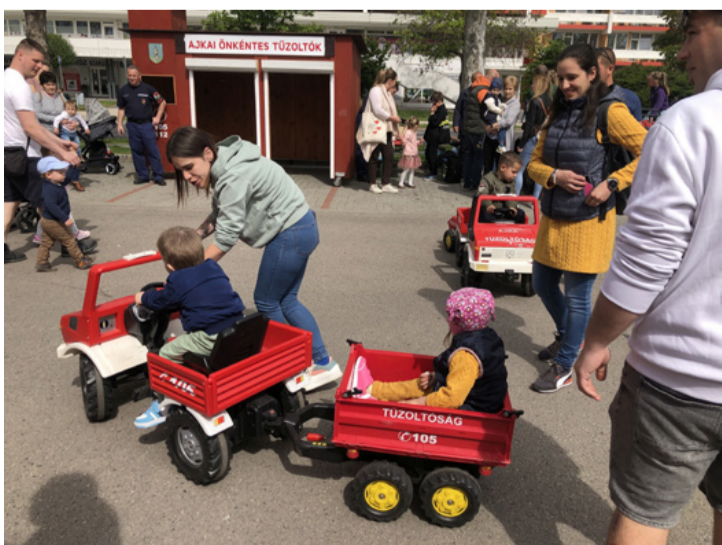
Ma még játék, holnap már hivatás