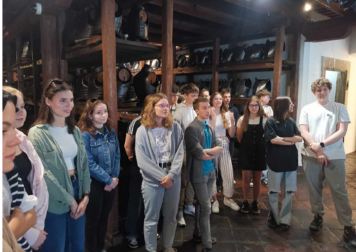
A kirándulók a fegyvermúzeumban