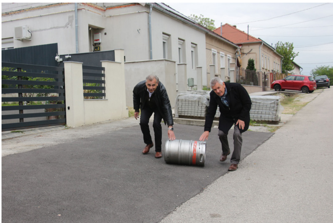
Egy felújított kapubejáróban gurul a hordó