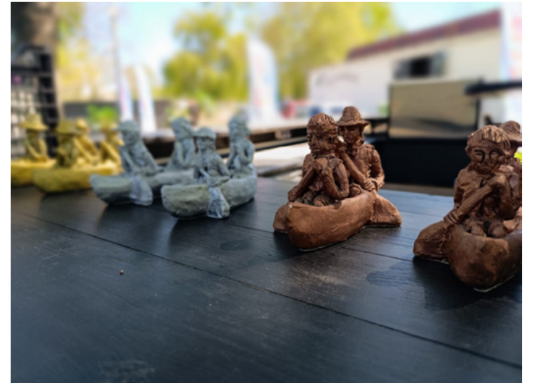
Az ajándék kenu szobrok