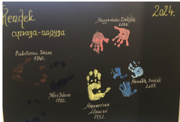
A nagy feltűnést keltett tenyérlenyomatok

■ A Modern Ajka programsorozat keretében április 18-án egy különleges Alkotó kiállítás nyílt az Ajkarendeki Regenbogen Művelődési Ház előterében. A kiállítás célja az volt, hogy bemutassa a falu lakóinak sokszínű kreativitását az egyedi és modern alkotásokon keresztül, amelyek széles skálán mozogtak.