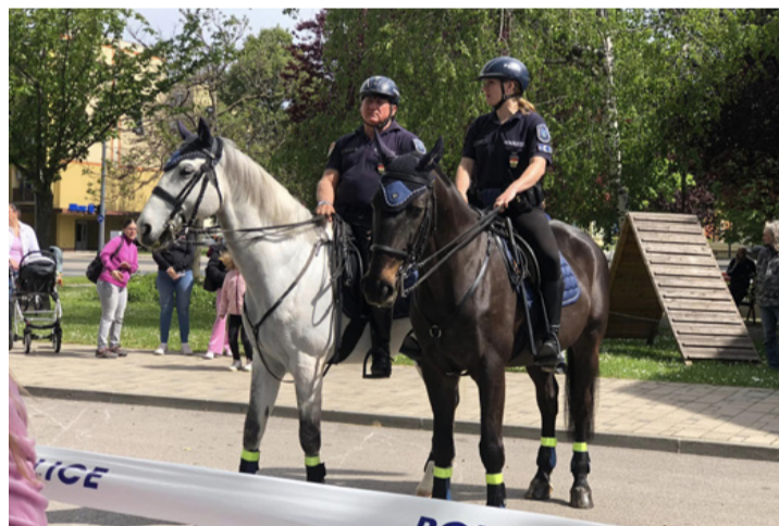
A gépjárművel nehezen járható területeken még mindig a lovasrendőröké a főszerep