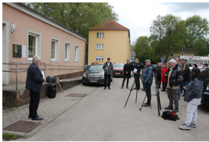
A beruházás új szakaszának indulását, ami jó hír az ajkaiaknak, élénk érdeklődés kísérte