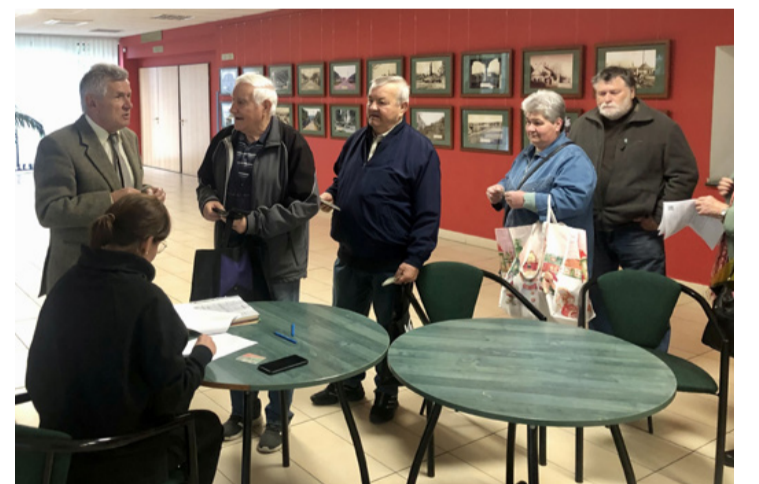
A polgármester személyesen is támogatta a LED izzók kiosztását

polgármester elmondta, hogy Ajkán 12 ezer háztartás van és sajnos nagyon kevesen éltek ezzel az ingyenes lehetőséggel, mert most a vártnál kevesebben, mindössze 180 háztartás igényelte az ingyenes izzókat. A két fordulóban Ajkán összesen 436 háztartás regisztrált. Egy háztartás átlagosan 11 darab LED izzót vehetett át, ami 5003 db LED izzó kiosztását jelent városunkban. A regisztrációt a ledcere.hu oldalon lehetett megtenni, de azoknak a lakosoknak, akiknek nem volt lehetőségük az online regisztrációra otthonukban, az önkormányzat munkatársai is segítséget nyújtottak. Ahhoz, hogy valaki ingyenesen hozzájusson az LED-izzókhoz, minimális feltételekkel kellett rendelkezni. A regisztrációhoz