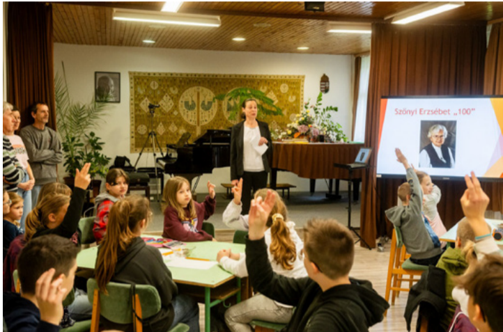
Az ifjú zeneiskolások aktívan vettek részt a versenyben