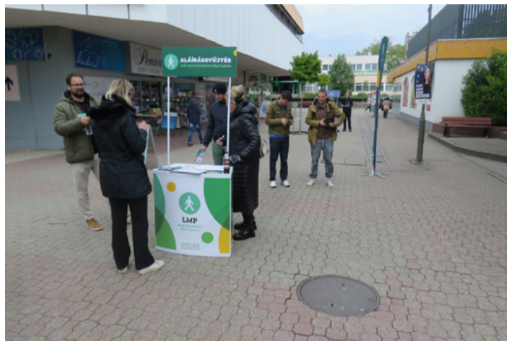
Az LMP standja az ajkai sétáló utcában

Az elnök kissé meglepődött, hogy nem az ajkai politikáról kérdezzük, bár nyomban elismerte, hogy azt nem is ismeri mélyebben. A továbbiakban világossá tette, hogy elsősorban a BKK vezérigazgatóját, Draskovits Tibor korábbi pénzügyminisztert tartja a főmumnak a városházán, akinek állítólag semmilyen közlekedésszervezői tapasztalata nincsen. A nagy gazdasági világválság alatt betöltött szerepe sem örvend „közszereplésnek”, de a legnagyobb hiánya az előbb említett hiányosság. De elengedték a „Drazsé” témát, mivel az elnök gyorsan áttért a DK legújabb felvetésére, miszerint amennyiben a DK előre tör az Európai parlamenti választásokon, előre hozott választásokra lenne szükség. Ez badarság – állítja határozottan Ungár Péter. Még akkor is, ha ezzel egy frissen felfedezett