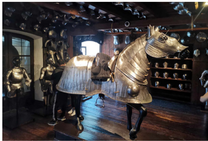
Az a bizonyos lópáncél, amiből csak hét maradt fenn a középkorból