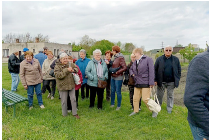
Csékútiak a Bolgárkertben

■ Nem ígérkezett napfényesnek a péntek reggel, de a borúra szerencsére jött a derű, és a délelőtt folyamán még a nap is kisütött. Mondhatjuk, hogy kedvezett az időjárás a Csékútiaknak, akik erre a napra szerveztek egy kirándulást a Bolgárkertbe.