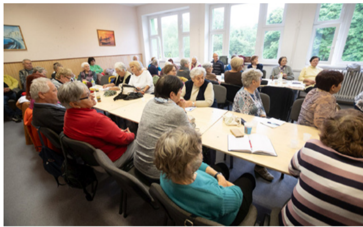
Sokan eljöttek a félévszázados megemlékezésre