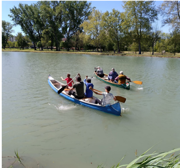
Alig várták már, hogy megmeríthessék lapátjukat a tó vizében

Ötödik alkalommal szervezte meg a Tósokberéndért Egyesület a Tóber-kenu elnevezésű evezős versenyt április 27-én a Csónakázó tavon. Szombat délelőttre kisütött a nap, melegebbre fordult az idő. Sokan neveztek, így mind a négy versenyszámot indították. Meghívták az Ajkai Eötvös Loránd-Kossuth Lajos Általános Iskola Bejárható Magyarország programban tanuló diákjait is, valamint Veszprémből is érkeztek a sportágot kedvelők.