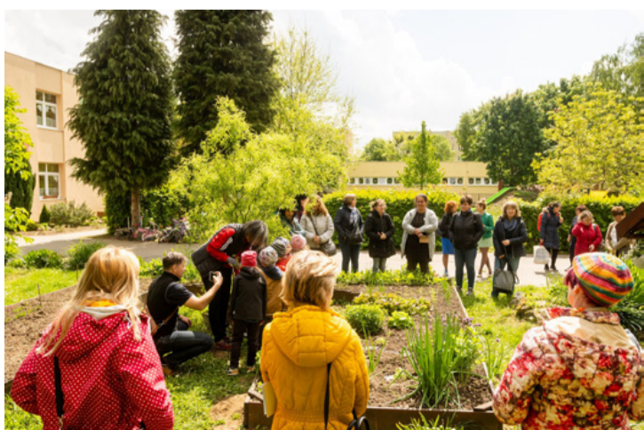
A szakmai tanácskozás résztvevői megnézhették az óvodák szépen gondozott ágyásait