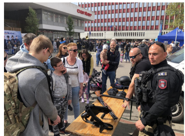
A szigorú tekintet fontos kellék bizonyos területeken