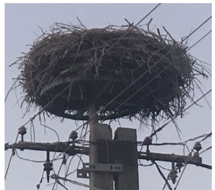
Egy elárvult rendeki fészek