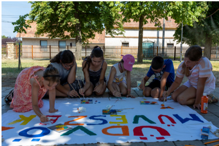
Nincs lélekemelőbb dolog a közösen végzett munkánál

■ Olyan jól sikerült az első alkalommal megrendezett Népi csemete játszma elnevezésű alkotó tábor, hogy a résztvevők kérésére tanévben is tartanak fotós és képzőművészeti foglalkozásokat. A táborban, amely Halimbán volt, három ajkai iskola, a Csodavár, a Fekete-Vörösmarty és a Szent-Györgyi diákjai is részt vettek.