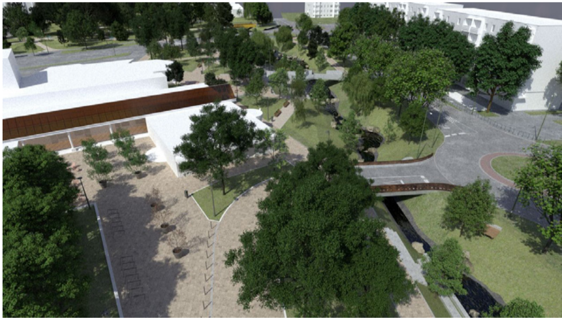
Látványterv a körforgalomról és hídról