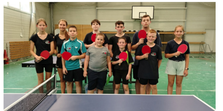
Az asztal mögött, nagy feladatok előtt az ASE fiataljai

A Kúti Presszó és Falatozó valamint az Arida KKT. újra a gyerekek mellé állt, ásványvízzel, szörppel, banánnal, müzli-vel támogatták a nyári felkészü-