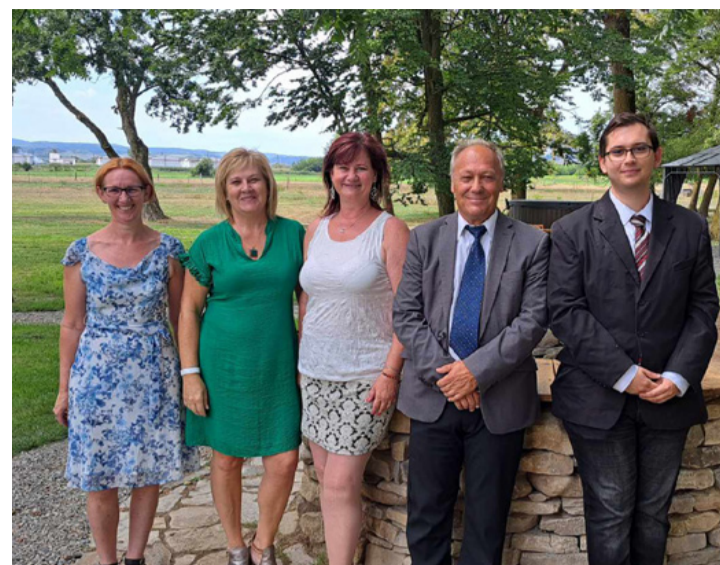
Az ajkai delegáció az Ugron-kastély előtti parkban

az évek óta fennálló kapcsolatokat Ajka és Székelykeresztúr városa között. Városunkban a jó együttműködés hagyományainak látható jelei is vannak, talán elegendő, ha a 2019-ben