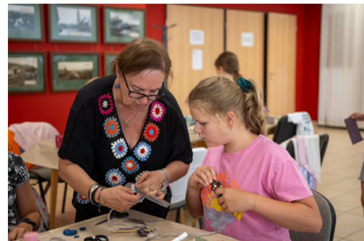
Figyelni kell a hozzáértő kezek minden mozdulatára