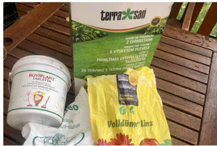
Egy felkészült kiskertész mindig a legmegfelelőbb műtrágyát alkalmazza

gya ezeket a tápanyagokat. Egy 10-20-10 jelölésű műtrágya például 10% nitrogént, 20% foszfort és 10% káliumot tartalmaz. A megfelelő arány kiválasztása kulcsfontosságú, hiszen a különböző növények eltérő tápanyagigényekkel rendelkeznek. Az (N) nitrogén az egyik legfontosabb tápanyag, amely elsősorban a növények zöld részének, a leveleknek és hajtásoknak a növekedését serkenti. Ha a talaj nitrogénhiányos, a növények lassú növekedést mutatnak, és leveleik gyakran sárgulnak. A foszfor (P) kritikus szerepet játszik a gyökérszövet fejlődésében, a virágzásban és a terméshozamban. A foszforhiányos növények gyengén fejlődnek, kevés virágot hoznak, és gyökérzetük sem képes elég mélyre hatolni a talajban. A kálium (K) hozzájárul a növények egészségéhez és erősíti ellenálló képességüket a betegségekkel és a szárazsággal szemben. A káliumhiányban szenvedő nö-