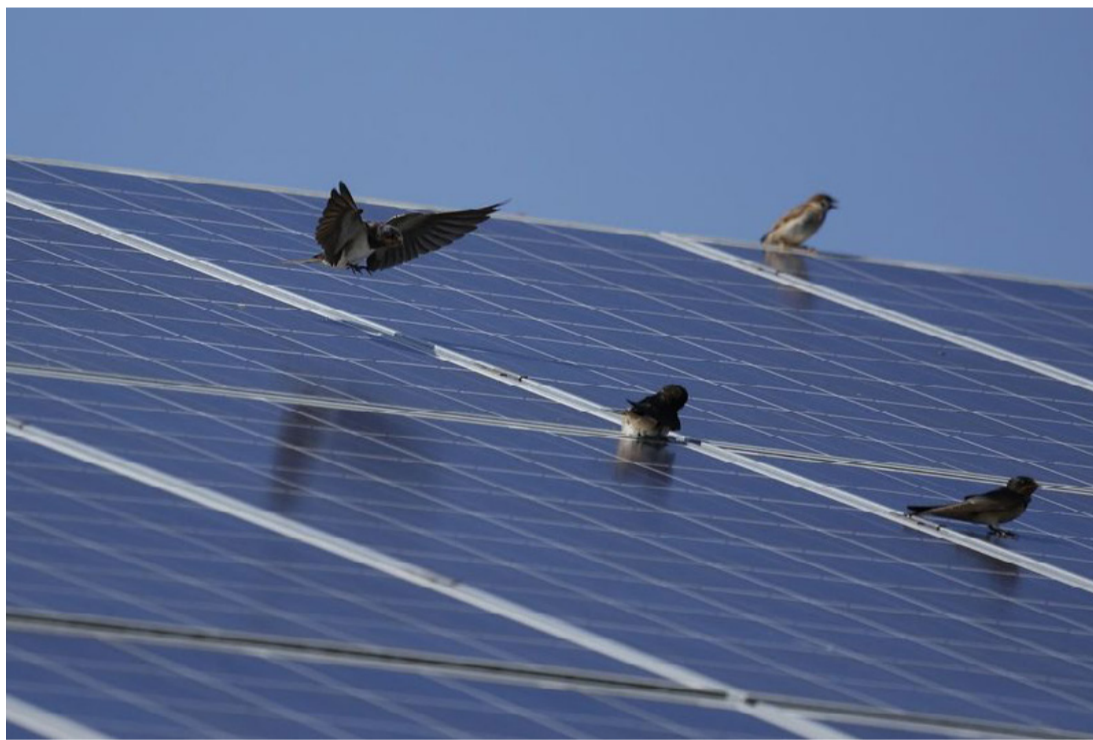
Napelemeken melegedni vágyó fecskék