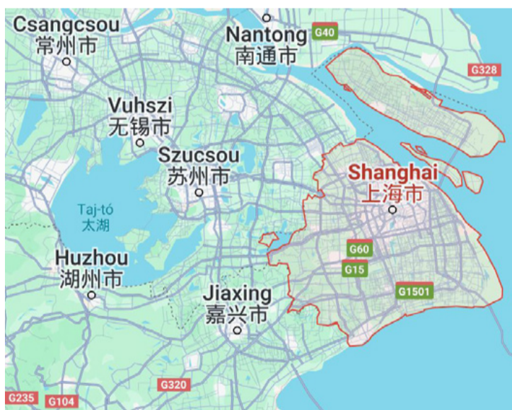
Jiaxing Sanghajtól délnyugatra helyezkedik el