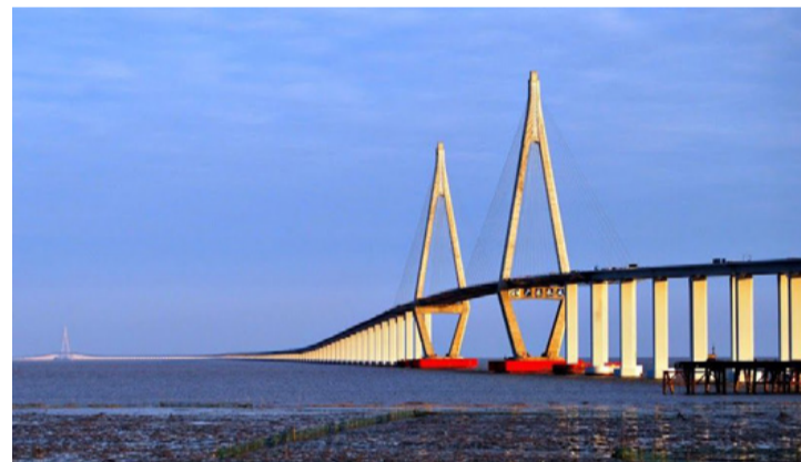
A Hnagzou-öböl hídja a város közelében

A 2003-ban alapított Jiaxing Export Processing Zone (export feldolgozási zóna) az Állami Tanács által jóváhagyott állami szintű övezet. Beépített területe 2,98 km 2 . Fejlesztési célja, hogy az IT,