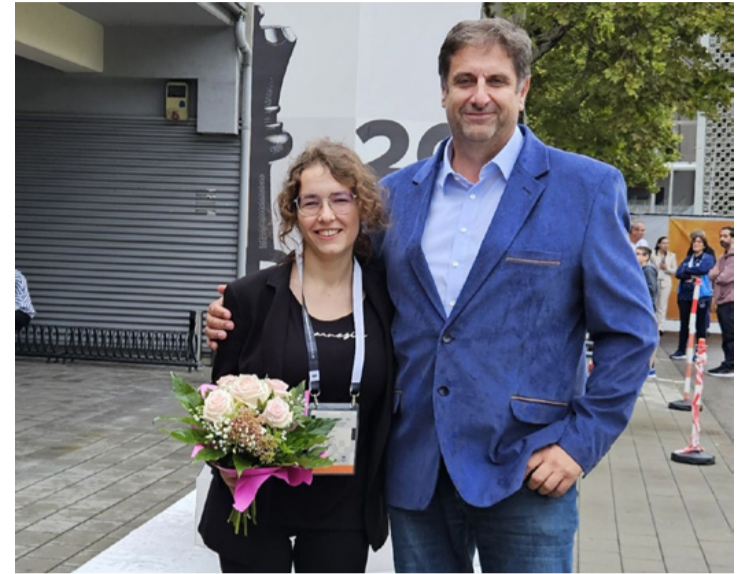
Női magyar bajnokunk és egyik legnagyobb támogatója