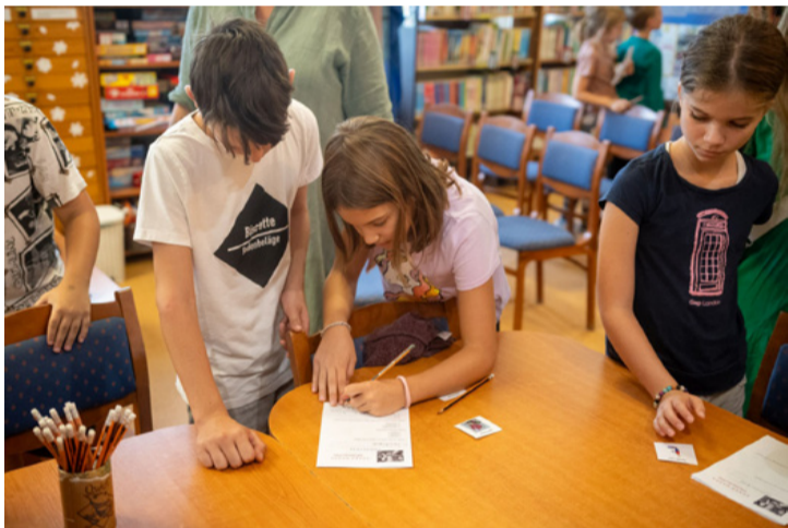
A gyerekek átélhették a közösen végzett munka örömét is