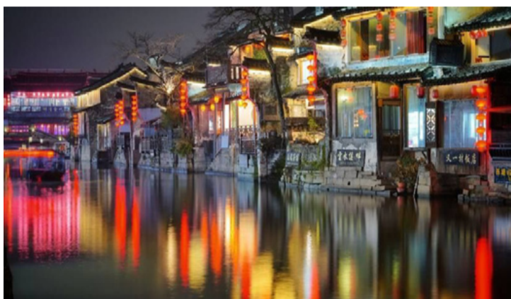
Jiaxing éjszakai fényei

■ Szeptember 21-én hat tagú kínai delegáció érkezik Ajkára, Jiuzhou Körzet Jiaxing városából, elsősorban azért, hogy megtekintse a FŐNIX Ipari Parkot és tárgyaljon a város vezetésével.