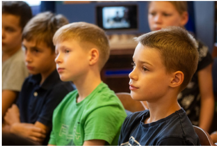
Az előadást értő figyelemmel követték az olvasás kis rajongói