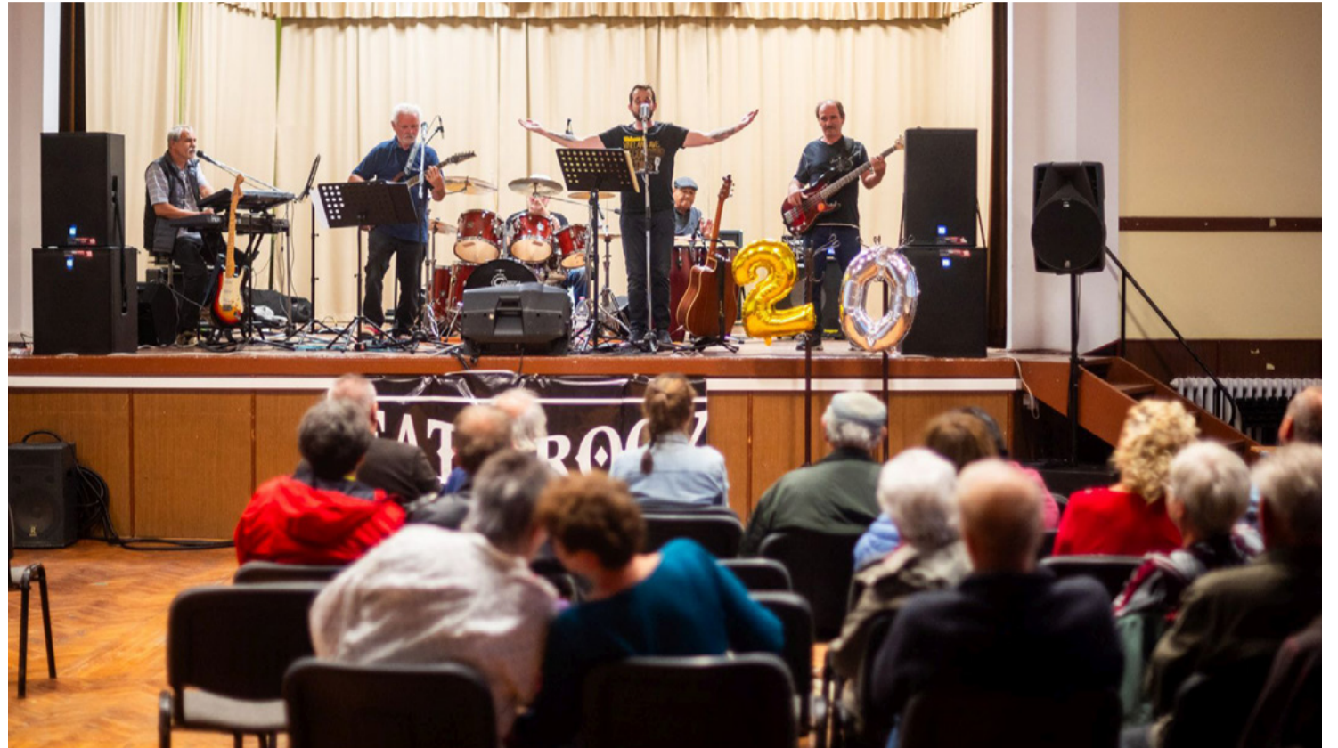
A színpadon a Fate-rock