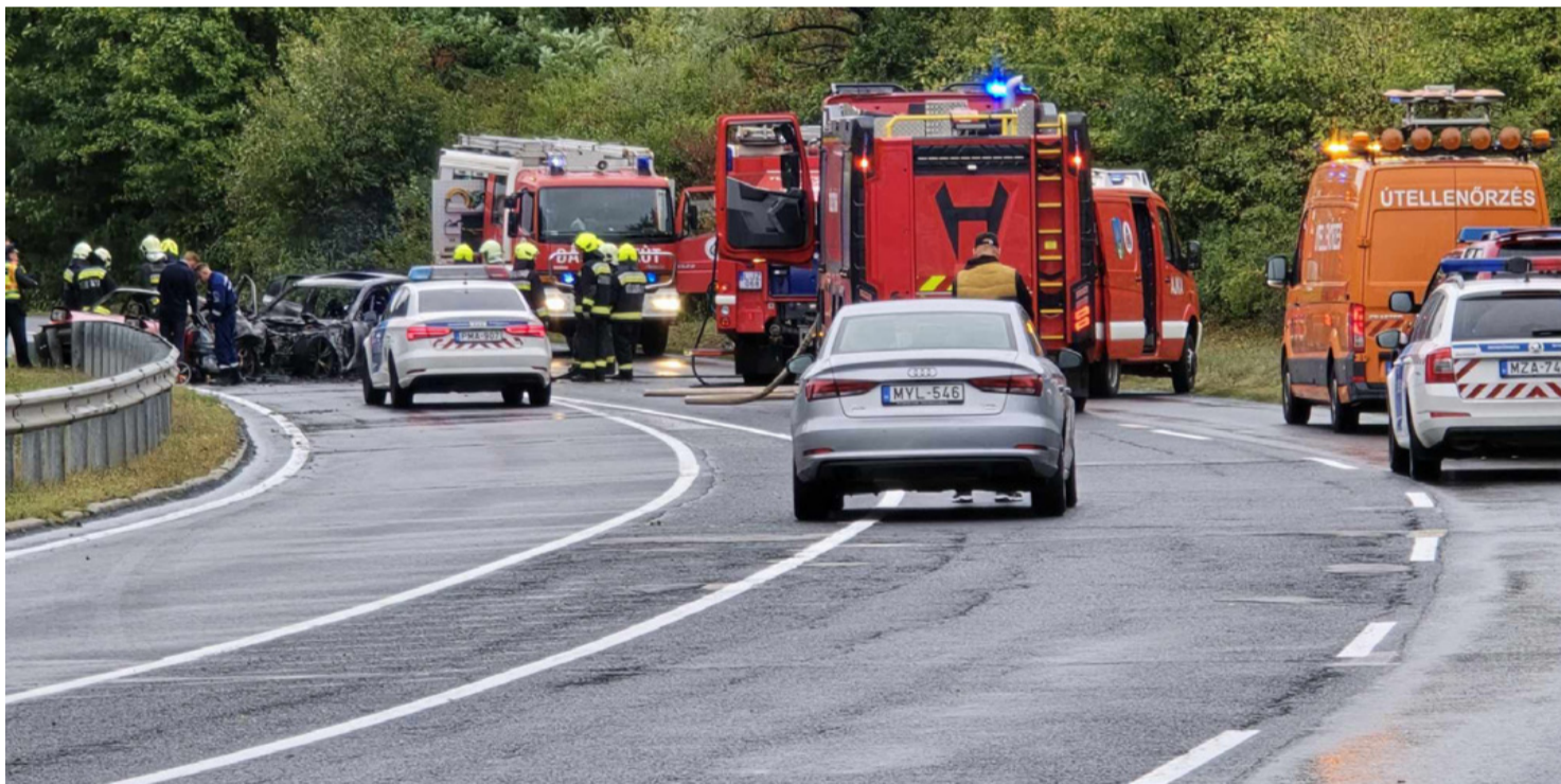
A legsúlyosabb tragédia a 8-as úton történt