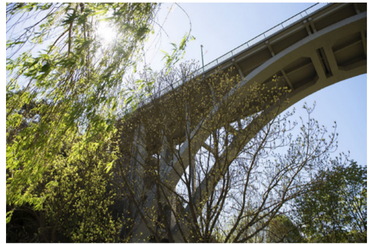
Az öngyilkos jelölteket vonzó viadukt egy részlete