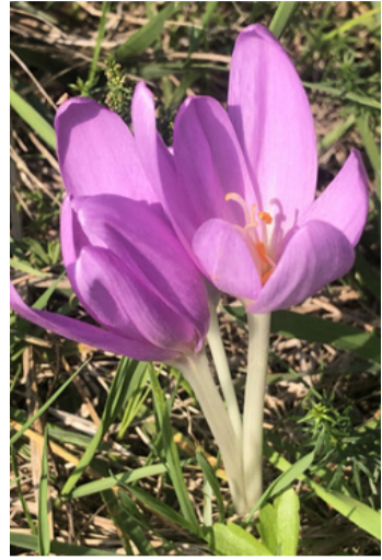
Az őszi kikerics könnyen összetéveszthető a krókusszal

A növény minden része, de különösen a gumója és a virágai kolchicint tartalmazzak, amely már kis mennyiségben is súlyos mérgezést okozhat. A legelő állatoknál nagyon fontos, hogy semmi esetre sem egyenek belőle. Nem csak ránk mérgező, de rájuk nézve is, sőt még a tejben is megmarad, ha a kedvenc kecskénk eszik belőle. Ha mégis gyönyörködni szeretnénk a vi-