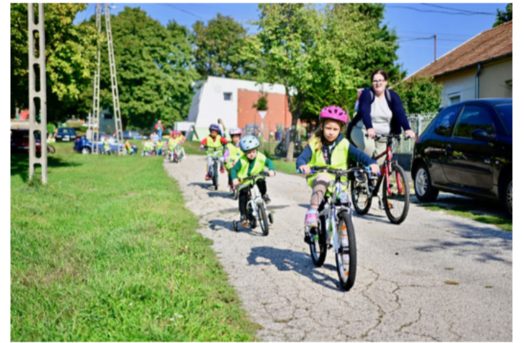
Nem lehet elég korán kezdeni

Tervezik, hogy a nagycsoportos gyerekekkel, szüleikkel kerékpáros túrákat szervez-