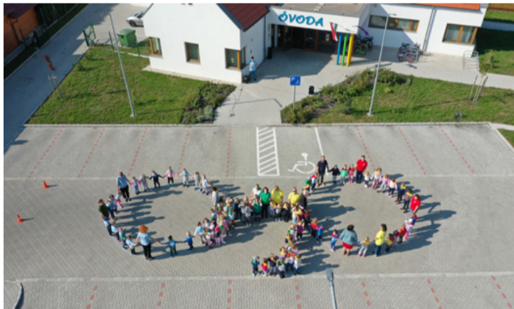
Biciklis flash mob az óvoda előtti parkolóban