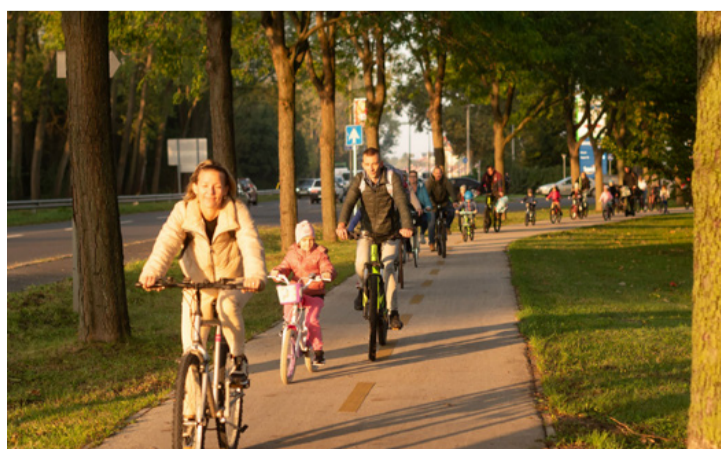
Így néz ki a „bicibusz”

eljutnak az úticéljukig, így a szülők is szívesen elengedik őket.