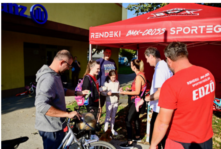
Igazi mozgalmas reggel volt

■ Tizedik alkalommal csatlakozott Ajka Város Önkormányzata az Európai Mobilitási Hét programsorozatához, amelyet szeptember 16. és 22. között rendeztek. Ajkán minden korosztályt igyekeztek bevonni a programokba.