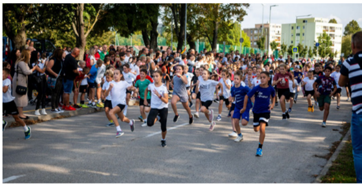
Nem szégyen a futás és hasznos is