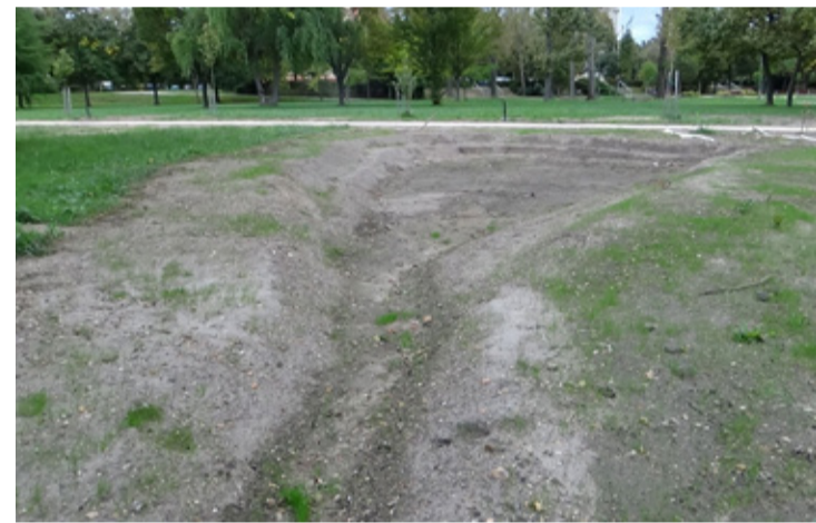
Az épülő esőkert aljzat kialakítása