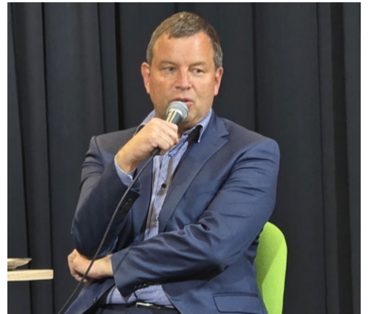
A legtöbben pesszimistának tartják, pedig lehet, hogy csak jól értesült optimista

Az előadás záró részében szó volt a fenntarthatóság fontosságáról, hangsúlyozva, hogy bár sokak számára pesszimistának tűnhet a jövőképe, a tudományos tényeket nem lehet figyelmen kívül hagyni. Úgy véli, hogy a globális kihívásokra nehéz megoldásokat találni, de az őszinte és felelős együtt