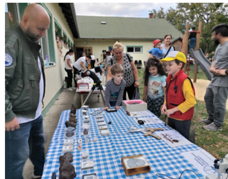
A Bakonyi Csillagászati Egyesület bemutatója is érdekelte a gyerekeket

A Bakonyi Csillagászati Egyesület standjánál mindig volt érdeklődő kisgyermek, aki izgatottan vette kézbe a meteoritokat. Az általuk feltett kérdésekről kiderült, érdeklőket a dínók kora, a dinoszaurusz fossziliát tartalmazó pala mindannyian megtapogatták. (ta) ■