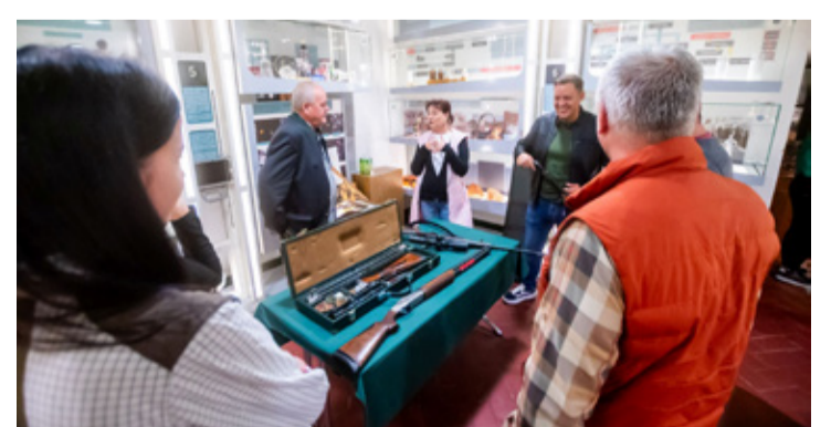
Szűk körben, jó hangulatú beszélgetés zajlott az erdő, a vadak és a vadászok viszonyáról