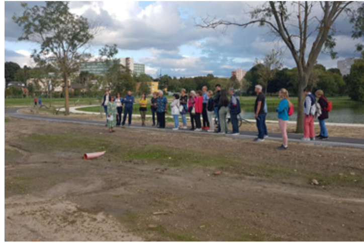
Egy füves vápa kialakulóban