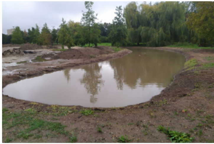
A városligetben készülő esőkert a napokban lehullott csapadék után. Ez az esőkert Ajka új Zöld Világ Programjának része, amely a fenntartható városfejlesztést és a környezetbarát megoldásokat helyezi előtérbe

■ Egy új, nagyszabású programba kezd Ajka néhány hónapon belül. Ennek előkészítéseként a városvezetés megbeszélést tartott a városházán, hogy kidolgozzák a részleteket. A főbb célkitűzések közé tartozik a zöld területek fenntartható kezelése, a hulladékgazdálkodás javítása, valamint az energia- és vízgazdálkodás korszerűsítése. Az árok- és belvízkezelés, valamint a zöld hulladék gyűjtése is fontos feladat, amit a polgármester igazságosabb rendszeren keresztül szeretne megoldani. A program további célja a fásítás és városi tavak létrehozása, valamint az energiahatékonyság növelése a középületeknél és új lakóépületeknél, miközben a közlekedési morált is javítani kívánják. Ajka új Zöld Világ Programja a fenntartható városfejlesztést és a környezetbarát megoldásokat helyezi előtérbe.