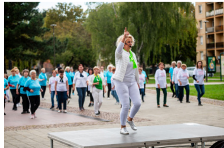
Az örömtánc egy pillanata