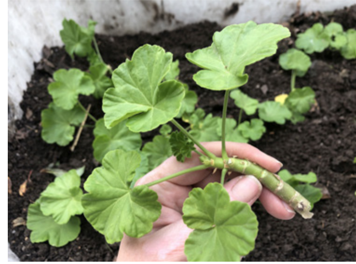
Egy szaporításra kész növénydarab

Bár nagyüzemben magról szaporítják a virágokat, így próbálják elkerülni a fertőzések terjesztését növényről növényre, én mégis jó szívvel ajánlom a vegetatív szaporítást, ami tört, vagy vágott fejdugványokkal történik. Ugyanis a csúcshajtások gyökereznek a legjobban. Ezekből sokkal erőteljesebb új növények fejlődnek. Erős, egészséges hajtásokat választunk. Ezek legyenek 10-15 centiméter hosszúak, virág