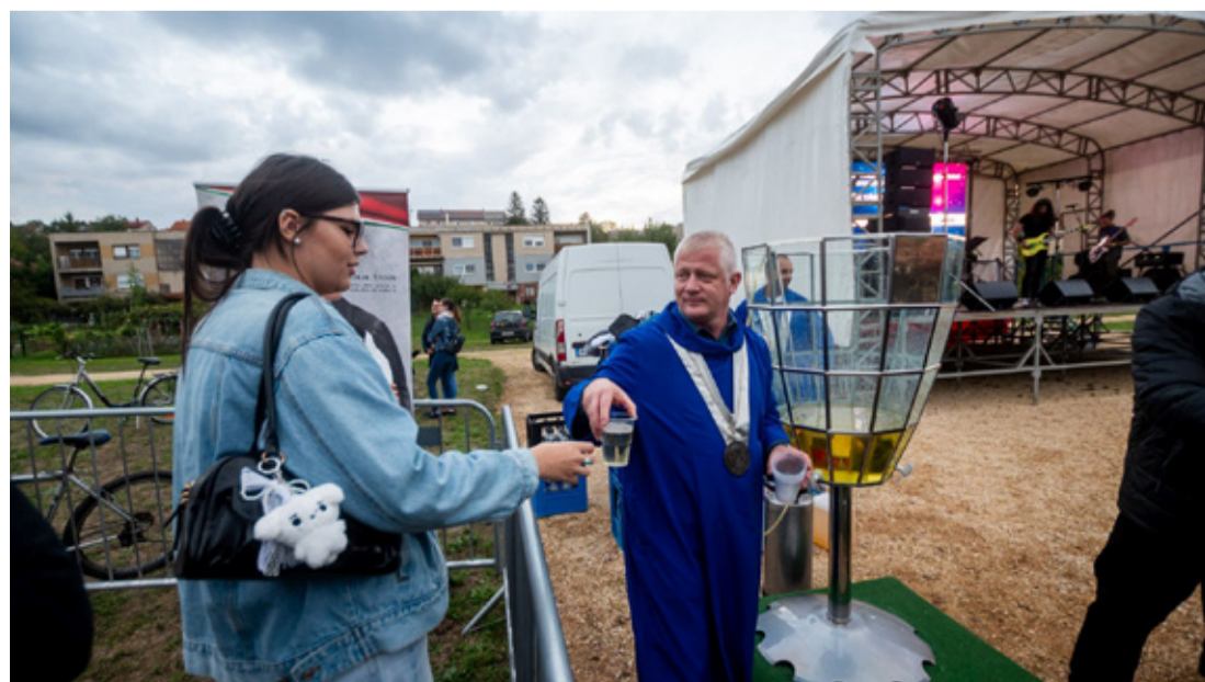
A Magyarországi Szikvízkészítők Jedlik Ányos Lovagrendje és egy Somló-hegyi szőlősgazda jóvoltából ingyen fröccsöt osztottak a szomjazó ünneplőknek