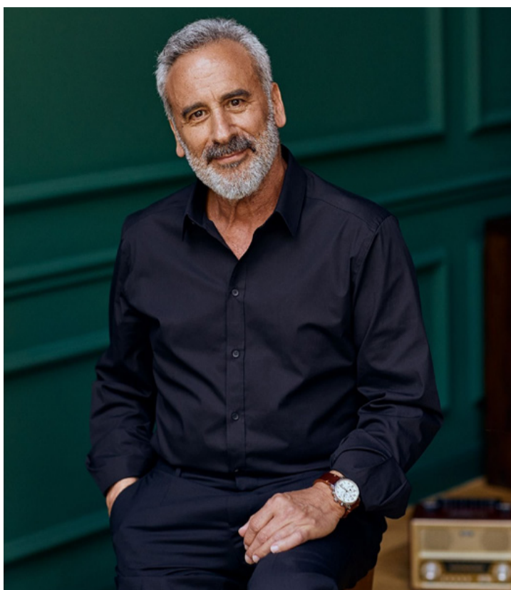
Sikeres tévésből sikeres író lett

Az ajkai előadást felolvasás, valamint vetítés színesítette. Kepes András több, személyes élményt is megosztott a hallgatósággal, mint például a dalai lámával való találkozását, de helyet kapott a közel kétórás előadásban több olyan történet, melyekben saját személyes élményeit, vagy a családjával kapcsolatos emlékeit osztotta meg a hallgatósággal. Az előadásban az írásai közül szó esett a Tövisszuszta , a Világkép vagy épp az Istenek és emberek című könyvekről, majd a 2023-ban megjelent legújabb regénye a Két macska voltam című könyv került az érdeklődés középpont-