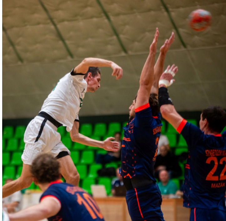
John ismét a mezőny fölé nőtt

■ A kézilabda NB I/B-ben szereplő KK Ajka a 9. fordulóban a listavezető Szigetszentmiklóst fogadta.