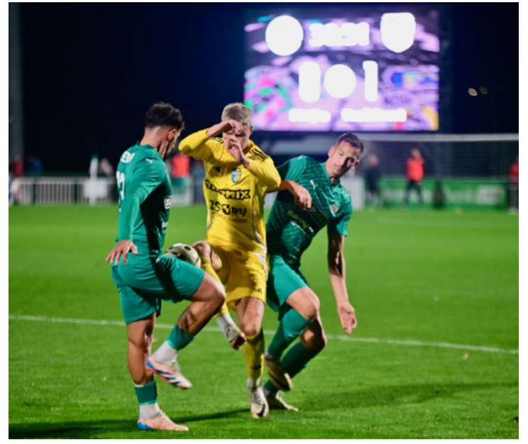
A papírfirma érvényesült