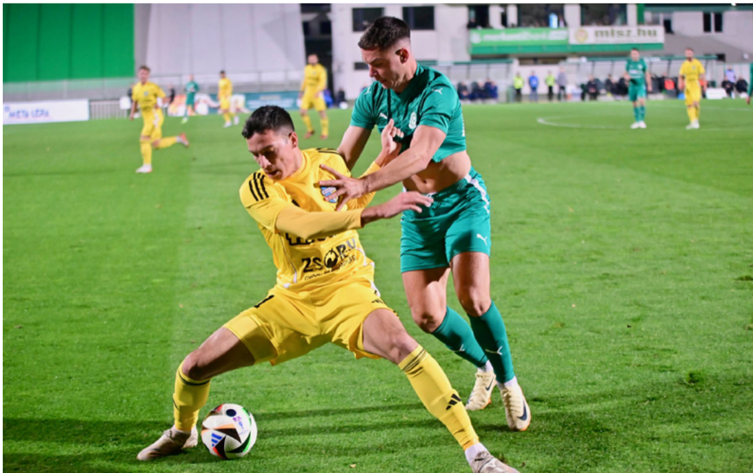
Az FC Ajka 1:1-es döntetlent játszott legutóbb a Mezőkövesd Zsóry FC elleni rangadón. Tudósítás a 7. oldalán

A testületi ülésekről élő közvetítés látható az Ajkai Szó Online FB oldalon. (ta) ■