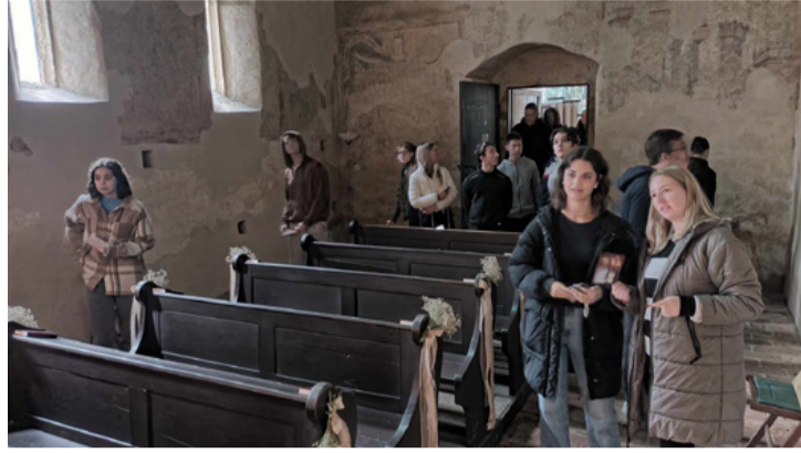
Bródysok a veleméri templomban