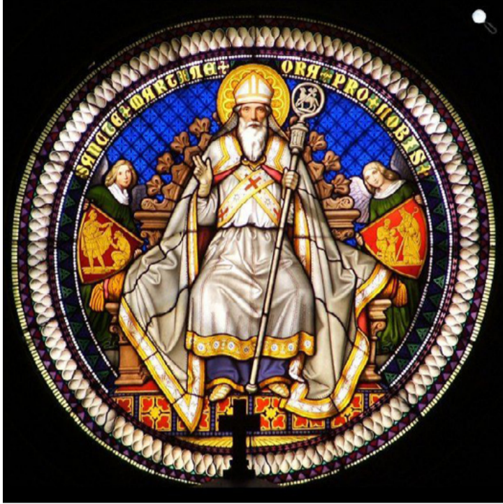
Szent Márton az Apátság egyik ólomüveg ablakán

által alapított igazi Savaria, mégpedig Pannonhalma helyén egy kisebb „villa”, vagy tábor formájában „Savaria Minor” néven (ilyen feliratú tégla