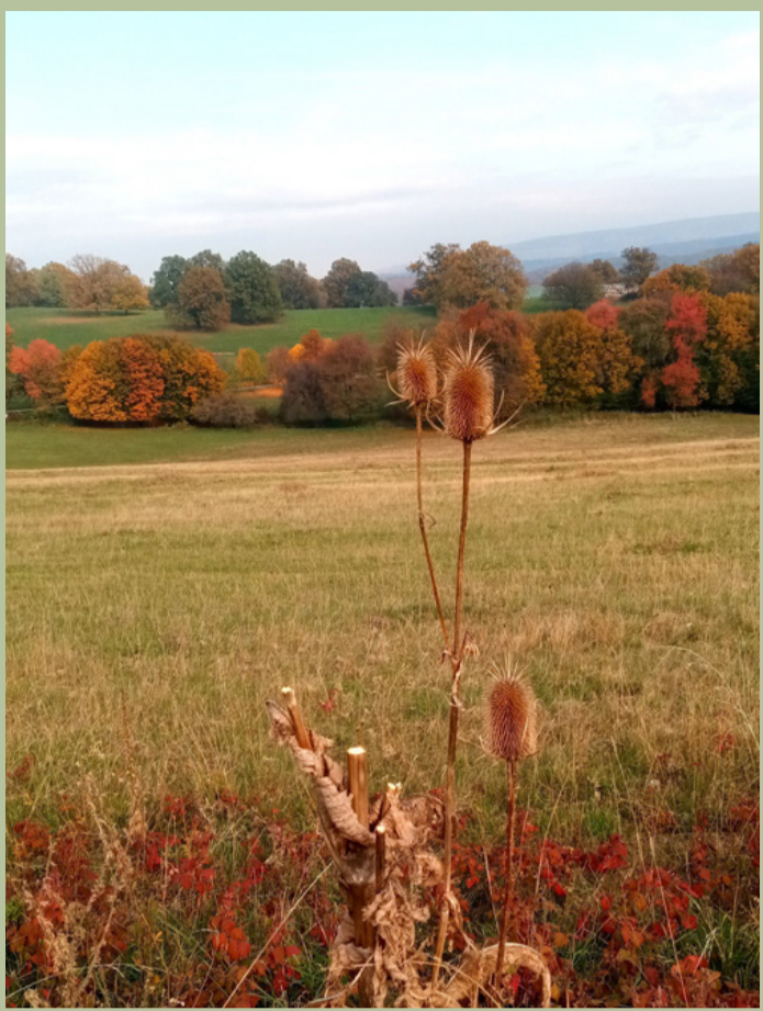
Ősz a Bakonyban