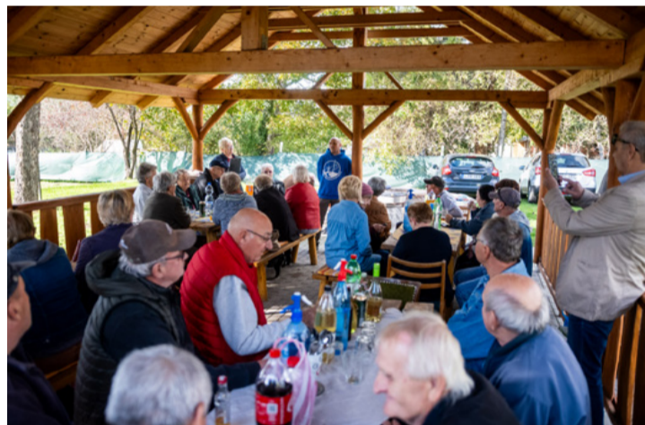
Sok jóbarát elfér a nemrégiben megépített csékúti pergola alatt