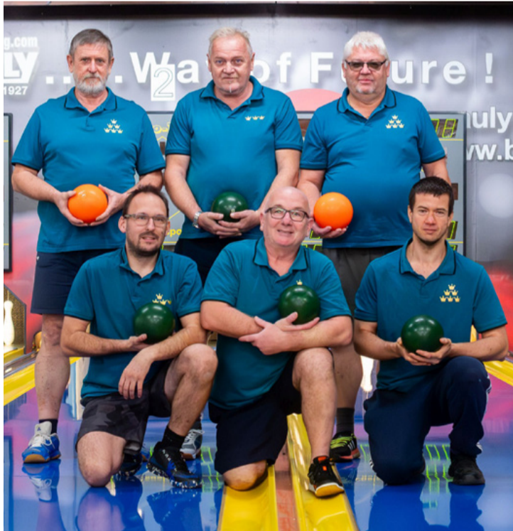
Hetedszer is taroltak a veterán tekesek