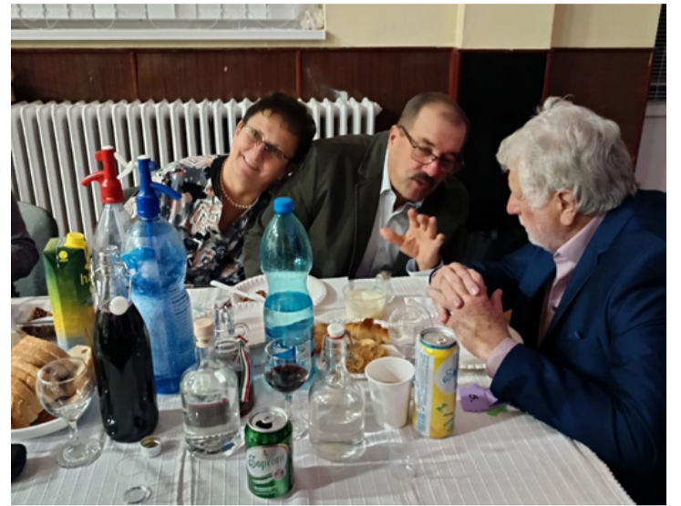
Kötetlen beszélgetés borozgatás közben

megelőző utolsó ünnep, amikor lehetett mulatni. A szőlőtermő vidékeken ekkorra forrt ki az új bor, a gazdák felkeresték egymás pincéjét, megkóstolták a borokat, beszélgettek. Volt időszak, amikor feledésbe merültek ezek a szokások, amelyeket az Egyesület újra kíván élesíteni. A gazdák el is kezdték a pincelátogatást, de mindenhol olyan kedvesen fogadták őket, olyan jóízű beszélgetésbe kezdtek, hogy elszállt az idő, többekhez már nem jutottak el, pedig ugyanúgy szeretettel készültek a fogadásukra. 2013-ban egy beszélgetés során Tölgyesi Zol-