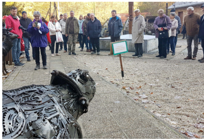
A Bányászati Múzeum udvarán. Előtérben a „vasszörny”