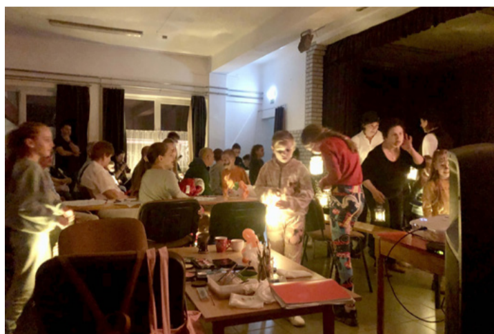
Varázslatos este volt