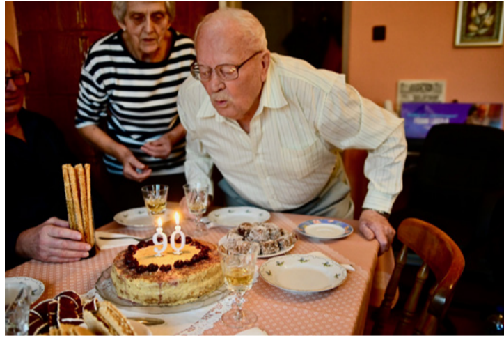
Kettőt könnyebb elfújni, mint kilencvenet...