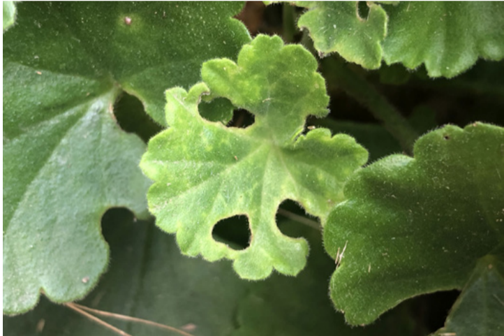
A gyapottok bagolylepke „üzenete”

■ November közepén járunk, most már a napsütéses, meleg napokat felváltják a hűvös reggelek, és a sarki szelek is megérkeznek a muskátlijainkhoz. Ezek a színes virágok nem a fagy kedvelői, hiszen alapvetően meleg éghajlatú vidékekről származnak. (Ezért is figyelemre méltó, hogy egyes kertekben az idén nyáron 3-4-szer is virágot bontott ez a növény – a szerk.) A muskátlik megfelelő átteleltetése igazi kihívás, de ha jól csináljuk, tavasztól újra üdítő színfoltként díszíthetik a kertünket. Lássuk, hogyan teletessük őket úgy, hogy az álló és a futómuskátli is sikeresen átvészelve a hideg hónapokat!