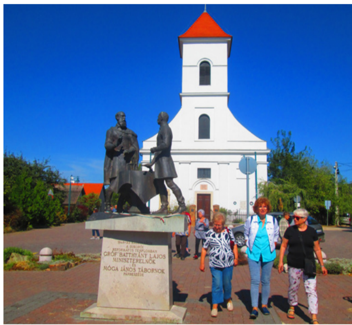
A Móga János és Batthyány Lajos vitáját megörökítő szobor a sukorói templom előtt