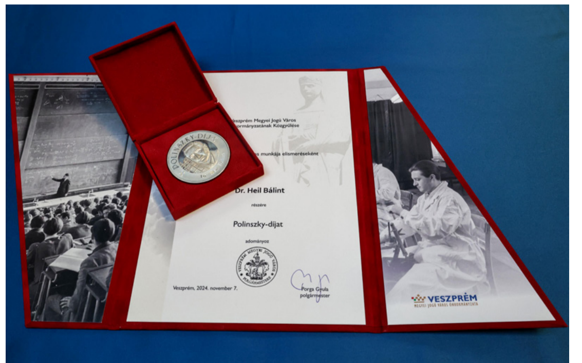
A Polinszky-díjat 2001-ben az egyetem alapítója és első rektora emlékére hozta létre Veszprém önkormányzata és a Veszprémi Vegyészektől Alapítvány