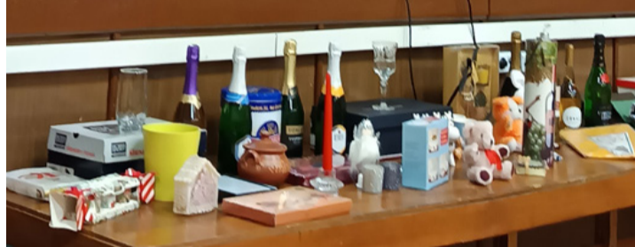
A Cséki Hegyért Egyesület elnöke a tombolanyeremények „főlött”

■ – Az egészséges életmódra nagy hangsúlyt fektetünk – állítja az egyesületi elnök. – Az egészség nem a betegség hiánya, hanem a testi, lelki, szociális jólét. A Cséki Hegyért Egyesület által a 11. alkalommal megrendezett Márton napi zenés, táncos, összejövetel éppen ezért a szociális jólétet, a társadalmi kapcsolatokat erősítését szolgálja.