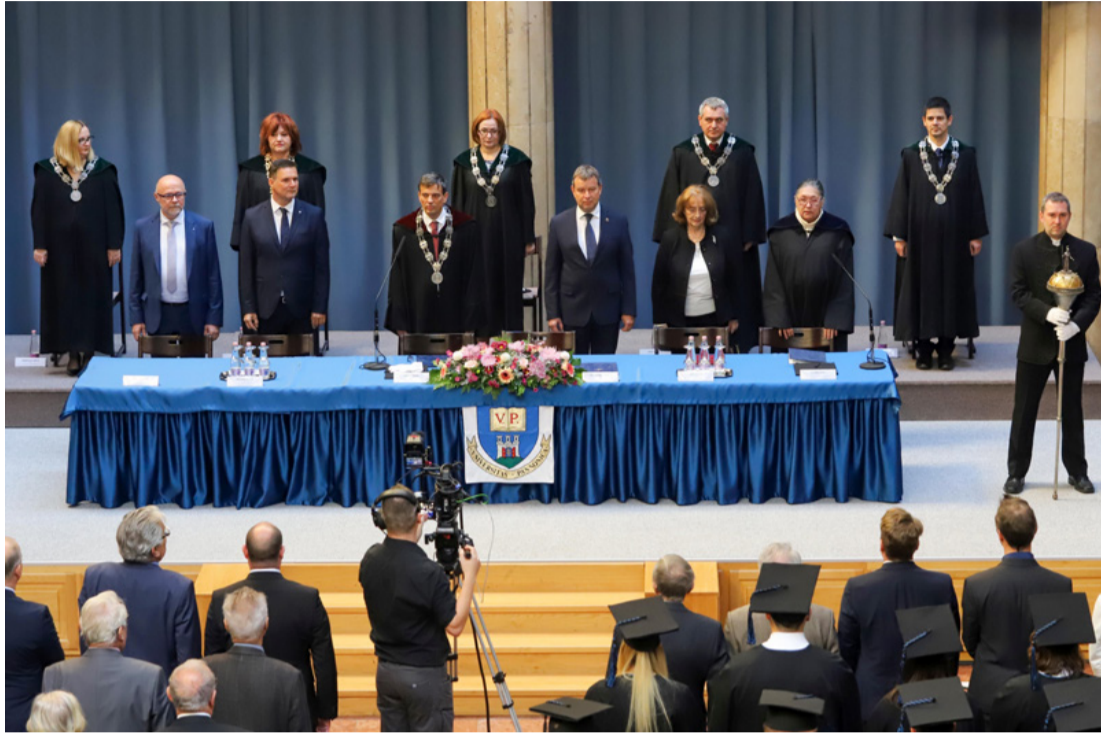
A Tudomány napi megemlékezés elnöksége a PE aulájában

A tudományos kutatás és a politizálás összeegyeztethetetlen