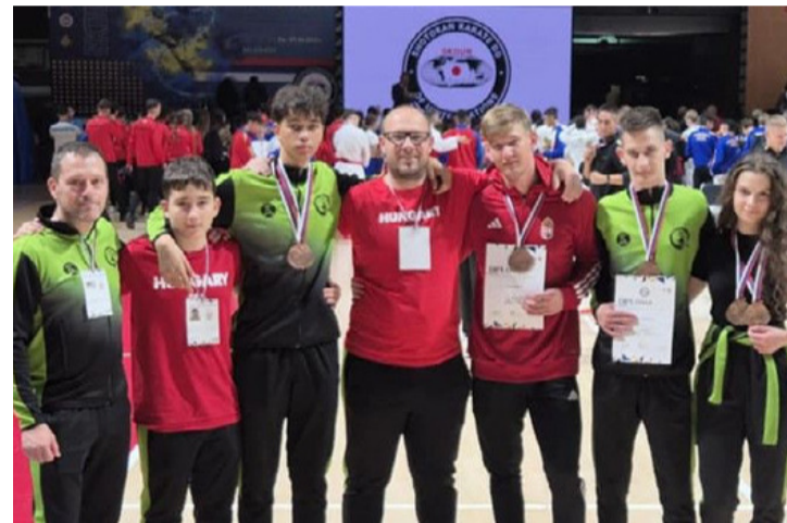
Az ajkai karatékák és edzőik a belgrádi világbajnokságon

A csapatversenyen megint beigazolódott, hogy nincs könnyű meccs, nincs könnyű ellenfél. A mintegy 50 klub által indított versenyzők erős mezőnyt alkottak minden korosztályban. Az ajkai versenyzők kicsit fáradtan, de a