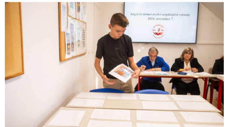
Nem csak ismerni kell a nyelvet, a szép kiejtés is számít