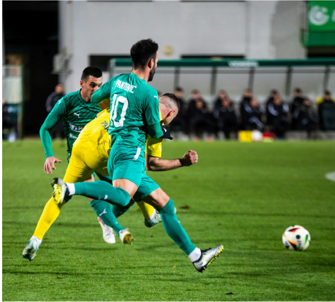
Ezúttal a BVSC nyerte a versenyfutást