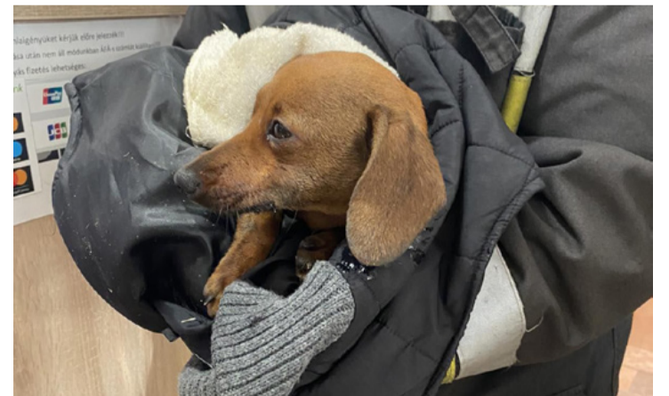
Az egyik megmentett kutyus biztos kezekben

Veszprém Vármegyei Katasztrófavédelmi Igazgatóság ■