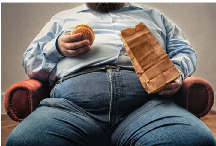
Kétszázötvenezer súlyosan kövér ember él Magyarországon