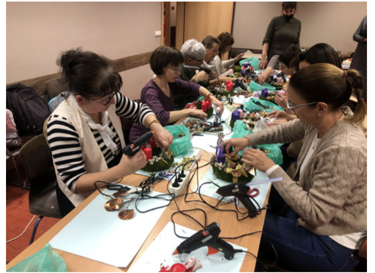
Az alkotómunka a lelki felkészülést is szolgálja