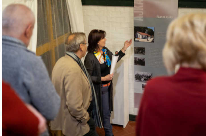
A kreativitást bemutató tárlat sokak tetszését elnyerte