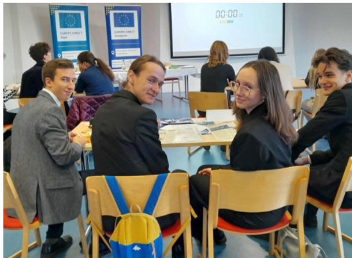
Magabiztos mosoly a kamerának még a verseny előtt

■ Magyarország Európai Unióhoz való csatlakozásának 20. évfordulója alkalmából a középiskolások részére meghirdetett „4 for Europe” címmel európai uniós vetélkedő regionális döntőjét múlt csütörtökön rendezték Veszprémben. Itt a tíz legjobb között versenyeztek a bródyok.