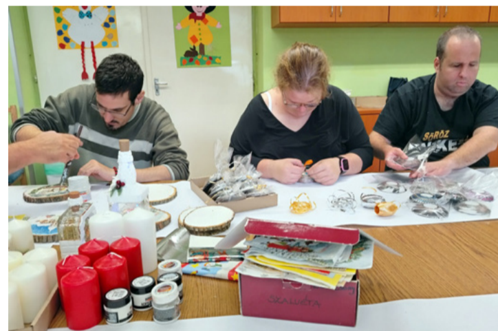
Készülnek az ajándékok a nyílt napra

A munkatársak folyamatosan új dolgokat találnak ki, hogy színesítsék a kínálatot, és az új dolgok tanulása által a foglalkoztatottakat is fejlődés-