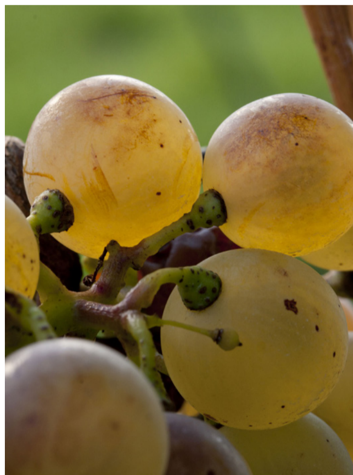
Szőlőszemekbe zárt napfény – egy Tihanyi György fotó a könyv 54. oldaláról