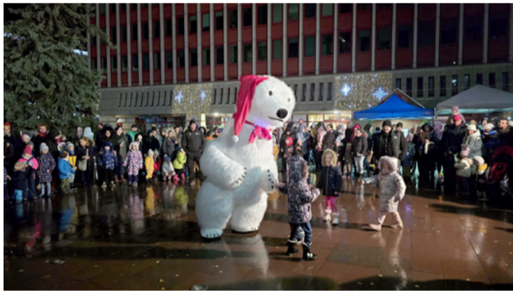
Nagy sikere volt a meglepetésmacinak