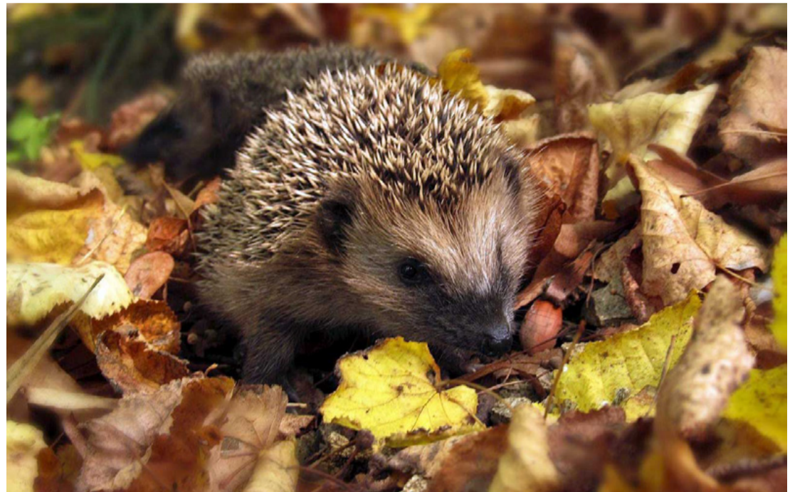
A sünök előszeretettel keresnek téli alvóhelyet az avarban