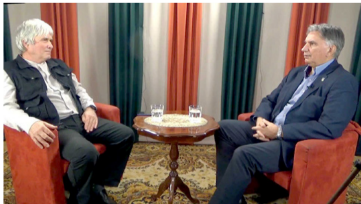
Beszélgetés a stúdióban. Jobbra a DK választókerületi elnöke

■ Felbolydult a hazai politikai élet, egyesek szerint újra van tétje a vitáknak és fontos, ki mennyire népszerű. A DK egyelőre „létárvól” keresi a helyét a politikai palettán, csakúgy, mint a Mi Hazánk Mozgalom. A kisebb pártok tovább erodálódnak, nagy rá az esély, hogy nem nagyon rúgnak majd labdába a szűk másfél év múlva esedékes országgyűlési választásokon. Persze, ki tudja, „soha nem mondd, hogy soha.”