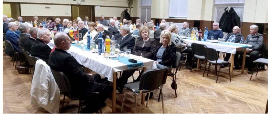
Az est résztvevői