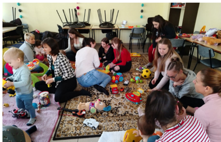
Jót játszanak, örül kicsi és nagy