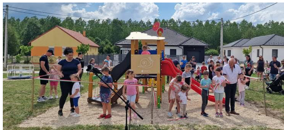
A játszótér átadása nagy esemény volt a városrész életében

Programjainkról és rendezvényeinkről összesen 18 db videót készítettünk. A verseny