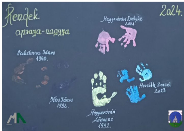
Ez a kép önmagáért beszél

Az ajkarendeki városrész mindennapokban is aktív csapata – kik évekkkel ezelőtt alakították meg az Ajkarendekért Egyesületet, mely azóta is példa értékűen működik – nagy örömmel értesült Ajka újabb „verseny” kiírásáról. A Modern Ajka programsorozat azonnal kreatív gondolkodásra készítetett mindenkit, fiatal és időst, hiszen a korábbi verseny programelemei máig emlékeztetéseket a településrész közösségében (például a 600 méteres kötött sál).