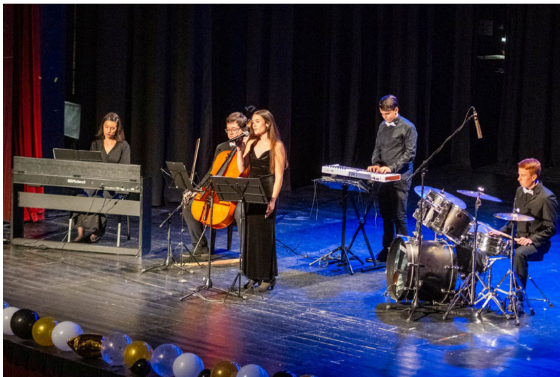
A Bánki zenekara a gálán