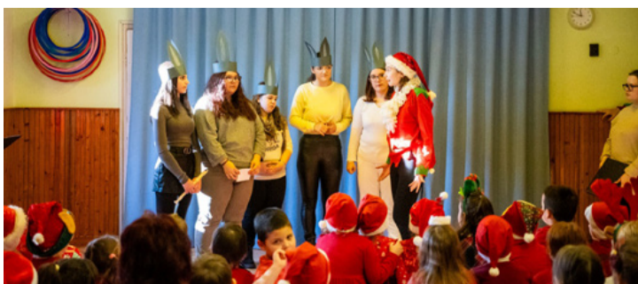
A Szent-györgyisek elmaradhatatlan előadása nagy sikert aratott ezúttal is

Mónika igazgatóhelyettestől megtudtuk, hogy az adventi időszakban várakozással, ünnepi hangulatban készülnek a karácsonyra. Az idén december 10-ig adventi vásárt szerveztek az intézményben, a dolgozók és a szülők által készített szebb ajándéktárgyakból. A befolyt összegből karácsonyra vásárolnak fejlesztő játékokat a csoportoknak. (ta) ■