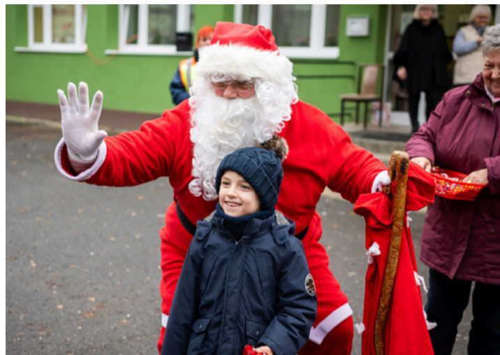
Örök emlék marad