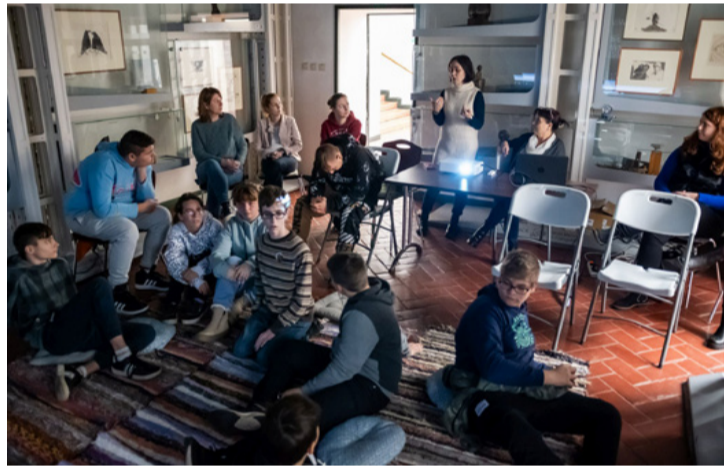
Foglalkozás a múzeumban