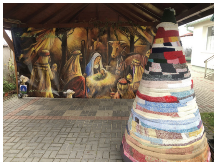
Egy igazi rendeki különlegesség: a szállal díszített karácsonyfa

■ Az adventi időszak egyik legszebb eseménye a Mikulásvárás, amelyet idén is nagy szeretettel szervezett meg az Ajkarendekért Egyesület december 5-én a Regenbogen Német Nemzetiségi Kultúrházban. Az udvarünnepi díszben fogadta az érkezőket. A közösség büszkesége, a „sál karácsonyfa” már teljes pompájában állt a tér közepén, mellette pedig a kifeszített betlehemi jászol idézte fel az ismert karácsonyi jelenetet. De az igazi meglepetés bent várta a résztvevőket.