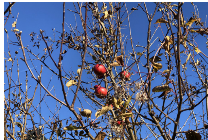
Almafán hagyott termés az erre járó madaraknak

És ha már a kert lassan elcsendesedik, ne feledkezzünk meg a madarokról sem! Ahogy a fagyos reggelek beköszöntenek, a madáretetők kihelyezése elengedhetetlen. Nemcsak segíthetünk nekik túlélni a telet, de közben egy egész télen át tartó, vidám természetfilm foroghat a saját ablakunk előtt! A gyerekekkel és unokákkal izgalmas kaland figyelni, ahogy a madarak csapatokban érkeznek az etetőhöz. A szemtelen verebek