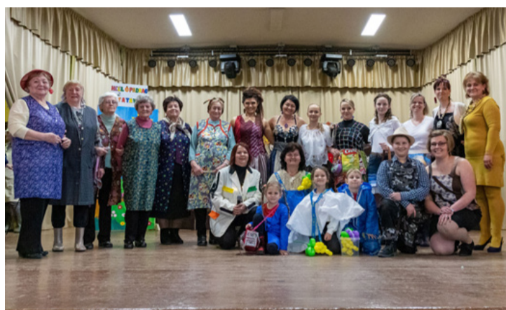
A divatbemutató résztvevői Csékútról, Csikólegelőről, Padragkútról és Tósokberéndről

■ Kicsit megkésve, de annál nagyobb lelkesedéssel kezdtük meg munkánkat 2023 augusztusában a Modern Ajka programsorozatban. Már az alakuló összejövetel is örömmel töltött el minket, hiszen a hívó szóra közel 30 ember érkezett a Községi Házba, hogy valamilyen formában részt vállaljon a programok megvalósításában. Az úgynevezett kemény mag 8-10 főből állt, akik ma is tovább tevékenykednek AlkoTósok néven.