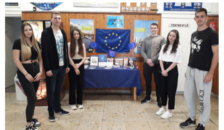
Az új Európa Pont

A tanulók a tanulmányaik alatt is használhatják az eszközt, hogy profiljukban projektjeiket, eredményeiket és teljesítményei-