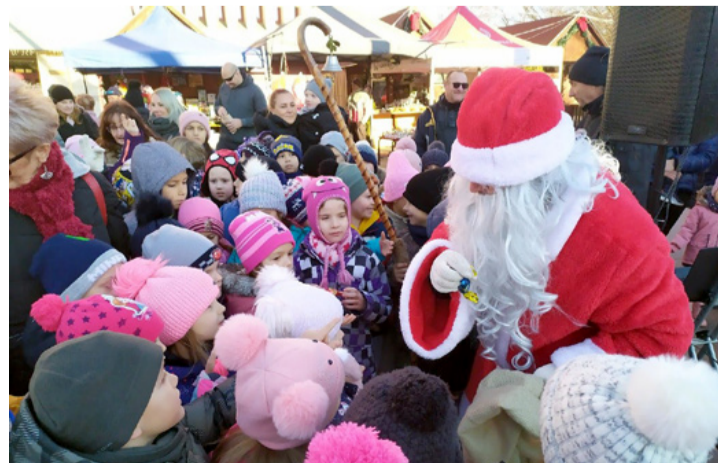
A gyerkőcök szinte megostromolták a Mikulást

A téren a Ramazúri Játéktér és a várost járó karácsonyi kisvonat tette még színesebbé a délutánt. F. P. T. ■