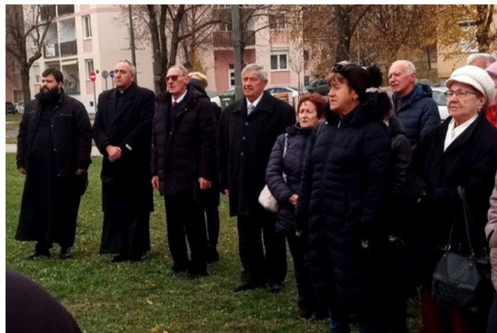
A megemlékezők egy csoportja

– Ma, amikor tiszteletünk jeléül koszorút helyezünk el a 20 éve itt álló Borbála-szobornál, az a remény éltem bennünket, hogy az utókor nem felejtje el a bányászokat akkor sem, ha a bányatelepeket felszámolják. A Borbála kultusz, a bányásznapi ünnepek életben tartják ezt a szakmát.