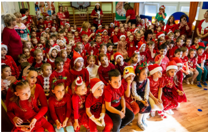
Ritkán látni ennyi kis Mikulást egy helyen

■ Vidám Mikulásváró színdarabbal lepték meg a Vizikék óvodásokat a Veszprémi Szakképzési Centrum Szent-Györgyi Albert Technikum és Kollégium diákjai december 5-én.