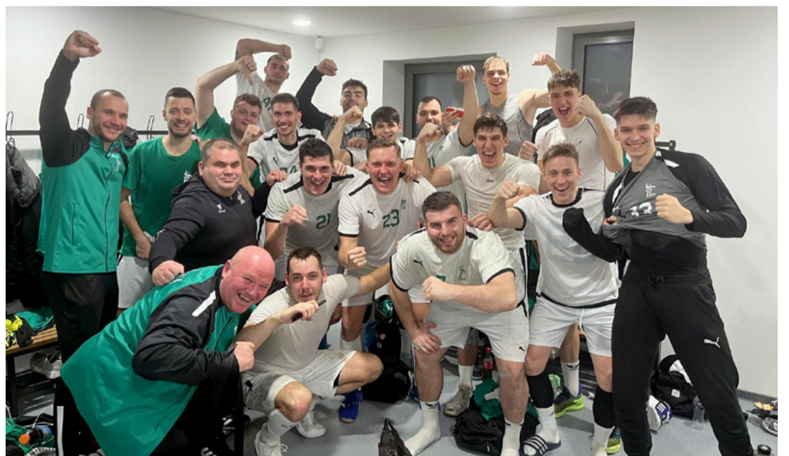
Önbizalomból nincs hiány, előbb-utóbb az eredmények is megjönnek