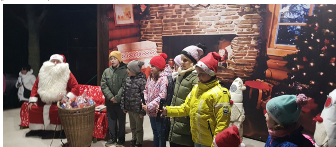
A gyepesi gyerekek énekükkel álomba ringatták a Mikulást