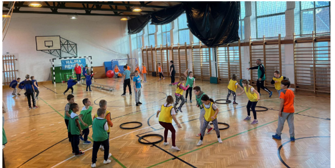
Edzés az ajkarendeki csarnokban