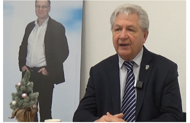
Az interjú a Fidesz ajkai irodájában készült

Azt elismeri ugyan, hogy az adóemeléssel az elvonásoknak