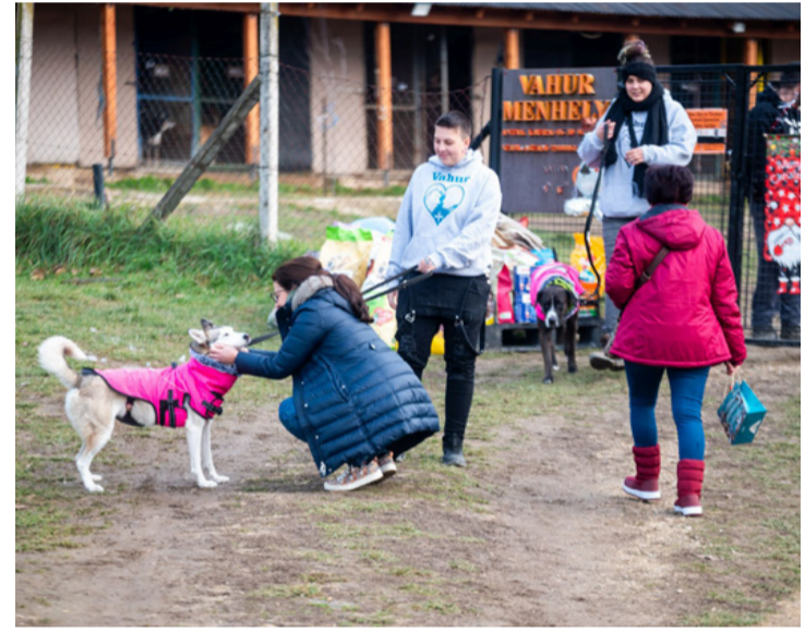
Talán egy nagy egymásra találás?