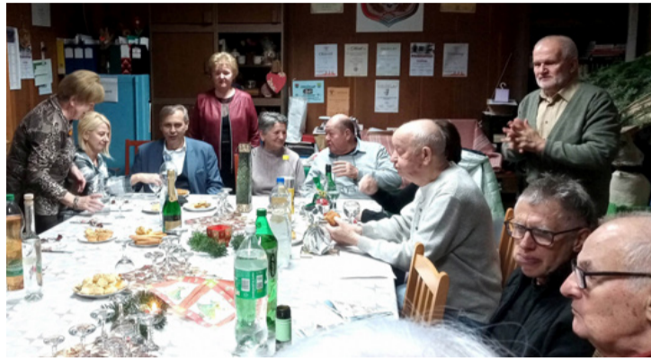
Kötetlenül, fehér asztal mellett a társaság