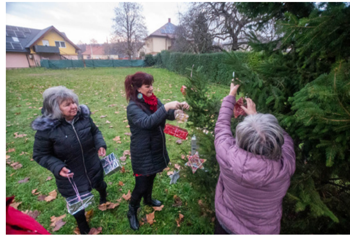
A csikódombiai egy élő fát díszítettek fel a nagy ünnepre

Ha fát vásárolunk mindig nézzük meg a frissességét. Dörzsöljük meg a tűleveleket vagy hajlítsunk meg egy ágat. Ha a tűk szárazak és törnek, a fa nem friss. Ha az