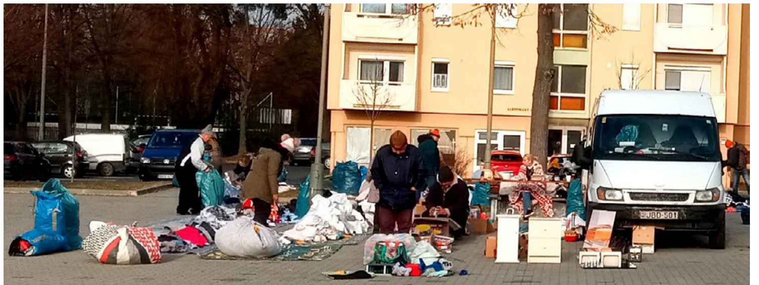
A jó idő előcsalogatja a piacozni vágyókat