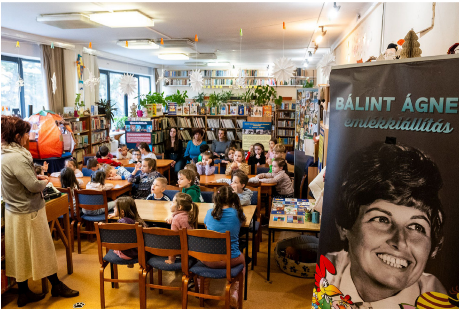
A kicsik néha tátott szájjal hallgatták a nagy mesemondó történetét