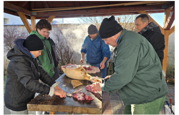
A fotó tanúsága szerint lesz utánpótlás