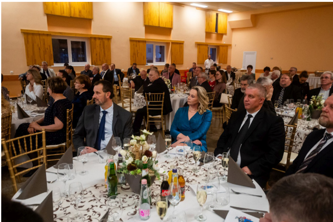
Az évindító közönsége a Kampusz kultúrtermében

Óév értékelő és újév köszöntő rendezvényt tartott a város