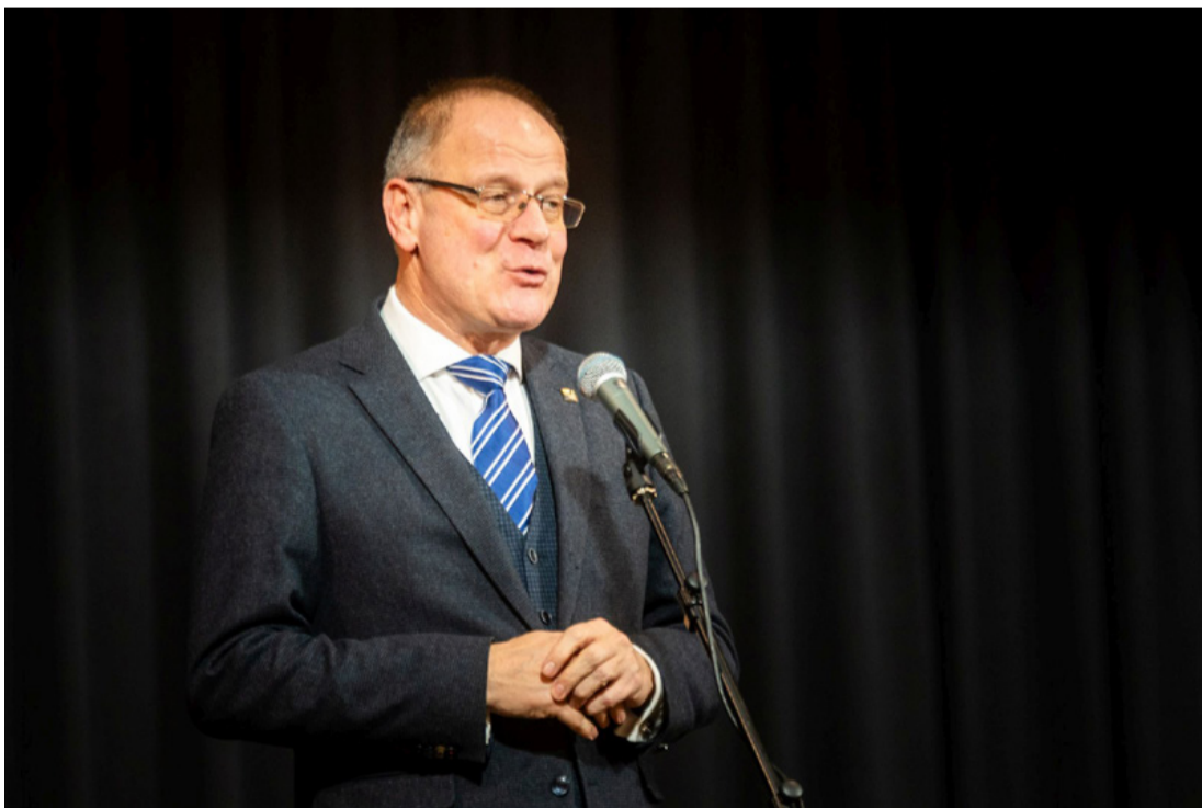
A miniszter bízik abban, hogy tavasszal már látványos szakaszához érkezik a Torna patak medrének rekonstrukciója

■ Az önkormányzat, illetve a polgármester évértékelője előtt Navracsics Tibor közigazgatási és területfejlesztési minisztertől, Veszprém vármegye 3. számú országgyűlési választókerületének Fidesz-KDNP-s képviselőjétől kértünk interjút az Ajka Kampuszon. A beszélgetés az Ajkai Média online felületein látható.