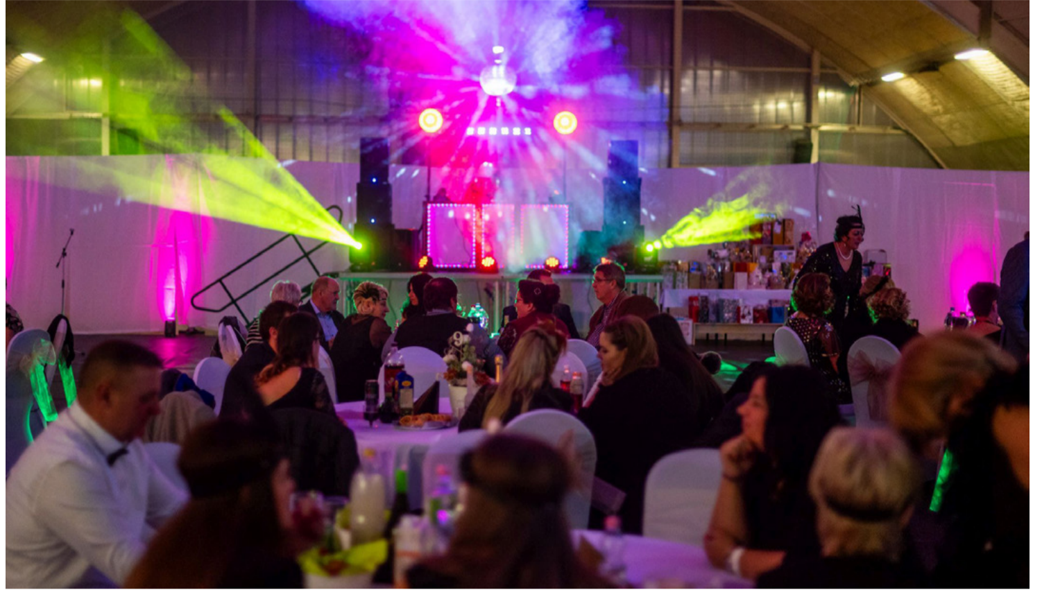
Jótekonysági bál a sportcsarnokban