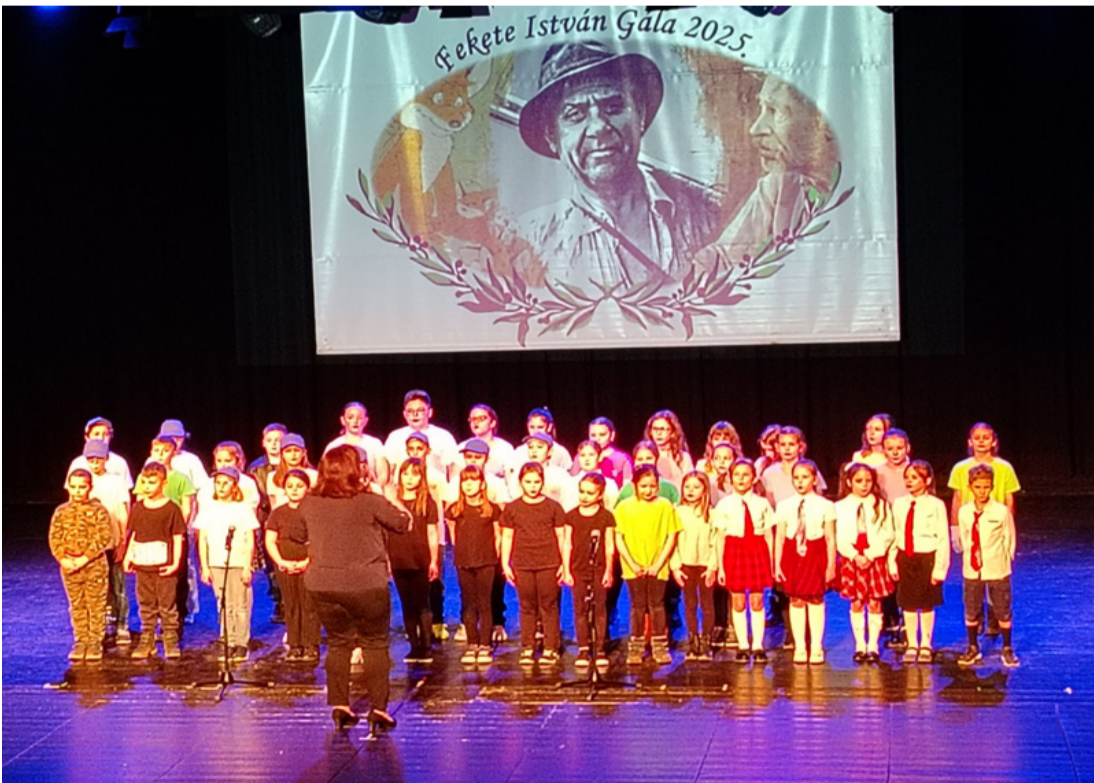
A kiskórus az iskolai életről énekel