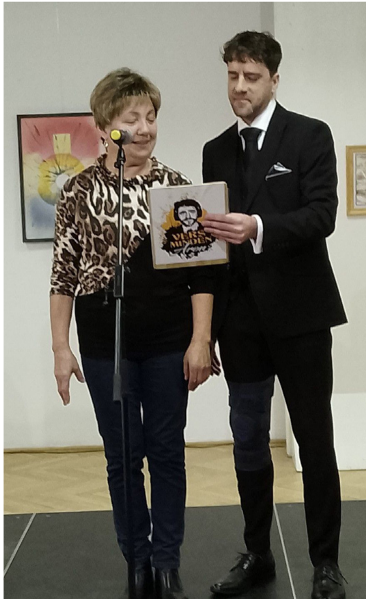
A közönség soraiból „Kornélia” vállalkozott a Sövegjártó Áronnal való közös verselemzésre

■ Kölcsey Ferenc 202 évvel ezelőtt, január 22-én jejezte, fejezte be a magyar Himnusz sorait. Ezért ez a nap mindenütt, ahol magyarok élnek, a magyar kultúra napja. Városunkban kiállítás megnyitával együtt tartották az ünnepi megemlékezést.