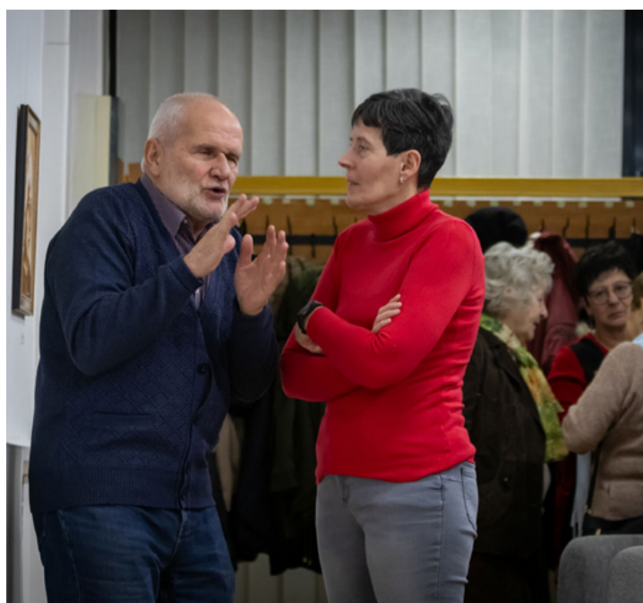
Tartalmas beszélgetésekre is alkalmat adott az est