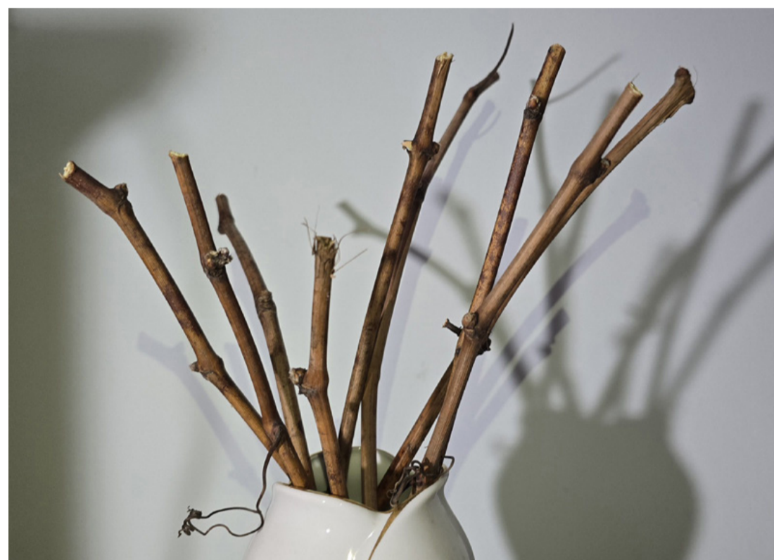
Fakad? Nem fakad? Erős lesz...? Izgatottan várjuk