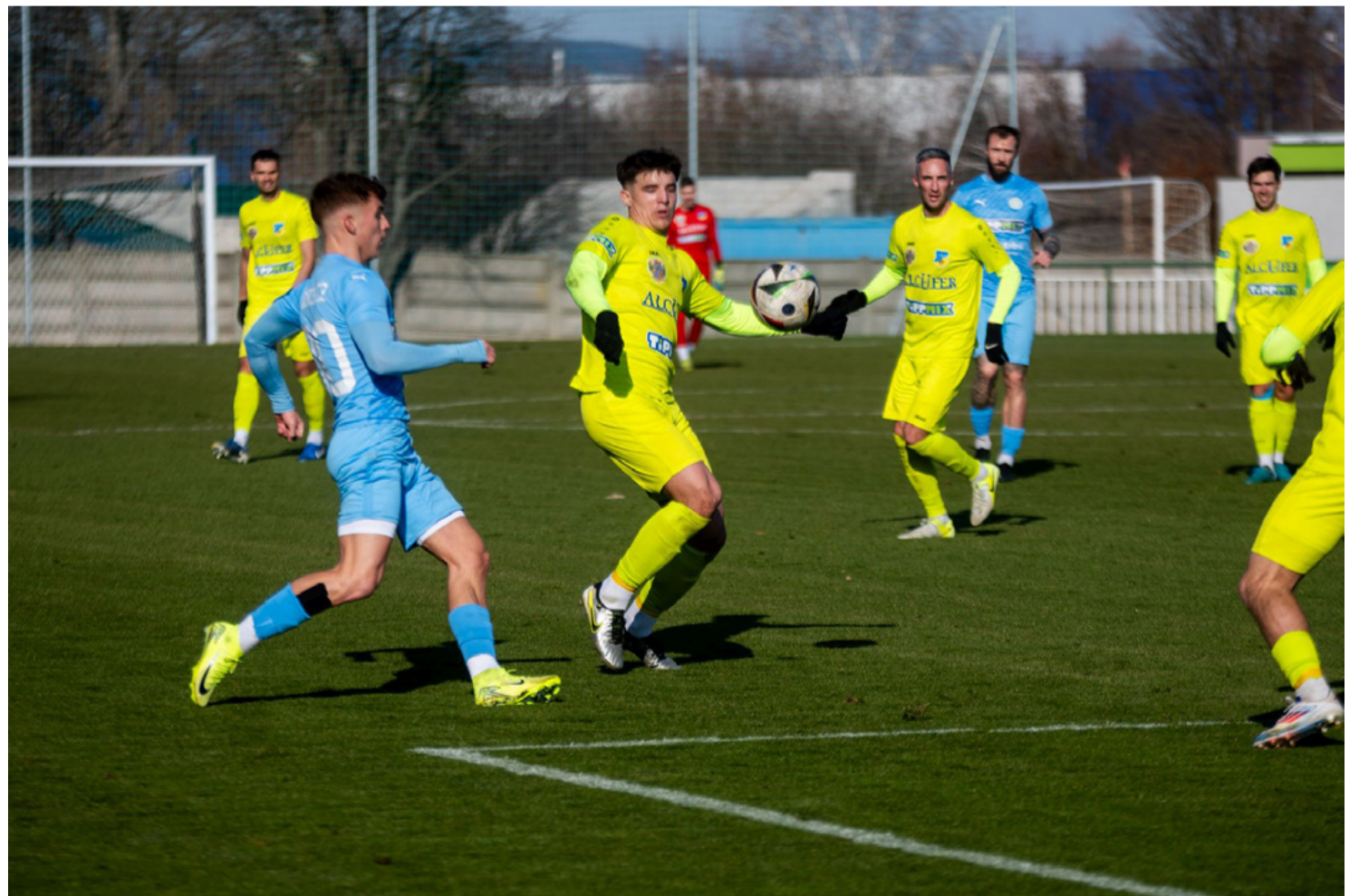
A zöldek a hidegben átmentek kékbe