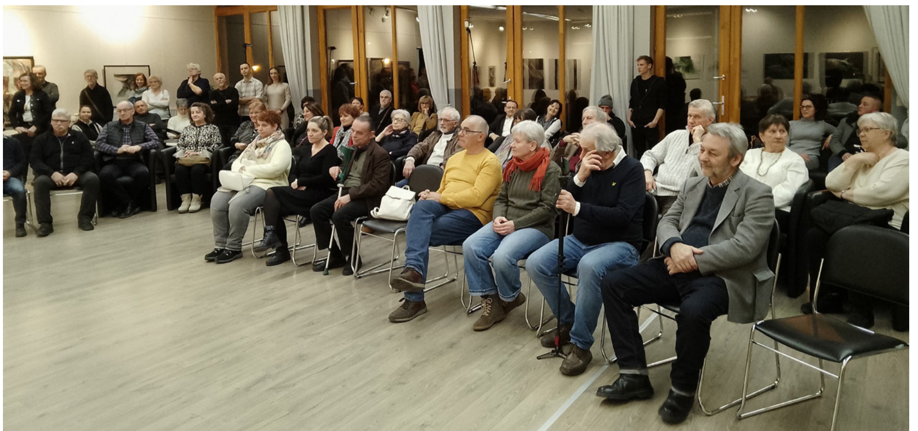
Megnyitó az Erzsébet ligeti kiállítóteremben