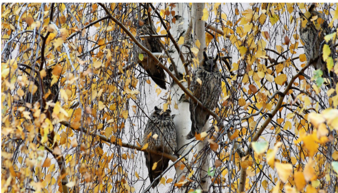
A fülesbagoly gyakori vendégek Ajka belvárosában is