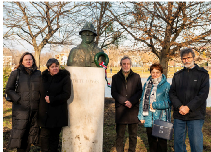
Fekete István tisztelői az író büsztyénél a Csónakázó tó szigetén

■ A Csónakázó-tó szigetén emlékezett Fekete István író születésének 125. évfordulójára a Fekete István Irodalmi Társaság január 25-én. Horváth Tibor elnök köszöntőjében Fekete István írói és emberi nagyságát is méltatta.