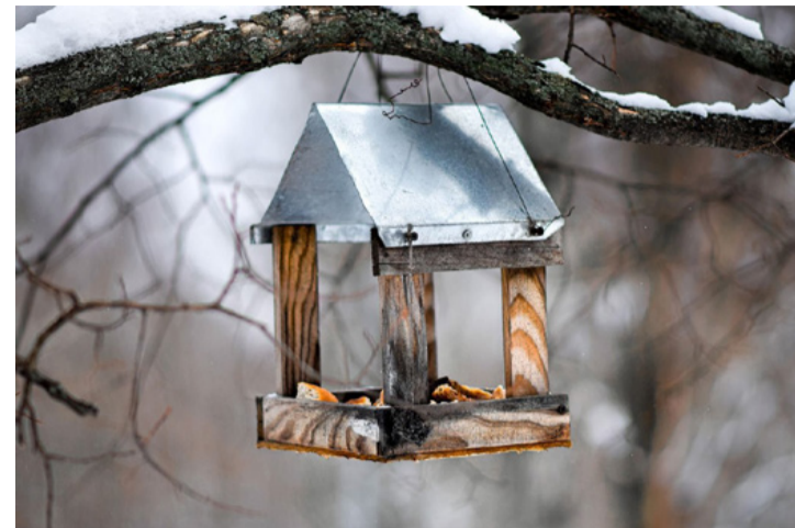
Ha szakszerűen helyezzük ki, valóban madáretető lesz és nem „macskaetető”

Az MME megfigyelései szerint a klímaváltozás miatt a Kárpát-medencébe érkező madarak vándorlási mintázata is átalakult: a késő őszi és téli időszakban csökkent a jelenlétük, mivel északabbra is elegendő táplálék áll rendelkezésükre. Az inváziós fajok mozgása szintén kiszámíthatatlanabbá vált, ami tovább mérsékli a megszokott madár-