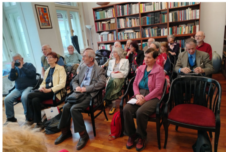
A MÚOSZ szakújságírói