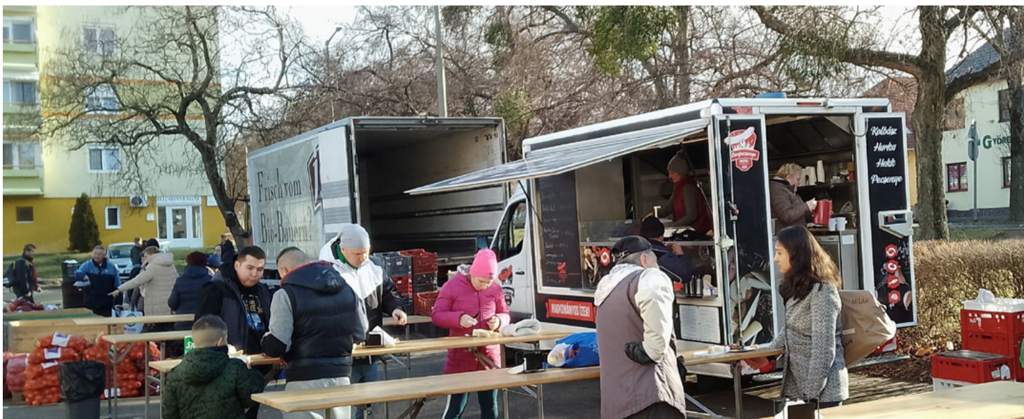
Gyér volt a forgalom a pecsenyesűtnél