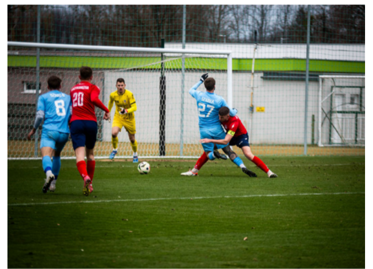
Ezúttal a gól nélküli játékot gyakorolták