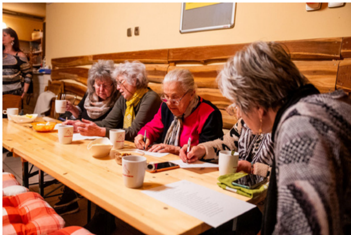
Mindenki jó ismerője volt Fekete István életművének

■ Kvíz kitöltésével és előadással emlékezett meg a városrészhez is kötődő, országosan ismert író, Fekete István születésének 125. évfordulójáról a Csikólegelőért Egyesület január 30-án.