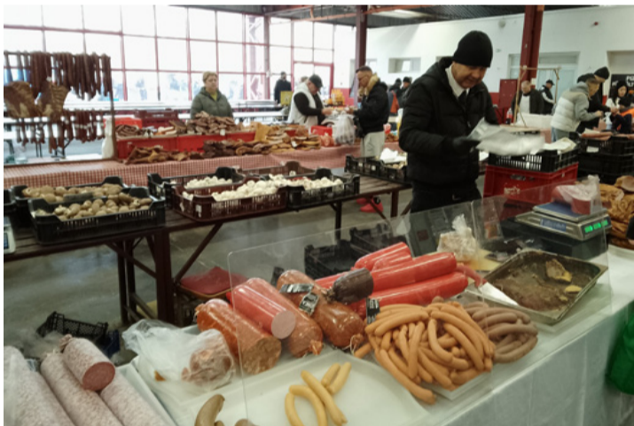
Hajnalban indult Sopronból

■ Február első piacnapján átlagos forgalom volt érzékelhető. A tér eléggé foghíjas volt, megjelent viszont a három zöldség-gyümölcs viszonteladó nagy kínálattal.