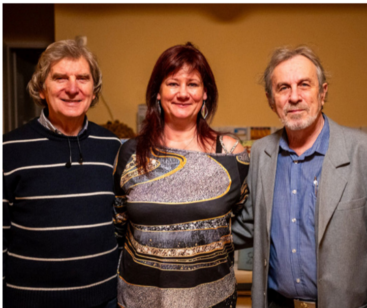
A vetélkedőt szervező „triumvirátus”