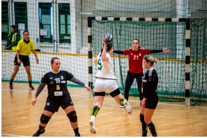
Sajnos a végére elfogyott a lendület