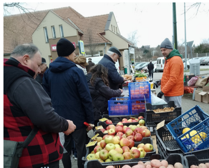
Alma, burgonya minden mennyiségben

kilója. Elmondták, hogy ők helyi gazdától vásárolják az „alapanyagot”, amit feldolgoznak. Elmondása szerint nemrég kezdte a piacozást az a padragi hölgy, aki házi kedvenceknek ajánlott „nyúl fület”, csirkelábat, és egyéb ennilát és játékot. Téli márdáreleségből, cinkegolyóból kevés fogyott. Megszámlálha-