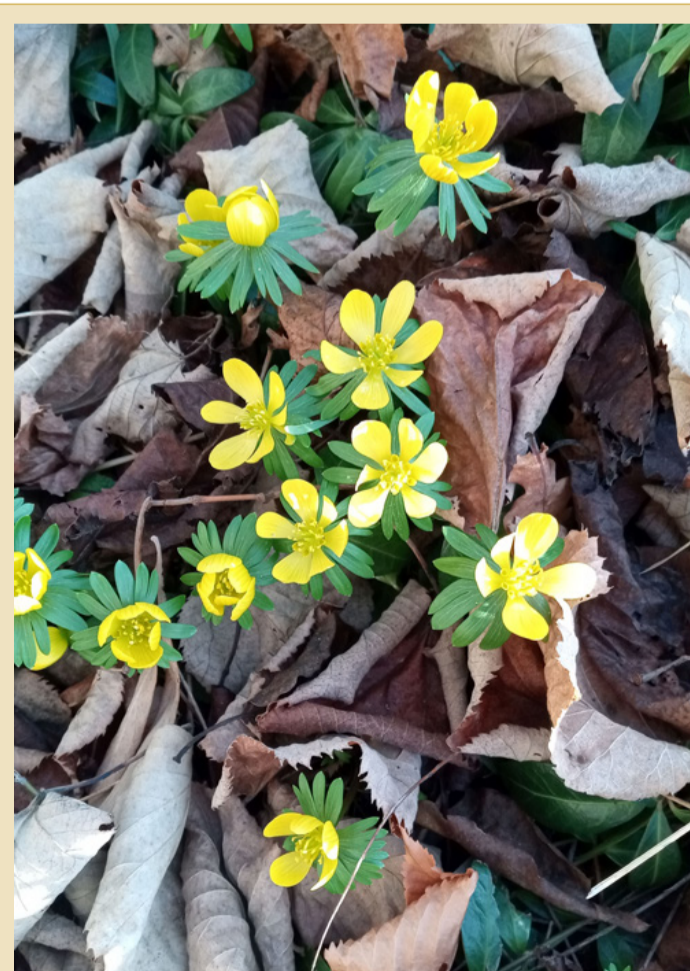
Országszerte virágzik a téltemető. Ez a példány Zalaszentgrót mellett bújt ki az avar alól.