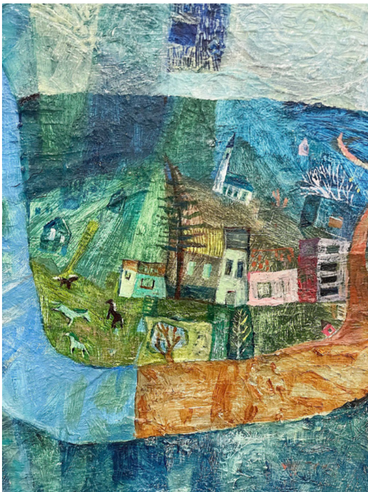
A Kissomlyó (40x30 cm, akril)