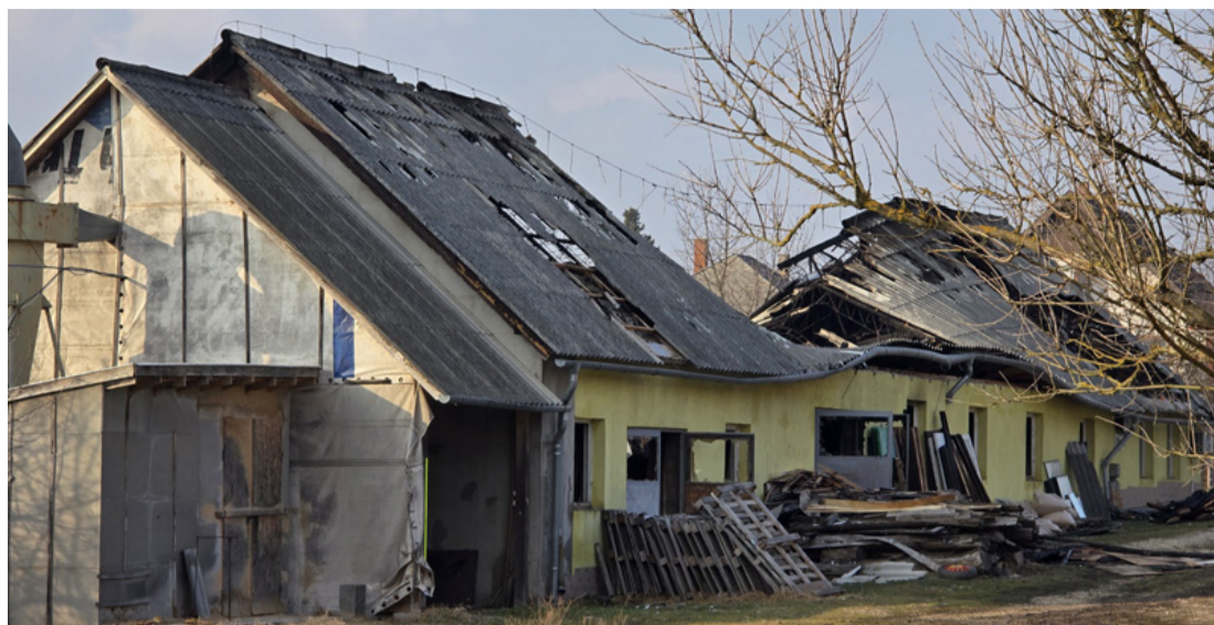
A műhely épülete a tüzoltás után