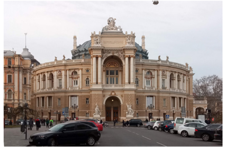
Az ogyesszai operaház, a város egyik jellegzetes, 1887-ben befejezett épülete, ami Helmer és Felner bécsi építészek tervei alapján jött létre

A tengerparti sétány elég lehangoló, mindenütt düledező, rozsdás öltözők, büfé épületek. Nehezen elképzelhető, hogy ezekből nyárra ragyogó strand lesz. Az utcákon óvatosan kell közlekedni, ahogy mondják: lefelé és felfelé is kell nézni! Lefelé a járdák rossz állapotára, a szemét és a kutyapiszok miatt (rengeteg a kutya),