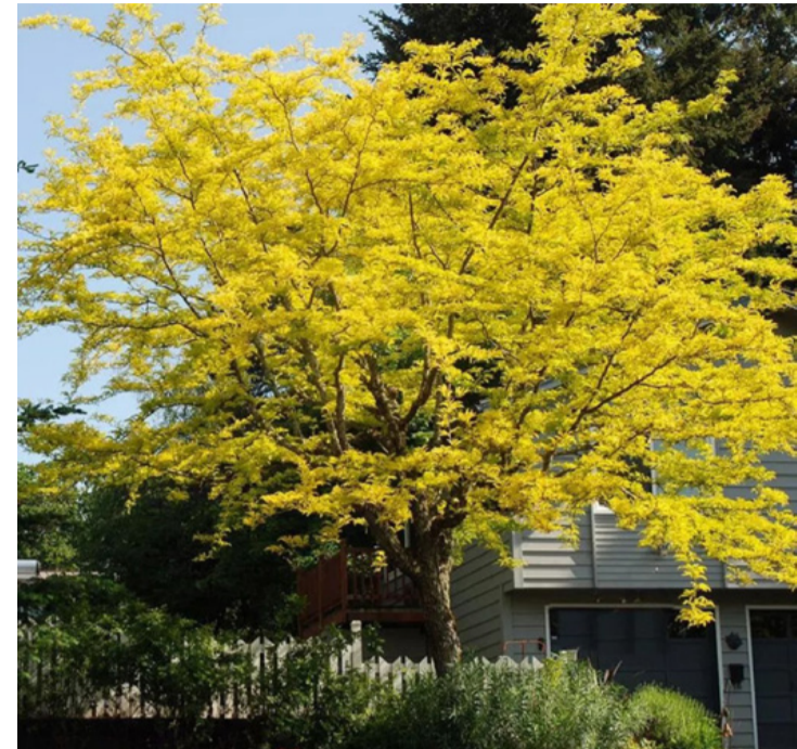
Hívják lepényfának is, valószínűleg ehető termése miatt

A gledícsia kiváló választás azok számára, akik gyorsan növő, egyszerűen nevelhető fát keresnek kertjükbe. Nemcsak szépségével és termésével hódít, hanem sokoldalúságával is. Nem igényel különleges gondozást, akár magról is vethető. Egy jól elhelyezett fa évente 1-1,5 métert is nőhet, és 8-10 éves korára már virágozik és terem.