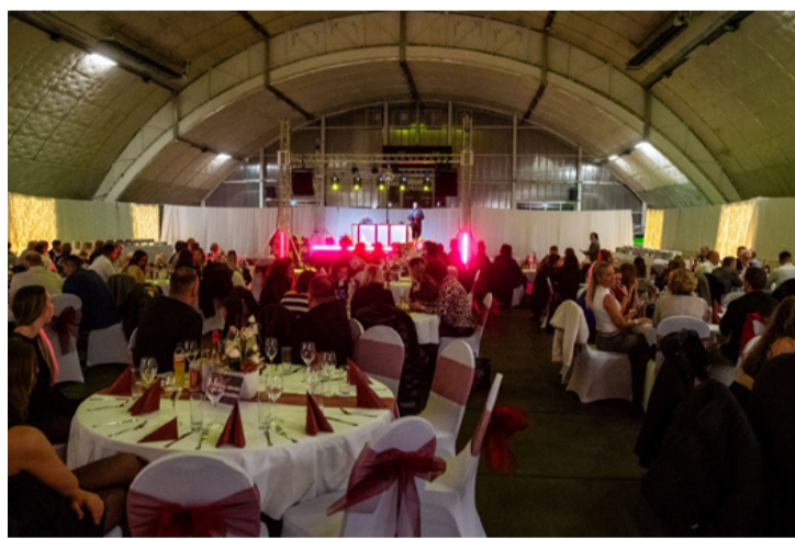
Megtelt a Sportcsarnok bálozókkal

A köszöntőt vacsora követően, majd tombolasorsolás és hajnalig tartó bál következett. (ta) ■