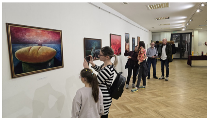
A metamorfózis új dimenzióba helyezi a képeket