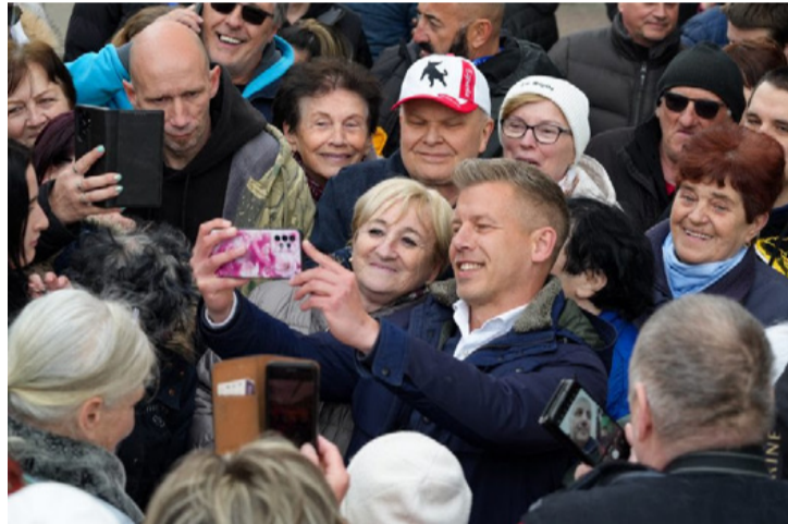
Magyar Péter a támogatói körében

Magyar Péter, a Tisza Párt elnöke és európai parlamenti képviselője országjárása keretében április 7-én, hétfőn Ajkára látogatott. A körút a Nemzet Hangja népszavazási kampány részeként zajlik, amelyben 13 kérdésben kéri ki a magyar emberek véleményét. A politikus célja, hogy a 19 napos kampány alatt ellátogasson az ország mind a 106 választókerületébe.