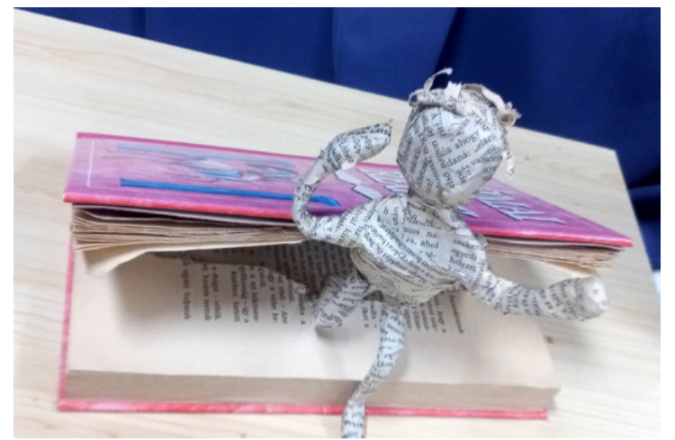
A könyv igazi jó barátunk lehet