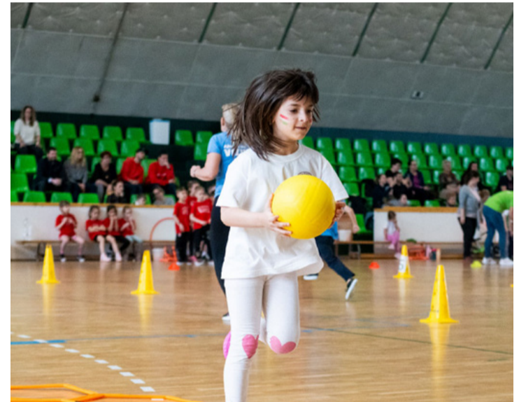
Se szeri se száma nem volt a mőkás feladatoknak

■ A Vízikék óvoda csapata lett a nyolcadik alkalommal megrendezett Oviolimpia bajnoka. A dobogó második fokára a Hétszínvirág versenyzői állhattak fel, harmadik lett a Patakparti intézményegység.