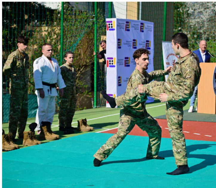
A kadétok küzdősport bemutatót tartottak az újonnan átadott pályán

Európa szerte egyedülálló rekortán borítású pályát avattak a Veszprémi Szakképzési Centrum Szent-Györgyi Albert Technikum és Kollégium a tornacsarnoka melletti téren április 3-án. A beruházás 140 millió forintba került.