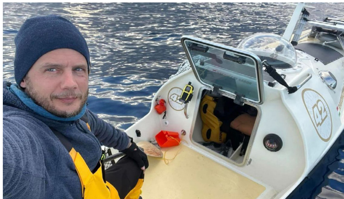
Rakonczay a 42-essel