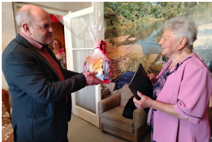
Az ajándékozás pillanata

Az ünnepelt Icafaluban született, Brassó mellett. Heten voltak testvérek. Felső Háromszéken nőtt fel. Négy testvére ma is Erdélyben él. Szülei a mezőgazdaságban dolgoztak. Ő maga mezőgazdasági technikusként tanult. Tíz évig Szatmárnémetiben dolgozott.