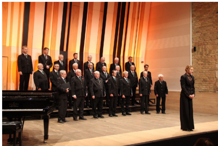
A Padragi Bányász Férfikórus a fesztivál színpadján, „aranyat érő” előadása után

Április 13-án nyitókoncert várta a résztvevő kórusokat, majd hétfőn és kedden következtek a kategóriaversenyek a Budapest Music Center kon-