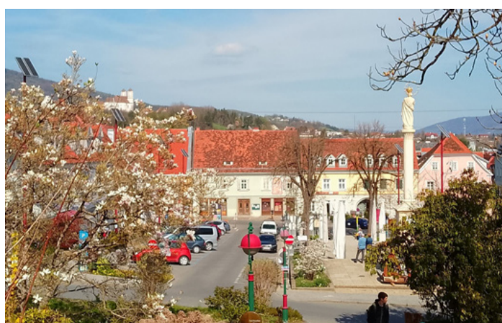
A főtérv tavaszi fényben, háttérben balra a kéttornyú dóm