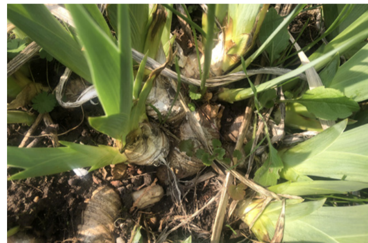
Túlszűfolt rizómák – a kertész beavatkozását igénylik

Ha néhány év után azt vesszük észre, hogy ugyan dúsan zöldell, de alig-alig virágzik, akkor itt az idő egy alapos szemrevételezésre. Első dolgunk, hogy megvizsgáljuk a rizómákat. Ha azt látjuk, hogy szorosan egymás hegyén-hátán nyomorognak, alig férnek el a földben, akkor meg is van a bűnös: a túlszűfoltosság. Ilyenkor a növények versengenek a helyért, tápanyagért, és a virágzás bizony háttérbe