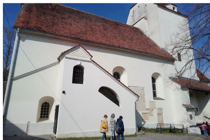
A Tabor-, vagy (Beckett) Szent Tamás XII. századi templom, falában római sírkövekkel