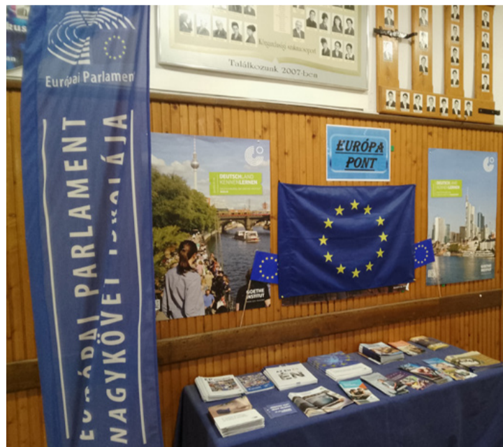
Az Európa pont a Bánkiban

Hozzátette, az intézmény célja, hogy a diákokkal megismertesse az uniós értékeket és működést, kiemelve a békét, együttműködést és a közös európai identitást. Az osztályok által feldíszített asztalok különböző európai országokat mutattak be, azok ételleivel,