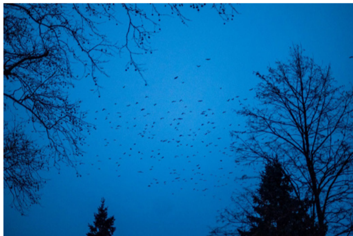
Néha elborítja az eget a varjak serege