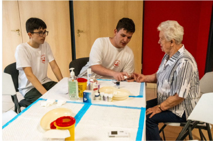
A Szent-Györgyi iskola diákjaira ismét számíthattak a szervezők

■ Szűrések, testtömegindex mérés, készségfejlesztő eszközök bemutatása, egészséges ételek kóstolója és három érdekes előadás várta a negyedik alkalommal megtartott egészségnap résztvevőit a Nagy László Városi Könyvtár és Művelődési Központban április 15-én. A szervező az Életet az Éveknek Ajkai Nyugdíjas Klubok Egyesülete és tagszervezete, az Egészségügyi Nyugdíjas Klub tagsága volt. A programon részt vettek a Veszprémi Szakképzési Centrum Szent-Györgyi Albert Technikum és Kollégium szociális ágazatban tanuló diákjai.