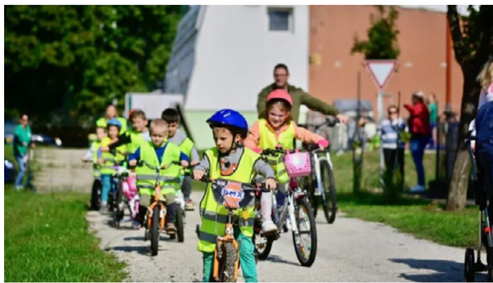
A kerékpárutak jelenleg is folyó bővítése a környezetbarát közlekedés feltétele – ezt már a „gyerek is tudja”

A fenntartható energia és klímaakcióterv három részből áll, a klímaváltozáshoz való alkalmazkodásból, a ká-