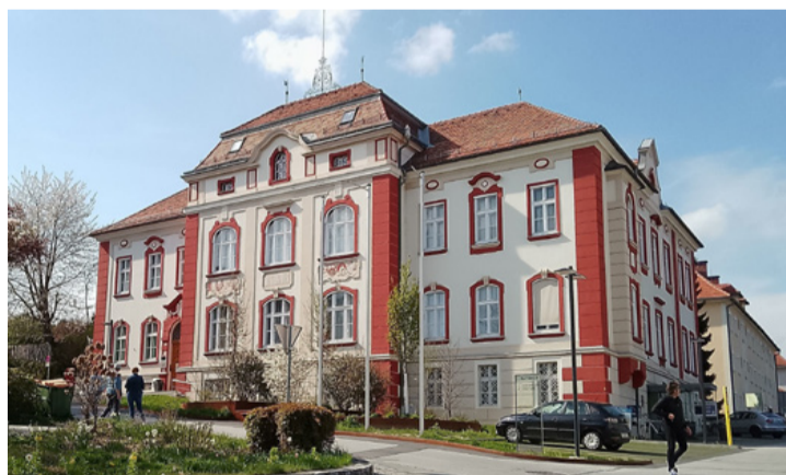
A városháza „kicsit régebbi”, mint a miénk

A Weiz városában álló Szent Tamás-templom (németül: Taborkirche) őrzi Szent Tamás, azaz Canterburyi Szent Tamás emlékét. Ez a román stílusú templom a város legrégebbi fennmaradt épülete, amelyet 1188-ban szenteltek fel Szent Tamás Beckett, Canterbury mártír érseke tiszteletére. Ma a Taborkirche nemcsak vallási szempontból fontos, hanem Weiz városának egyik legjelentősebb műemléke és jelképe is, amely a város címerében is megjelenik.