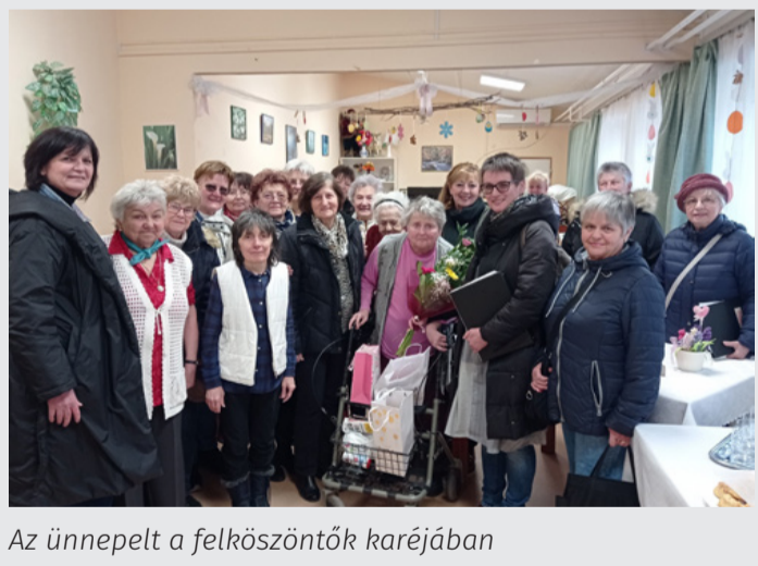
Az ünnepelt a felköszöntők karjában