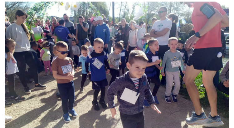
A kicsik nagyon elszántan vágta neki a távnak

A délelőtti folyamán a résztvevőket színes kísérőprogramok is várták: arcfestés, csillámtetoválás, kreatív kézműves foglalkozások, színe-