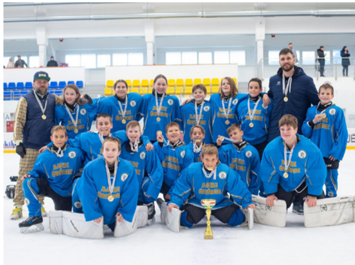
A Sárga Magyar Kupa kupát elnyerő U12 csapat játékosai

A klub büszke a sportolókra, köszöni az edzők munkáját, a szülőknek pedig a támogatást.