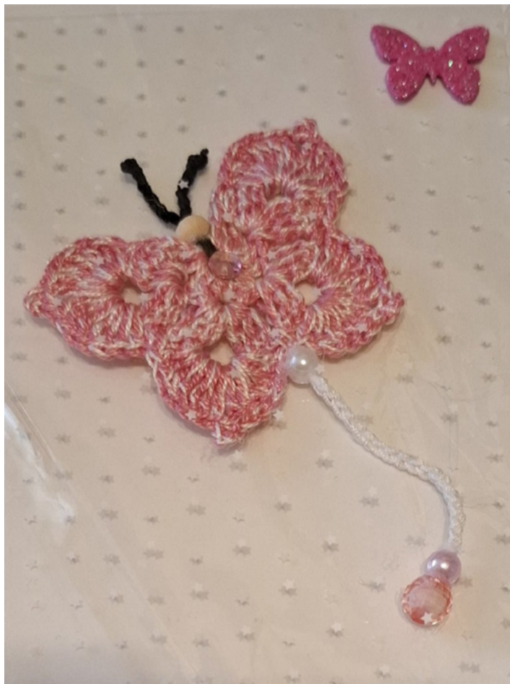
Igy nézett kia az idei „meglepke”