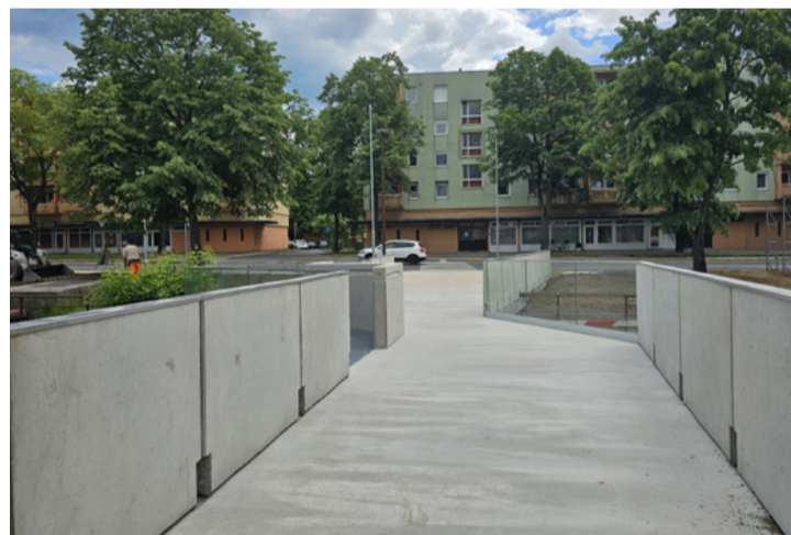
Uniós támogatásból épült az az érdekes vonalvezetésű gyalogoshíd is a Torna patak felett, a rendőrségi körforgalom szomszédságában