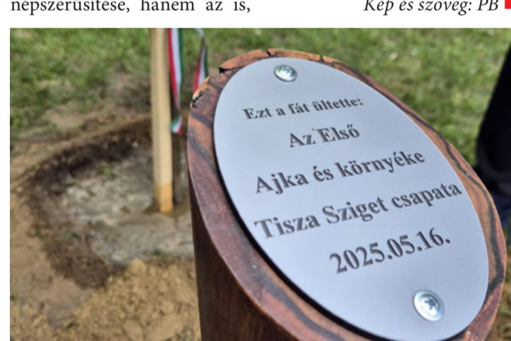
Az emléklapok egy faragott akácra helyezték el