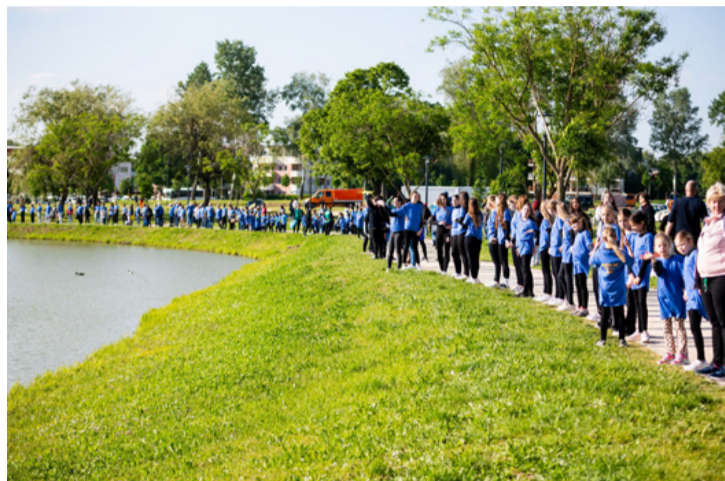
„Körbeértük” a tavat – a kör a teljesség és a tökéletesség jelképe is, mint a jeggyűrű

■ Felemelő közösségi élményben volt részük a városlakóknak május 9-én az Európa napon. Mintegy 800 lelkes résztvevő – civil szervezetek, nyugdíjas klubok, sportolók, családok összefogásával állták körbe a megújult Városligeti tavat. A nap a közös ünneplés mellett, a generációk közötti kapcsolódásról és a helyi közösség erejéről is szólt.