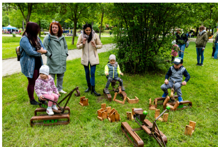
Játsszani csak környezettudatos, fenntartható módon érdemes