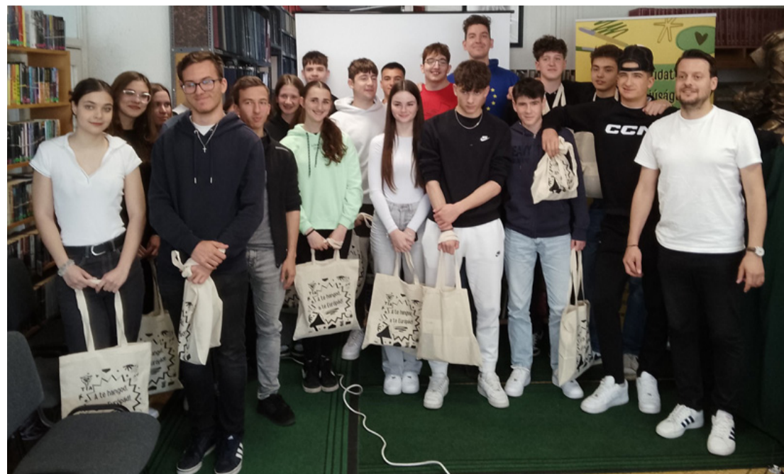
Az európaiság eszméjének elkötelezett hívei

A rendezvény után ismét megerősödött bennünk az a felismerés, hogy ilyen programokat szükséges lenne a felnőtt és nyugdíjas korosztálynak is szervezni! Talán jobban megértenék, hogy mi a valóságossága hazánk uniós tagságának? -yCs- ■