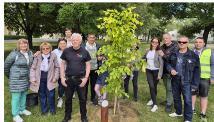
A sziget tagjai az elültetett hársfával

■ Május 16-án, pénteken egy fiatal hársfát ültettek el a Platán ABC mögötti parkban az Első Ajka és Környéke Tisza Sziget közösségének tagjai. A fáültetés nemcsak szimbolikus gesztus volt, hanem a helyi közösségépítés és környezettudatosság iránti elköteleződésük kézzelfogható jele is.