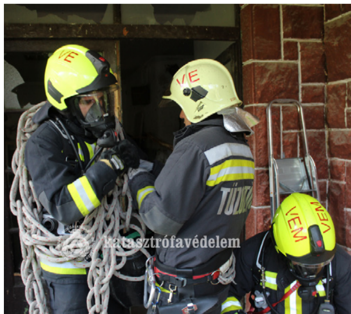
A jó felszerelés életmentő lehet