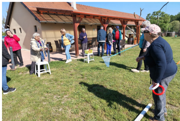
Vidám pillanatokban nem volt hiány a sportversenyen sem