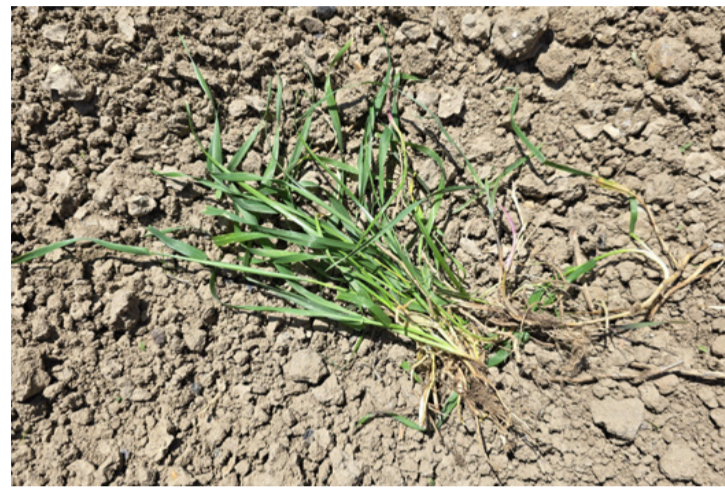
„Gondatlan” kapálással akár mi is hozzájárulhatunk az elterjedéséhez

Egy anyanövény körül számátalan új hajtás nő ki a földből, és így egyre nagyobb területet hálóz be. A kapálás után nemhogy megszűnne, hanem többszörös erővel térhet vissza. Nemcsak a terjedése aggasztó, hanem az is, hogy a tarackbúza komoly versenytársa minden más növényünknek. Vízszintesen haladó gyökerei szó szerint kiszívják a talajból a vizet és a tápanyagot, így elvonják azt a haszonnövényeinktől. Ráadásul a hegyes gyökerek még a föld alatti növényi részeket, például a burgonyát, sárgarépát is átszúrhatják, tönkre téve a termést. És ez még nem minden, nem elég, hogy ellepi a kertünket, még toxikus anyagokat is termel, amelyek akadályozzák más növények fejlődését. Gátolják a talajban a nitrogénfelvételt, így a körülötte