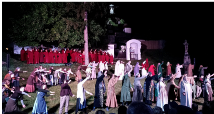
Egy jelenet a tavalyi előadásból

A Jézus szenvedéstörténetéről megemlékező passiójáték írója és rendezője dr. Várszegi Tibor , az irodalomtudományok doktora, zeneszerzője Szarka Gyula , Kossuth-díjas énekes, gitáros,