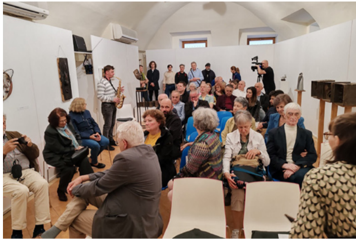
A fotó a kiállítás megnyitóján készült

A Magyarpolányi Nemzetközi Művésztelep egyedülálló művészeti központ Ajka szomszédságában, amely a kortárs szobrászat és közösségi alkotás jegyében épít hidat magyar és határon túli alkotók között. A kiállítás művészi