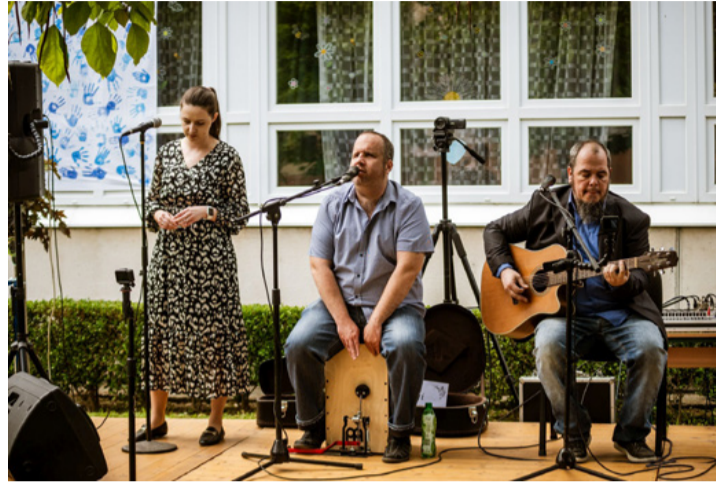
A Hangadók az iskolában folyó összetett munka eredményességének hírnökei