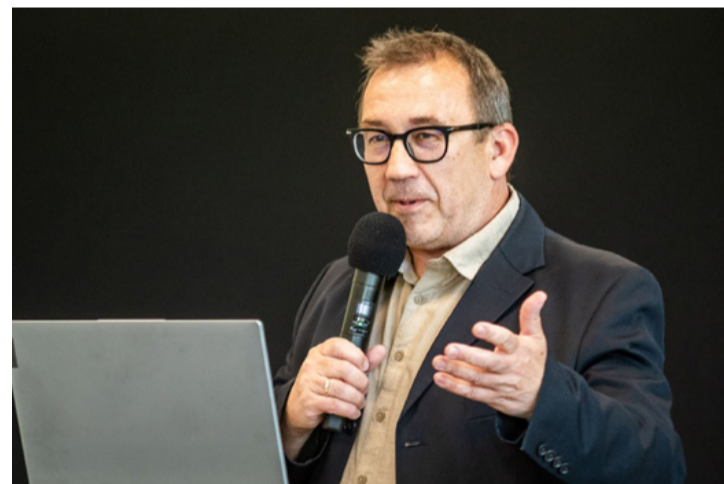
Pécsi Tibor szerint az okok a vallások harcában gyökereznek

Legfőképp a mai nemzedéknek kell ennek tudatában lennie, hiszen az idő múlásával, ahogy fogyatkoznak a túlélők, az emlékezés felelősségének terhe egyre jobban rájuk hárul. A zsidóság a magyar társadalom része, gyermekeinknek a felnövekvő nemzedéknek, a zsidóság történelmét, kultúráját, sajátos hitéletét meg kell ismerni, ezáltal megérteni, tisztelni és elfogadni.