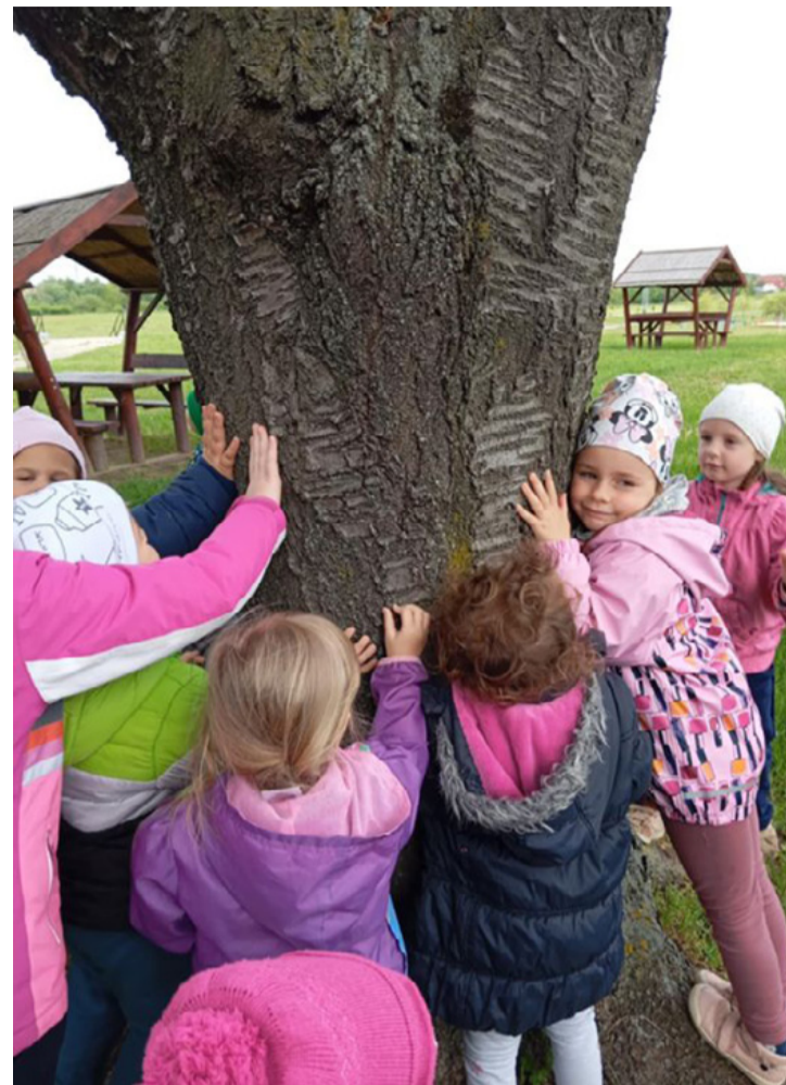
„A természet körülölel bennünket – mi pedig szeretettel öleljük vissza” – írta a képhez Cintia