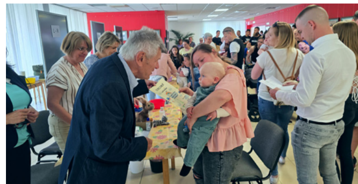
Bertalan még csak azt érzi, hogy szeretik. És ez így van jól

Kint a téren a programkínálat a nap folyamán minden korosztálynak tartogatott meglepetést. Volt rendőrségi bemutató, csil-