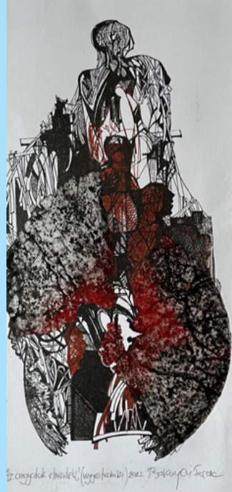
Az Angyalok elmentek (vegyes technika)