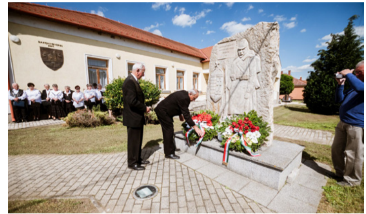
Az utókor nem feleli a hősokeket