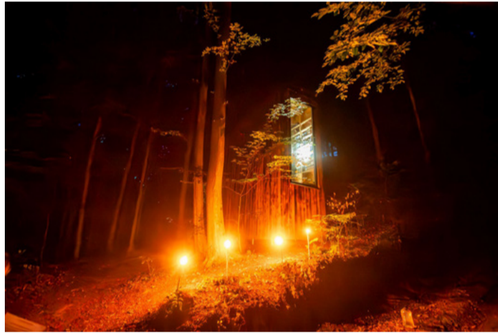
Az erdei olvasókabin. Éjszaka csak erős idegzetűeknek ajánlott

Négy helyszínen tucatnyi program várta a látogatókat a Múzeumok éjszakáján június 21-én. Az éjszakába nyúló programsorozat délután 3 órakor kezdődött a Kristály Múzeumban. A hatalmas érdeklődésből kiderült, az embereket érdekli az Ajka Kristály története. Nemcsak az egykori dolgozók és családtagjaik jöttek el, hanem fiatalok és a térségben lakók is.