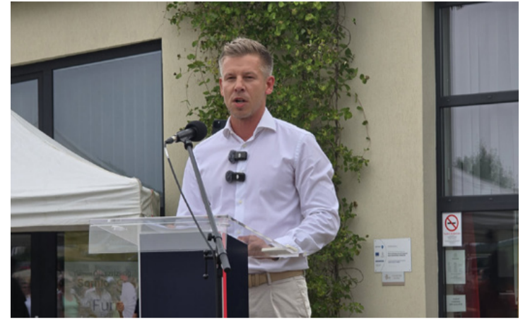
Magyar Péter a Somló lábánál

Somló és a magyar szabadságszeretet között: „A Somló hegy olyan, mint a magyarok szabadságvágya: alacsonynak tűnik és mégis uralja a tájat. Nem harsány, nem kérkedik, de minden irányból érezni a jelenlétét. A bazalt mélyén az egykori vulkán tüze szunnyad. Ahogy a magyar néplelekben is, a szabadság tüze nem alszik ki, csak néha csendben izzik tovább. Azért vagyunk ma itt, mert hisszük, hogy ez a tűz újra és újra lángra kaphat, és felmelegítheti a hazát igazsággal, méltósággal, reménnyel és emberséggel.”