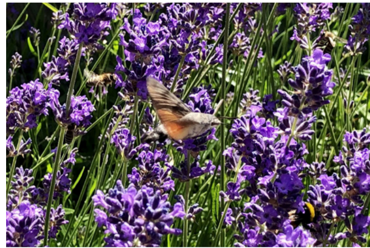
Levendulaerdőben „helikopterező” szender

Az ajkarendeki Regenbogen Német Nemzetiségi Óvoda előtti rész jó példa arra, hogy már néhány tő levendula is elég, hogy élettel teljen meg az útszél. Ezer és ezer méhecske, dongó zsongja körbe a virágokat, ahogy szorgosan gyűjtik a nektárt és a virágport, miközben a szirmok között lepkék sokasága táncol. Itt, ebben a zümmögő-pezső élővilágban találkozunk ezzel az apró kolibri szerű csodával a kacsafarkú szenderrel. Azzal a lepkevel, amelynek megjelenése egyetlen pillanat alatt felülír minden beton-logikát. Ez a különleges lepke első pillantásra tényleg úgy néz ki, mint egy kolibri. A levegőben lebegve szívoogatja a nektárt hosszú, pöndörödő nyelvvel, szárnyai szédítő sebességgel csapnak, miközben nem is érinti meg a virágot. A kacsafarkú szender (Macroglossum stellatarum) nappal aktív, gyors, ürge és szinte zümmögve repked. Aki egyszer látja az biztosan nem felejtje el. A levendula, petúnia és más illatos, tölcseres virág a kedvence. Ha ilyenek nyílnak a kertedben, jó eséllyel