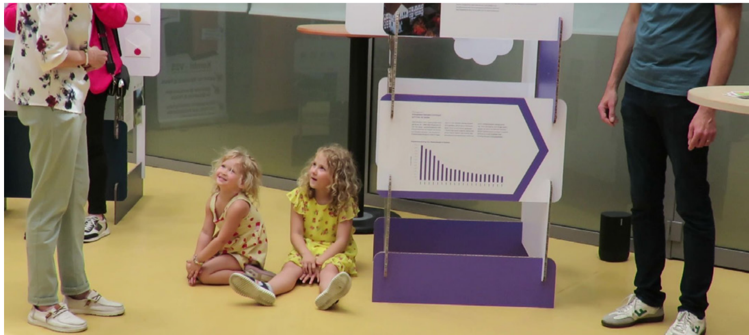
A bemutatón két pici lány segített átérezni, miért fontos a fenntartható fejlődés