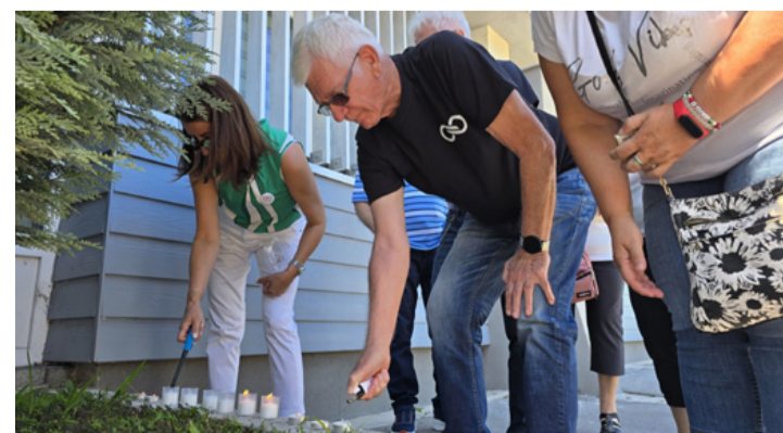
Mécsesgyújtással emlékeztek Ajkán a hódmezővásárhelyi rendőrkapitányra, aki szakmai becsületét védve önkéntesül vetett véget életének