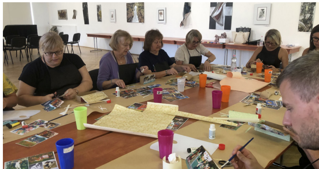
Megismerték egyes műalkotások történetét is