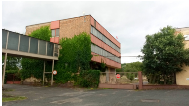
Két éve még így nézett ki a megmaradt épület

■ Az elmúlt hét elején ezt írtuk az online változatban: „Porfelhő az Ajka Kristály 'piros' irodaépületénél, amikor egy kis helikopter is leszállt mellette... Mi történt? Már eltűnt a hatalmas épület fél oldala, egy markoló tarczítja a törmeléket.”