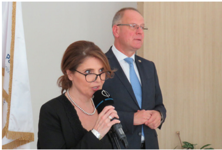
Elisso Bolkvadze és Navracsics Tibor a „doorstep” sajtótájékoztatón

Megtudhattuk még, hogy a jelenleg már kulturális miniszter asszony két évvel ezelőtt, akkor még Georgia parlamentjének képviselőjeként találkozott Navracsics Tiborral . Mivel Georgia és Magyarország stratégiai partnerek, most azt kéri, hogy a magyarok osszák meg az EKF projekt lebonyolítása során szerzett tapasztalataikat. Ezzel is szeretnénk hangsúlyozni, hogy Georgia Európához tartozik, így kultúrája is az európai kultúra szerves része. Tudják, hogy nagyon nehéz feladatról van szó, így idejekorán szeretnék elkezdni a felkészülést és ebben a magyar tapasztala-