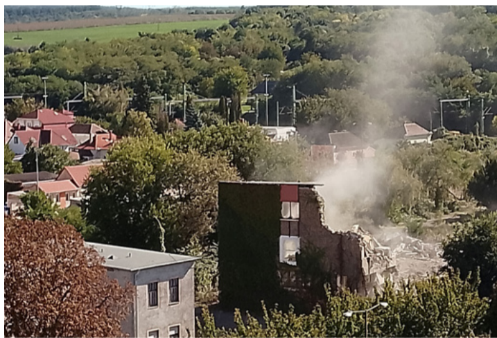
Már csak az emlékekben és a fotókon él