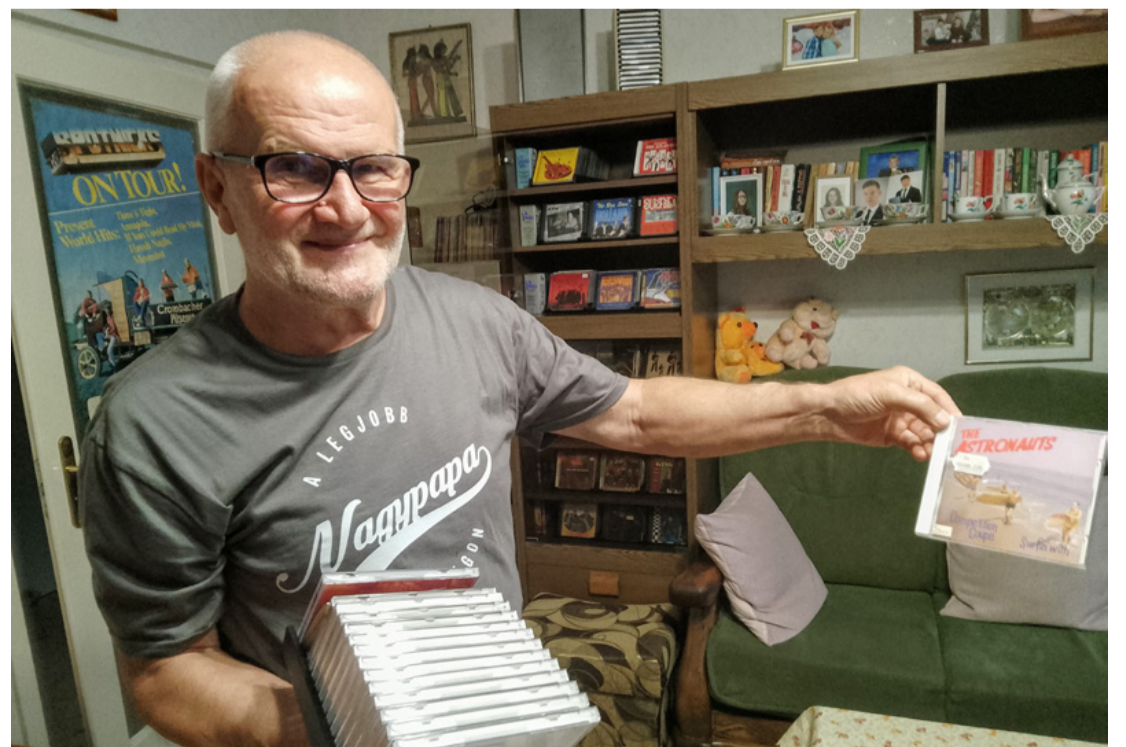
Messze földön egyedülálló gyűjtemény