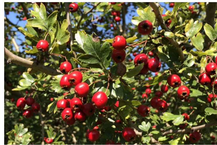
Már „izzik a galagonya ruhája”

A legtöbbet teaként használják, de régen, az inséges időkben, a termés lisztptólként is fontos szerepet játszott. A boggyókból készülhet lekvár, zselé vagy akár gyümölcsaját is. Igaz, a lekvárfőzésnél a befejtett munka nincs arányban a kinyert mennyiséggel, mégis megéri, hiszen különleges íze van, és a szív- és érrendszer támogatásában is segíthet.