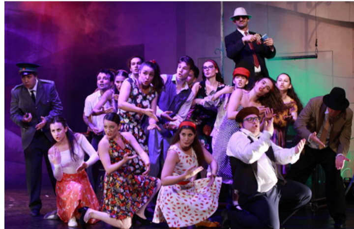
Szereplők a színház egyik sikerdarabjában, a Sose halunk meg-ben, egyben a 25. évad nyitó előadása

Ez az előadás is jelzi, hogy Újra elindul a Veszprémi Táncműhely. Veszprémi, illetve veszprémi kötődésű fiatalokkal élesztik újra a tánc