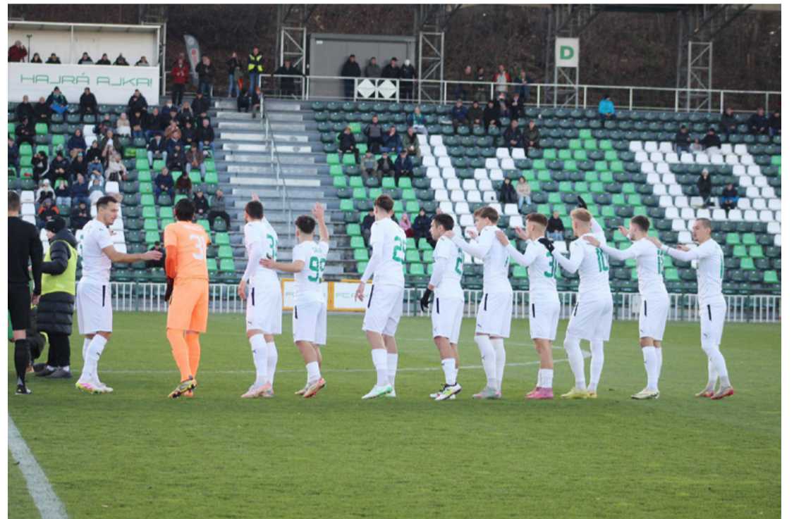
Jövőre talán ismét tele lesz majd a lelátó