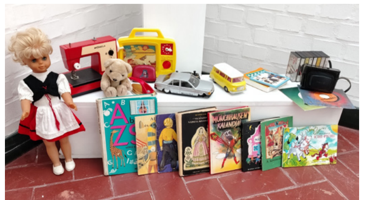
Évtizedekkel ezelőtt még elég volt ennyi a boldogsághoz