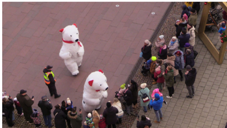
Az „oktatási négyes” zavartalanságáról a polgárok gondoskodtak