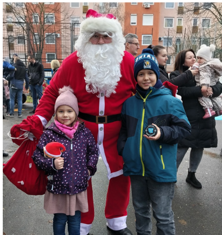
Az egyik mikulás két ajkai jó gyerekekkel

volt belőlük) elárulták, hogy nem vesződnek a virgáccsal, annyi a jó gyerek Ajkán, így mos is csak csokit osztogattak az apróságoknak.