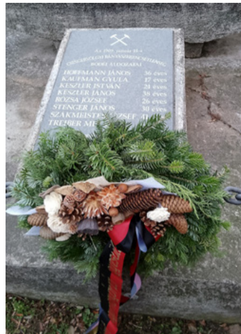
A bódéi áldozatok emléktáblája

hogy „a védőszenetek közül legismertebb Borbála, akinek tisztelete elterjedt egész Európában, a XV. században Selmecebányán már közsímt védőszent volt. Rajta kívül, vagy több bányavidéken vele együtt bányász védőszent volt Szt. Anna, Szűz Mária, Szt. Prokop, és nálunk a múlt század harmincas éveiben Szent István is.