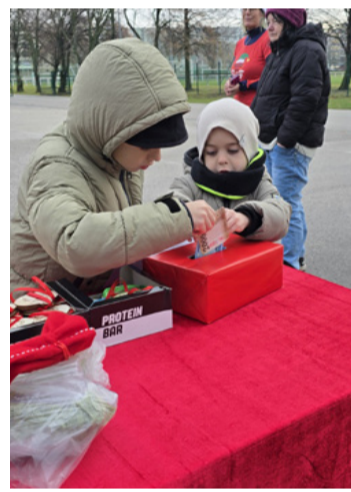
A legkisebbek is adakoztak

■ Idén tizenkettedik alkalommal lepték el a futó mikulások Ajka utcáit. A december 7-én megrendezett hagyományos közösségi esemény nemcsak a mozgás örömről szólt, hanem a segíteni akarásról is. A résztvevők idén az ajkai mentőket támogatták.