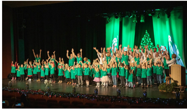
Zöldbe borult a VMK színpada

– A mai világunkban hajlamosak vagyunk elmenni abba az irányba, hogy a környezet, a tárgyi fontosabbak, mint a belső