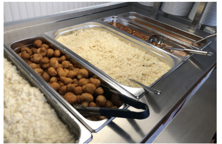
A finomságok kínálják magukat, csak szedni kell belőlük

Schwartz Béla polgármester örömet fejezte ki, hogy a körülmények is megújultak. Beszélt arról is, hogy Ajka mindig figyel minden olyan kezdeményezésre, amely a modern életmódot és a fejlődést szolgálja így az étkezés területén is. Felidézte, hogy néhány évtized alatt hatalmas változáson ment keresztül a