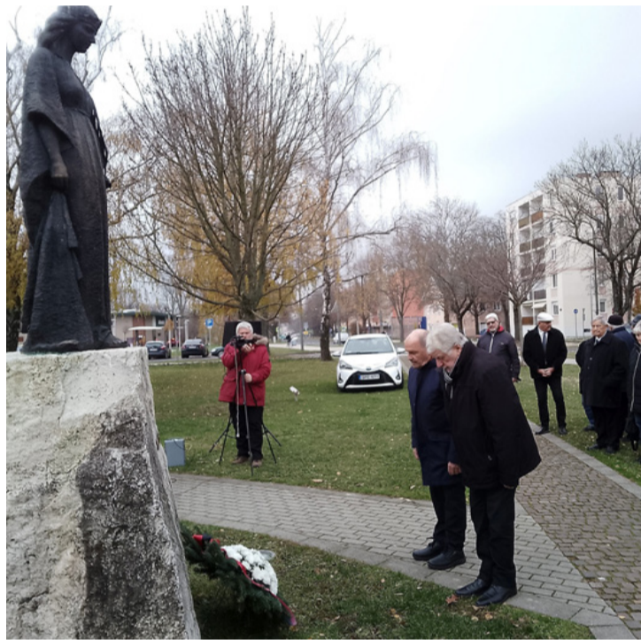
Az alpolgármesterek főhajtása a Borbála szobor előtt

A hagyomány szerint Szent Borbála a bányászok, kohászok, tüzérek, harangöntők védőszentje és újkori városcímerünk fő alakja. Ünnepe december 4-e.