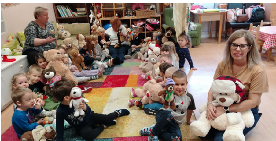
Óvodások és mackók sereglere a Hétszínvirágban