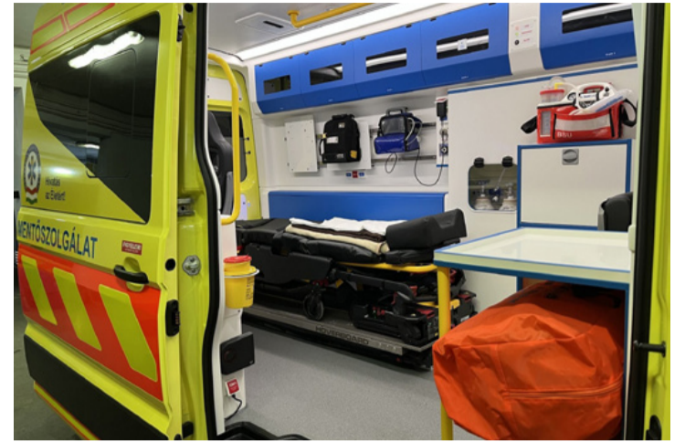
Kevesen szeretnék belülről is látni