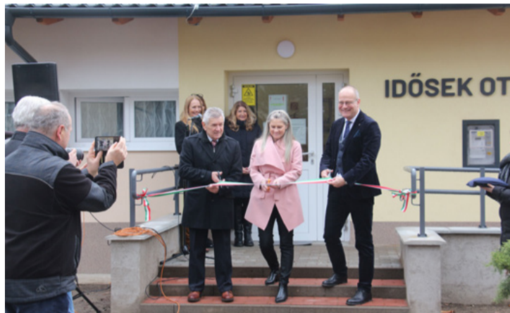
Pont a korszerűsítés végén

■ Befejeződött az Idősek Otthonának és az Időskorúak Gondozóházának teljes körű energetikai korszerűsítése, amelyet január 30-án ünnepélyes keretek között adtak át. A fejlesztés korszerűbb, energiatakarékosabb és biztonságosabb környezetet teremt az intézményben élők és az ott dolgozók számára. Az átadón részt vett Navracsics Tibor közigazgatási és területfejlesztési miniszter, a térség országgyűlési képviselője, valamint Schwartz Béla polgármester.