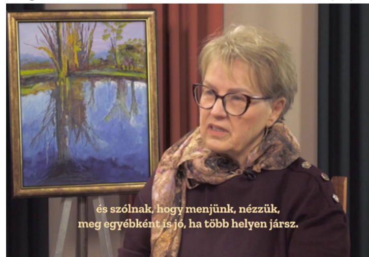
és szólnak, hogy menjünk, nézzük, meg egyébként is jó, ha több helyen jársz.