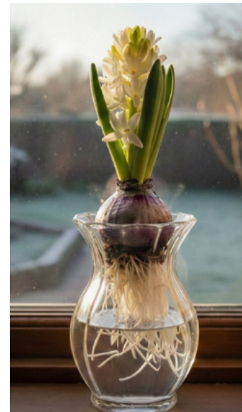
A jácint a tavasz előhírnöke

Fontos megjegyezni még pár tipikus bakit, amivel elronthatjuk a palánták sike-