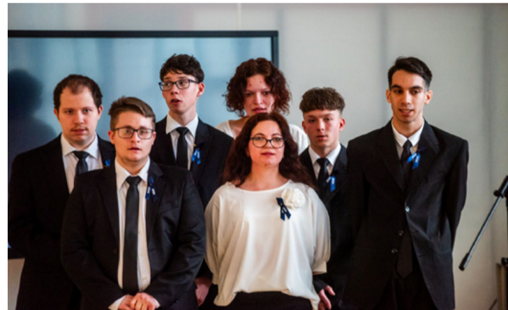
Bizakodva néznek a jövőbe az új végzősök

A diákoknak elmondta, hogy nemcsak tanulók, ha-