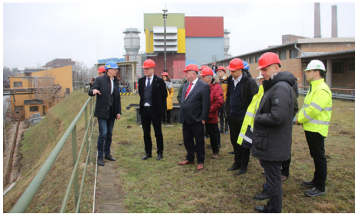
Az energiatároló egység főbb berendezései részben konténerekben, részben szabadterén lesznek elhelyezve. A fejlesztés műszaki megvalósítása várhatóan 2026. június 30-ra fejeződik be

Az eseményen részt vett Navracsics Tibor közigazgatási és te-