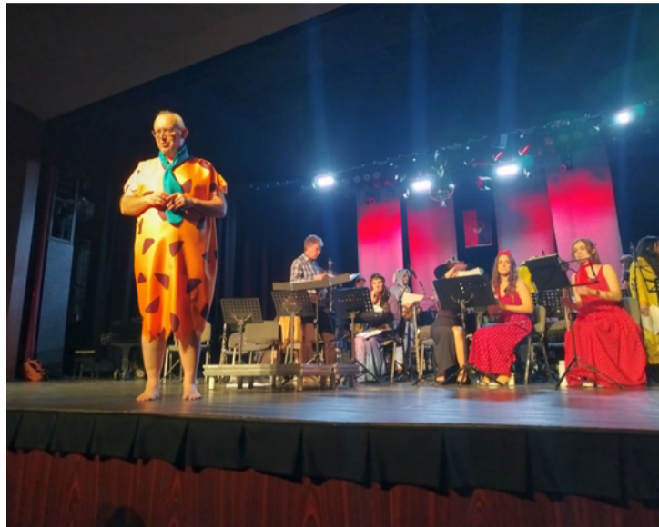
A koncert pillanatai

■ Telház előtt zajlott az Ajka-Csingervölgyi Zeneegylet Bányász Fúvószekara 41. alkalommal megtartott télbúcsúztató koncertje február 21-én a Nagy László Városi Művelődési Központban. A zenekedvelők már a kezdés előtt fél órával gyülekeztek. Érkeztek egykori zenekari tagok, akik az együtt töltött évekre emlékeztek, jelenlegi zeneiskolások, hozzátartozók.