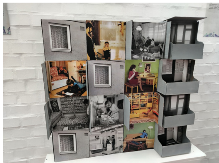
Panelakás installáció a kiállításon

A Városszépítő Egyesület és a Városi Múzeum közös tárlata nem csupán fotók sorozata, hanem egy nosztalgiaival teli időutazás, amely a folyosón, a Borsos Miklós és az Iparos teremben várja a látogatókat. Az érdeklődők megtudhatják, hogy milyen volt az élet, az akkor még 35 ezer fős, dinamikus fejlődő városban. A falakon sorakozó archív felvételeken megelevenednek a jól ismert helyszínek: a Sétáló utca egykori üzletei, a haditechnikai és közlekedési park, a játszótérek. Az egykori delikát, az ott kapható árúk a mai ötveneseknek és idősebbeknek szép emlékek. A mobiltelefon és az internet előtti időben a játszótér volt a kapcsolati háló. Szünidőben és iskola után ott találkoztak a közeli panelokban lakó külsős gyerekek.