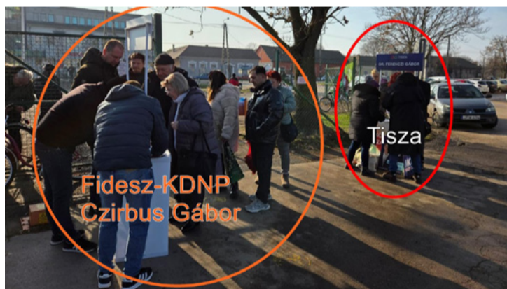
Az igazság valahol a kettő között lehet

Lehet, hogy mindezt rosszul látom. Lehet, hogy a múlt emléke szelídebb, mint a valóság volt. De egy dolgot biztosan tudok: a hiba akkor válik igazán veszélyessé, amikor már nem zavar senkit. Amikor nem baki, hanem gyakorlat. Én pedig maradok egy szürke újságíró a régi iskolából, aki még mindig hisz abban, hogy a pontosság nem apróság kérdés.