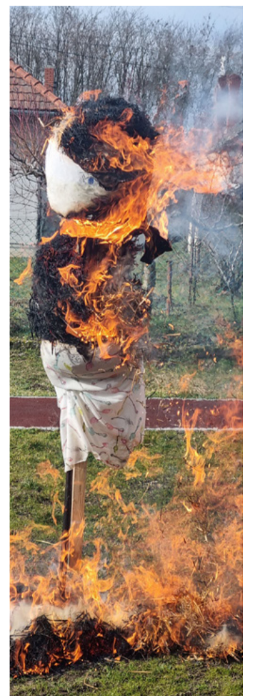
Télbúcsúztató szalmabábégetés – a hagyomány a pogány világ ködébe vész