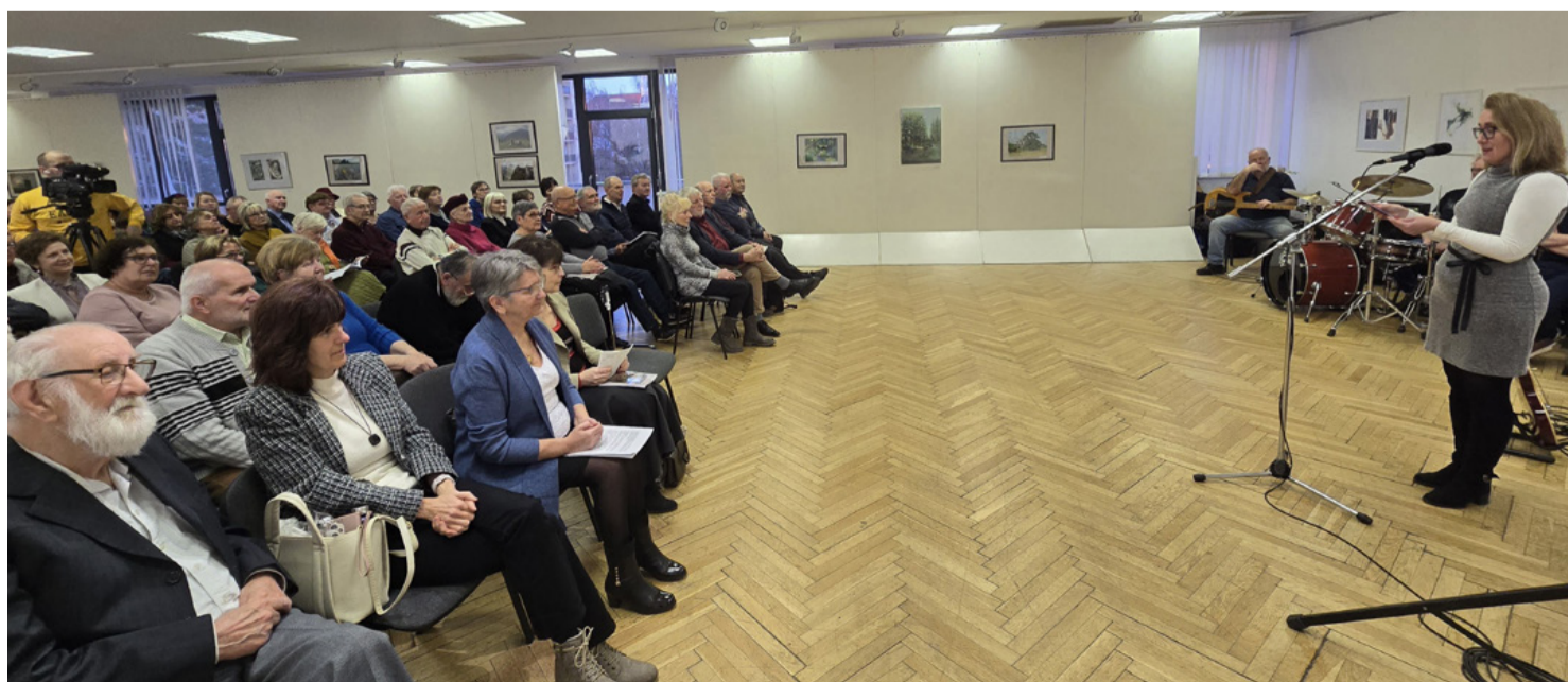
A szokásos nagy érdeklődés kísérte a helytörténeti folyóirat megjelenését