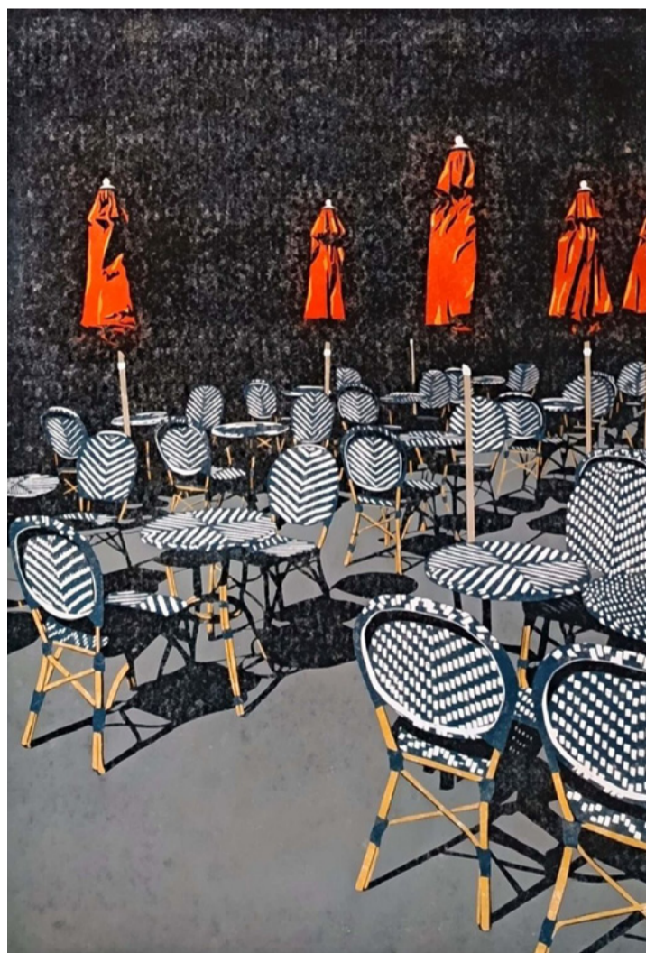
Egy jellegzetes kép a kiállítás anyagából