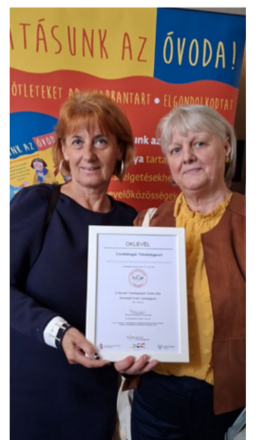
Az óvodapedagógusok az oklevéllel