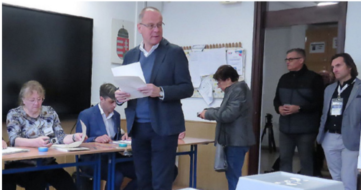
Merre van egy egyetemi katedra?