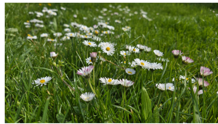
Százszorszép vagy pipitér?

A tyúkhúr apró, puha szőnyegként jelenik meg, és gyakran azt mutatja, hogy a talaj nedves, hűvös, és tápanyagban inkább szegényes. Ő az a növény, ami mindig