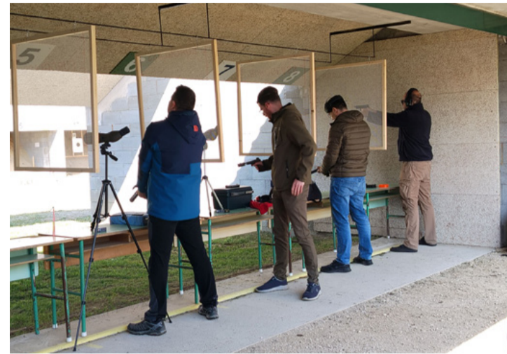
Versenyzés közben a megújult lőállásban