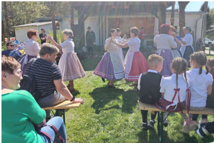
A rendezvények szikrázó tavaszi napsütésben zajlottak

■ Kellemes szombat délutáni program az erdő szélén, a természet lágy ölén néptáncot és zumbát nézni, érezni a frissen sült lángos illatát, miközben a langyos tavaszi szél simogatja az arcunkat. Az idei Erdő- és Fa Fesztivállal a Csingervölgyért Egyesület bebizonyította: a völgynek nemcsak múltja, hanem rendkívül erős és összetartó jelene is van.