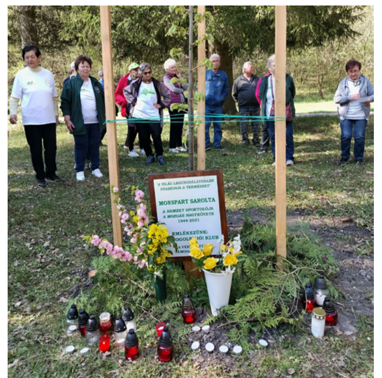
Virággal és mécsessel emlékeztek a hársfánál Monspart Saroltára a gyaloglók

– 2021. április 24.) a Nemzet Sportolója, tájfutó világbajnok, tizennégyeszeres magyar bajnok. Az első nő Európában, aki három órán belül futotta le a maratoni távot.