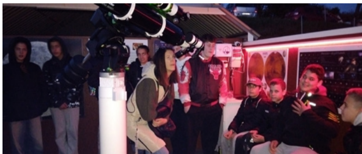
Távolságokat tanulmányoztak távcsővel a tinédzserek

A látogatóknak szerencséjük is volt, ugyanis az előző napok felhős időjárása után estére kitisztult az égbolt, így jól láthatóvá váltak az égitestek. A gyerekek kérdéseket tettek fel többek között az égitesteknek a Földtől mért távolságáról, arról, hogyan alakultak ki a Hold kráterei, milyen mélyek, és milyen a felszínén a hőmérséklet. Az is érdekelte őket, hogy más bolygón van-e élet, és hol tart jelenleg az űrkutatás. (ta) ■