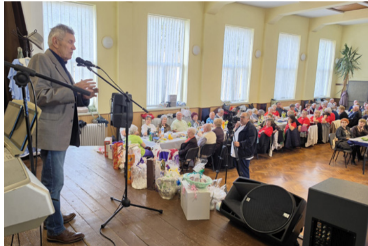
A polgármester minden alkalmat megragad, hogy a város helyzetéről és terveiről beszámoljon a helyi polgároknak

A pénzügyi nehézségek és a magas állami elvonások ellenére a városvezető rengeteg pozitívumról is be tudott számolni. Külön kiemelte, hogy az Ajkára látogatók egybehangzó véleménye szerint a település gyönyörű, ami a fejenként harminckét négyzetméternyi gondozott zöldterületnek is köszönhető. A szépülés - a Zöld világvérsenynek hála - mind a kilenc városrészben folytatódik. A helyi fejlesztésekre rátérve elmondta, a cséküti temetővel szemben már épül a parkoló, hamarosan befejezik a padragi temető parkolóját is, a klímataudatosság jegyében pedig minden város-