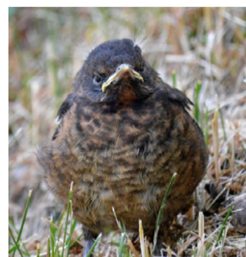
A fekete-rögű fióka köszöni, jól van

Az ember nem tudja megtanítani a madarat a túléléshez szükséges viselkedésre, és a nem megfelelő táplálás akár maradandó károsodást