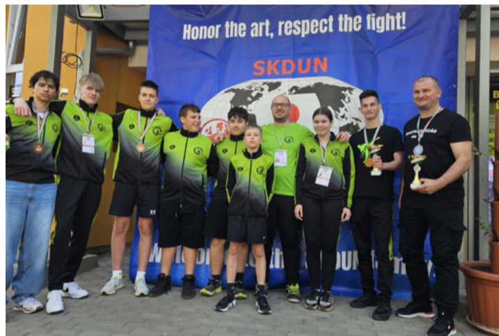
A Sun-Dome lelkes csapata az egr megmérettetésen

A tavaszi szezon egyik kiemelt versenye volt az egr SKDUN Európa-bajnokság, ahol 22 ország, több, mint 900 versenyzője mérette meg magát 4 napon keresztül Egerben, április közepén.