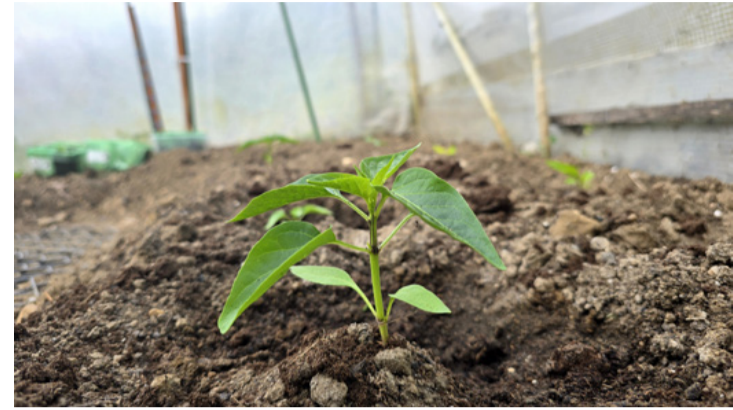
Szemet gyönyörködtető paprika palánta a fólia alatt

A fóliás termesztés során külön figyelmet kell fordítani a hőmérséklet és a páratartalom szabályozására. A paprika kedveli a meleget, ugyanakkor a túlzott párasodás kedvez a gombás betegségek kialakulásának, ezért rendszeres szellőztetés szükséges. Locsolásnál se essünk túlzásba. Ne álljon vízben, de ne is száradjon ki. Inkább ritkábban kapjon, akkor viszont alaposan. A gyökere lefelé dolgozik, ha hagyjuk. Egy