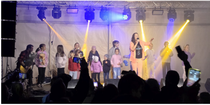
Az esti programot a gyerekek is nagyon élvezték

■ Délután a Csónakázó-tó melletti rendezvényterén folytatódott a program. A ligetben igazi majális hangulat volt, körhinták, virsli, sör, lángos, jégkása, és amerre a szem ellátott, vidám emberek. A parkoló gépkocsiknak is bőven volt hely.