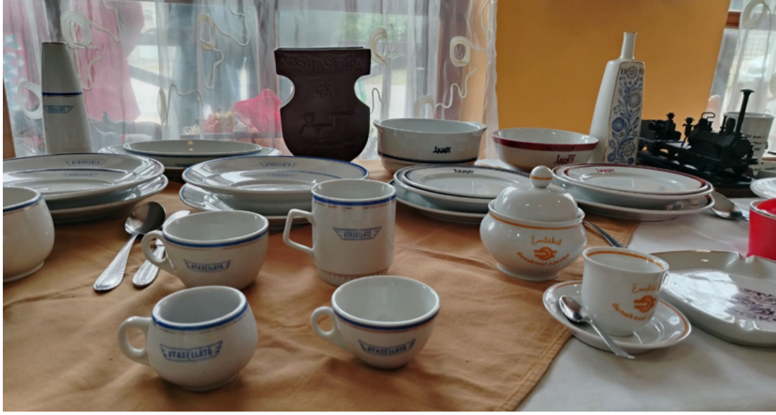
Volt egyszer egy Utasellátó...