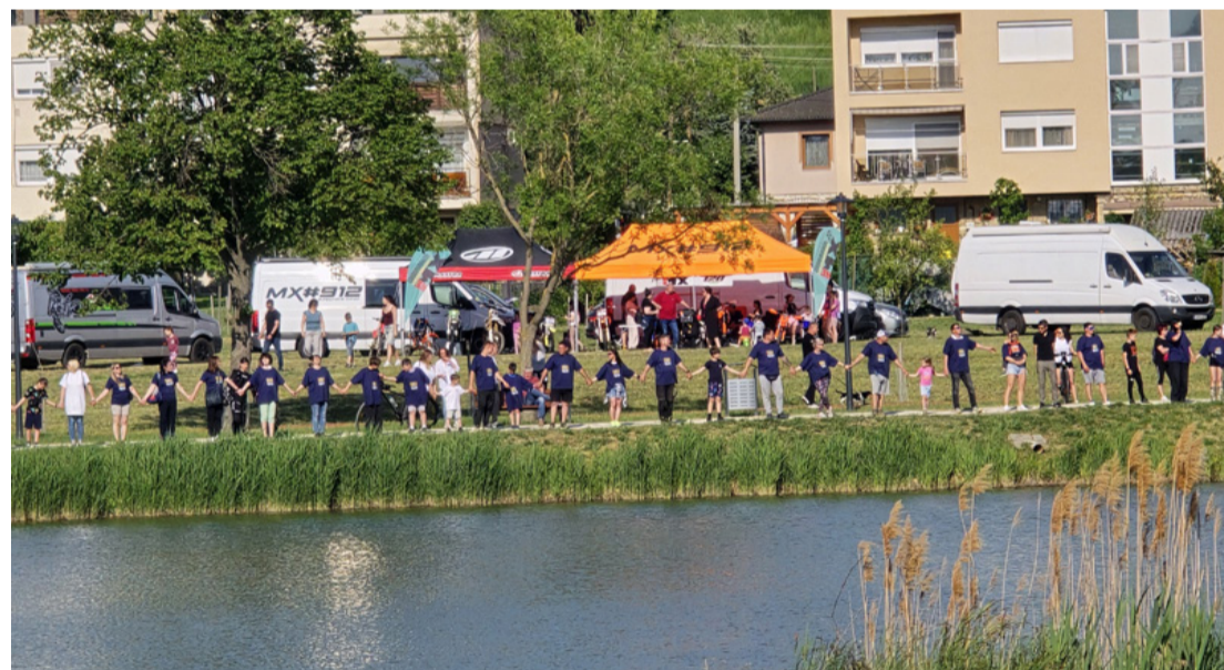
Az ajkaiak körbeölelték szeretett tavukat