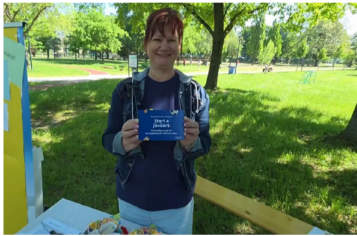
A csékűtiak szeretnék, ha minél több fiatal sportolna Ajkán

A tó körüli élőlánc során a résztvevők egymás kezét fogták, majd a program végén kö-