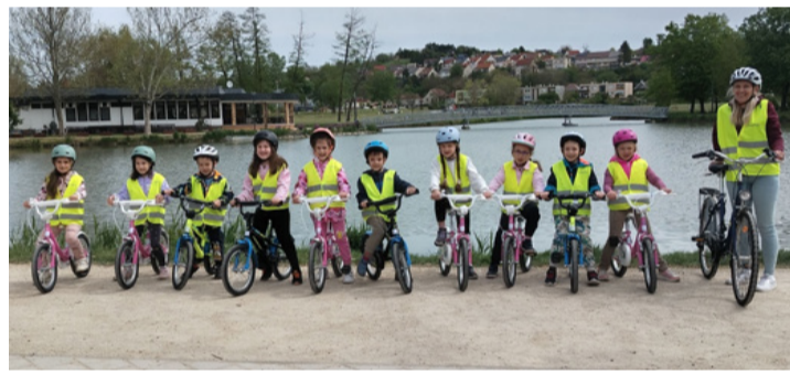
Ovisok a tóparton. Talán nem is sejtik, hogy most fejlesztik a térérzékelésüket