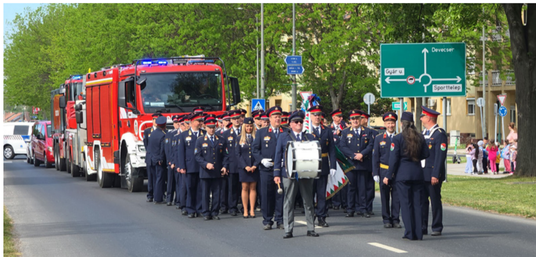
A felvonulók a Petőfi utcán